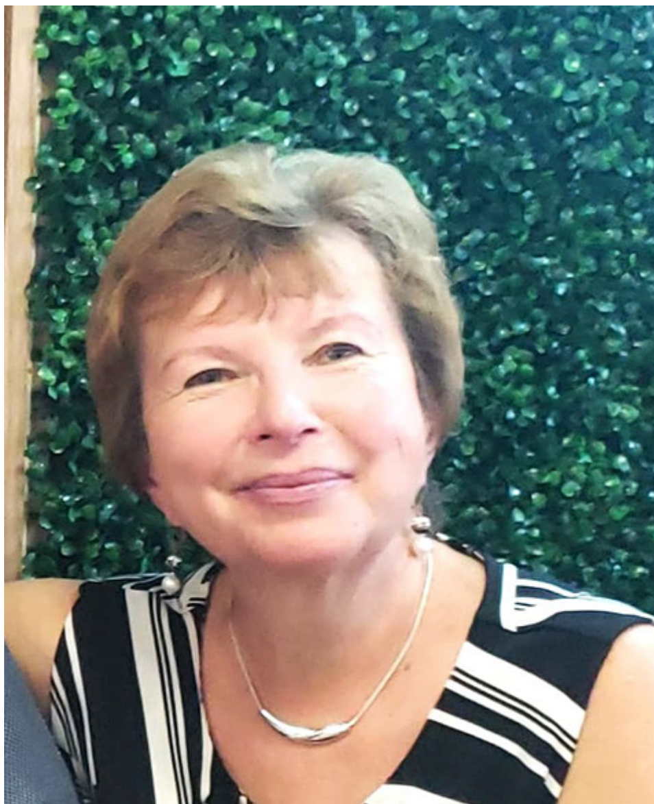
Irina Choroschewskaja © Foto aus dem Archiv des Autors