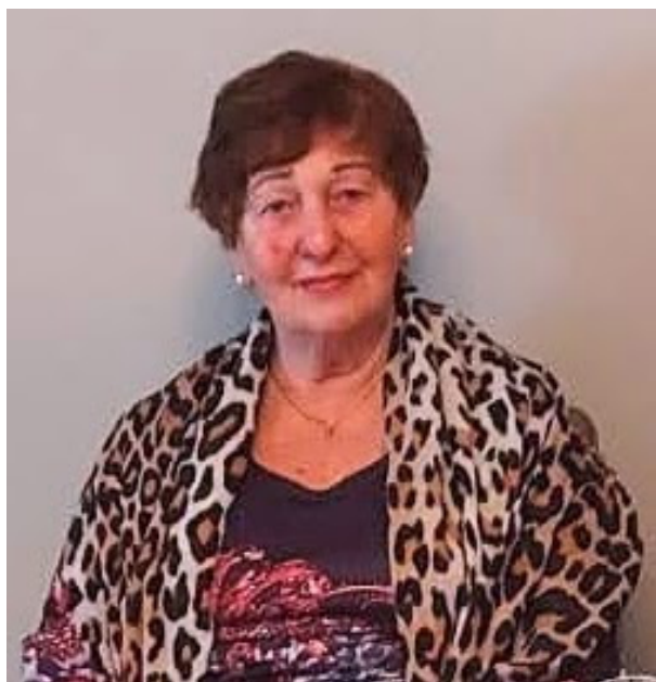
Isabella Bondarenko © Foto aus dem Archiv des Autors

„Besonders hervorheben möchte ich, dass die meisten Persönlichkeiten, von denen dieses Buch erzählt und die jener schrecklichen Zeit entkommen konnten, noch viele Jahre weiterlebten. Sie setzten ihre Arbeit fort, gründeten Familien und konnten ihre Kinder und Enkel aufwachsen sehen. Einige kehrten nach Deutschland zurück, andere fanden in Israel oder in den Vereinigten Staaten eine neue Heimat.“