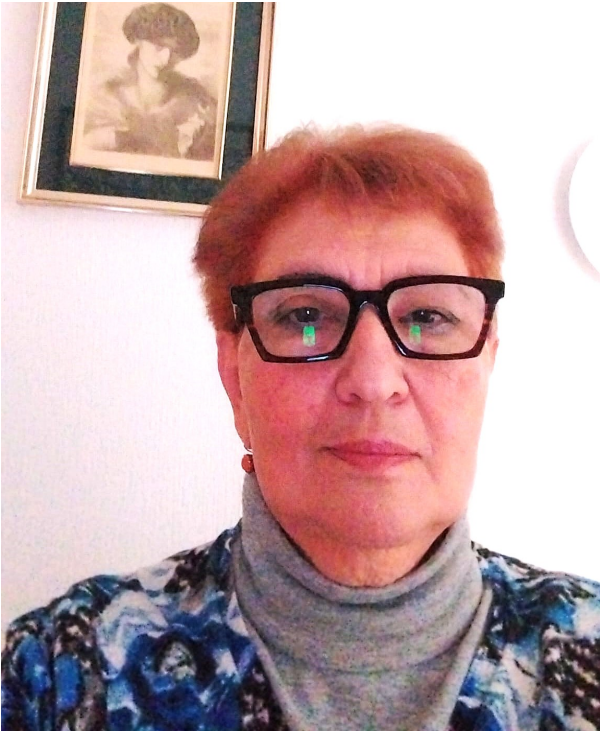
Sofja Terentjewa

Dann wandte sich Sofja – wie man so schön sagt – dem Autor selbst zu: