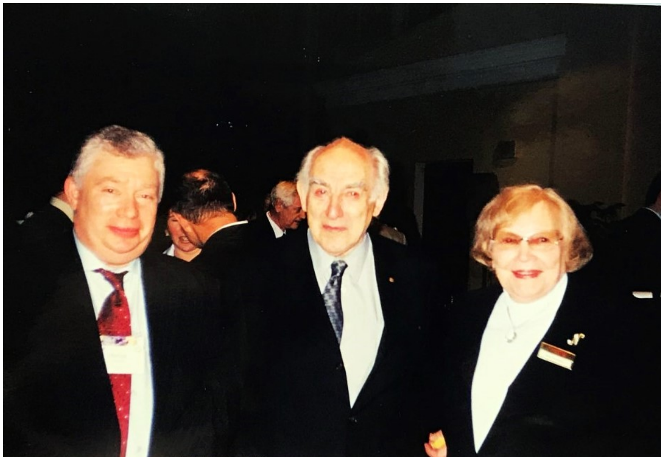
Михаил Френкель, академик Виталий Гинзбург с супругой, Москва, 2004 г.