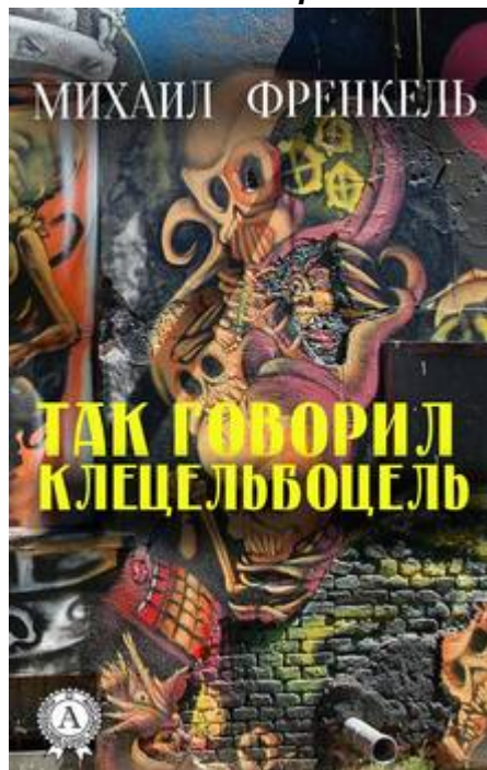
Обложка книги М.Френкеля «Так говорил Клецельбоцель»