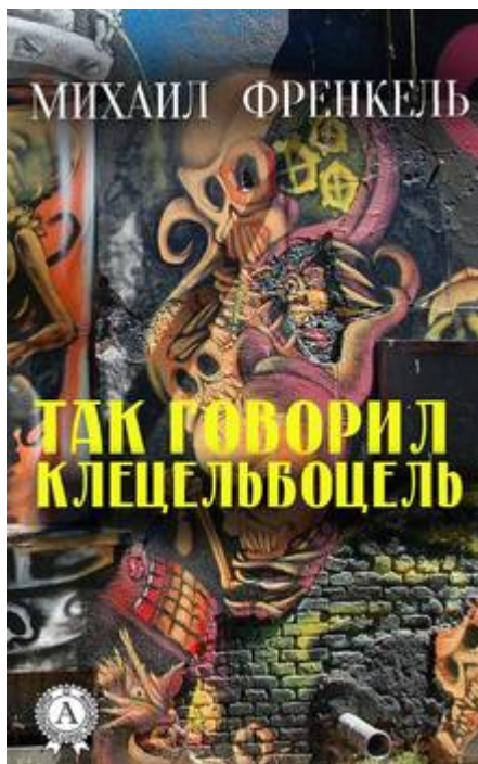
Das Cover des Buches von M. Frenkel „So sprach Kletselbozel“