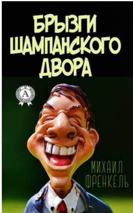
Das Buch von Michail Frenkel „Schaumperlen des Hofes“