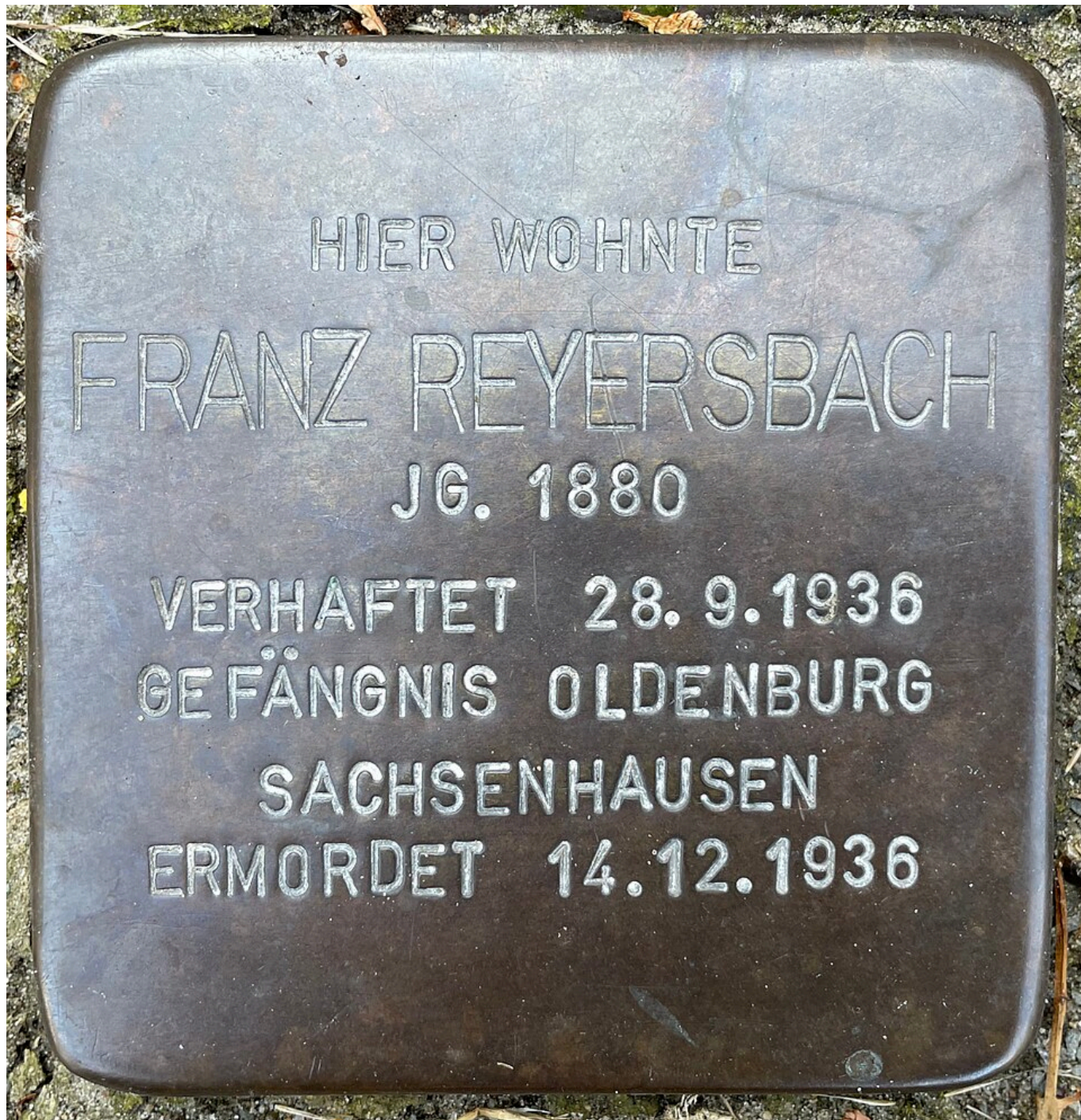
„Der Stolperstein“ zu Ehren von Franz Reyersbach, Oldenburg