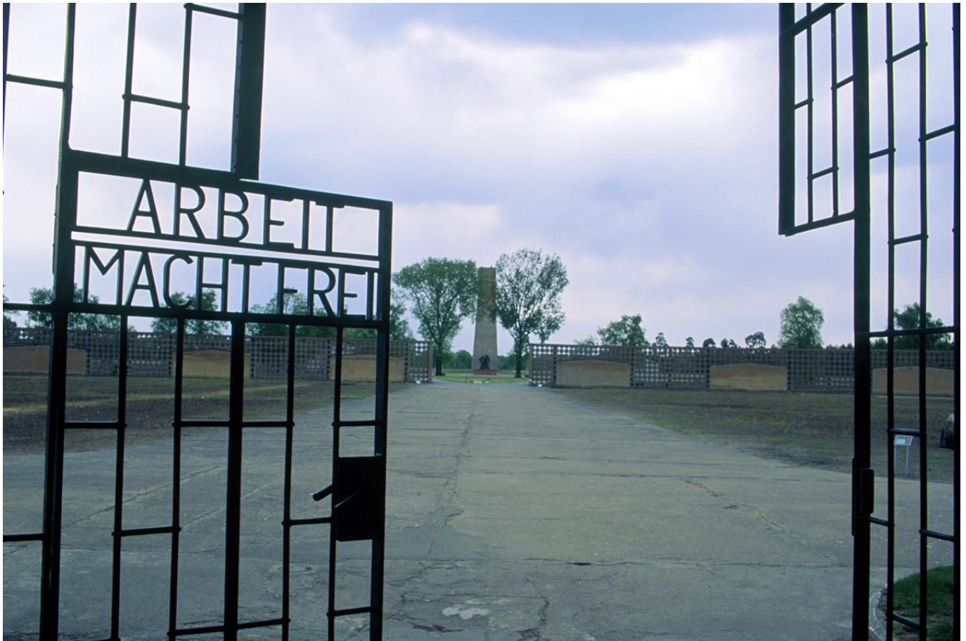
Konzentrationslager Oranienburg-Sachsenhausen