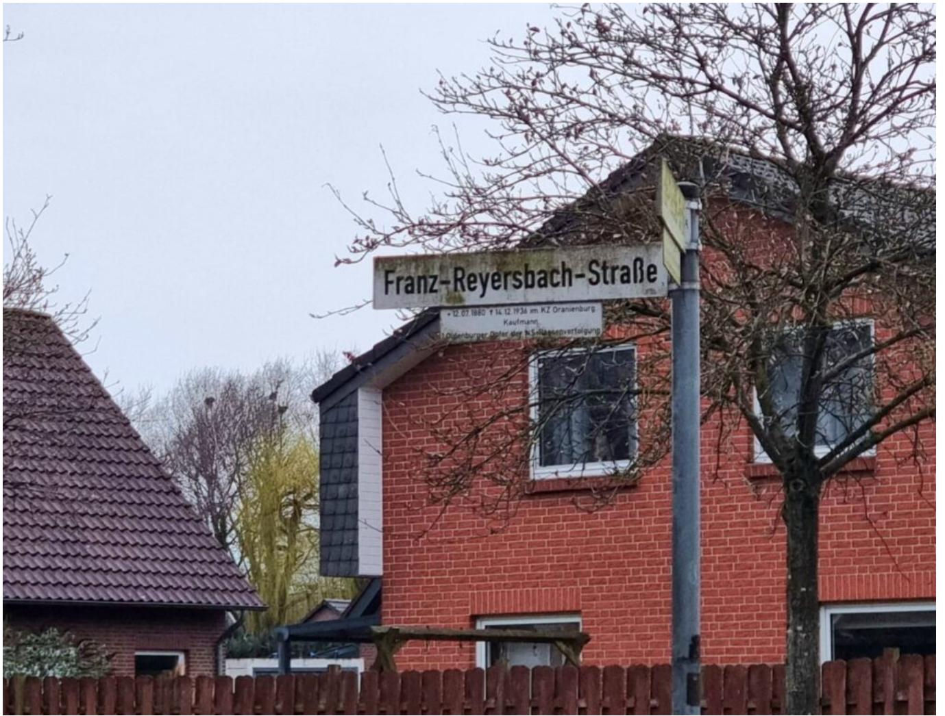
Franz-Reyersbach-Straße, Oldenburg, aktuelle Aufnahme