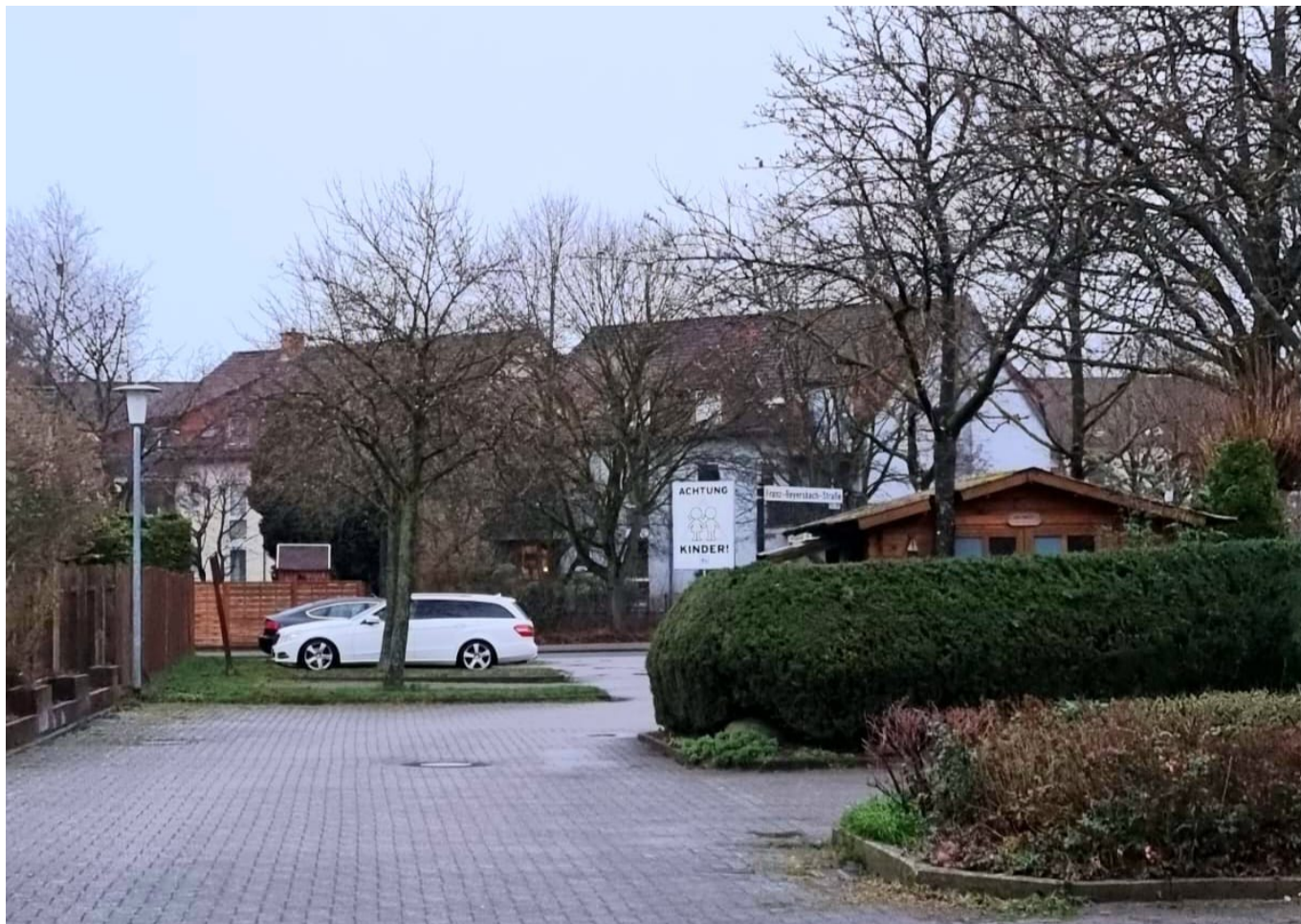
Franz-Reyersbach-Straße, Oldenburg, aktuelle Aufnahme