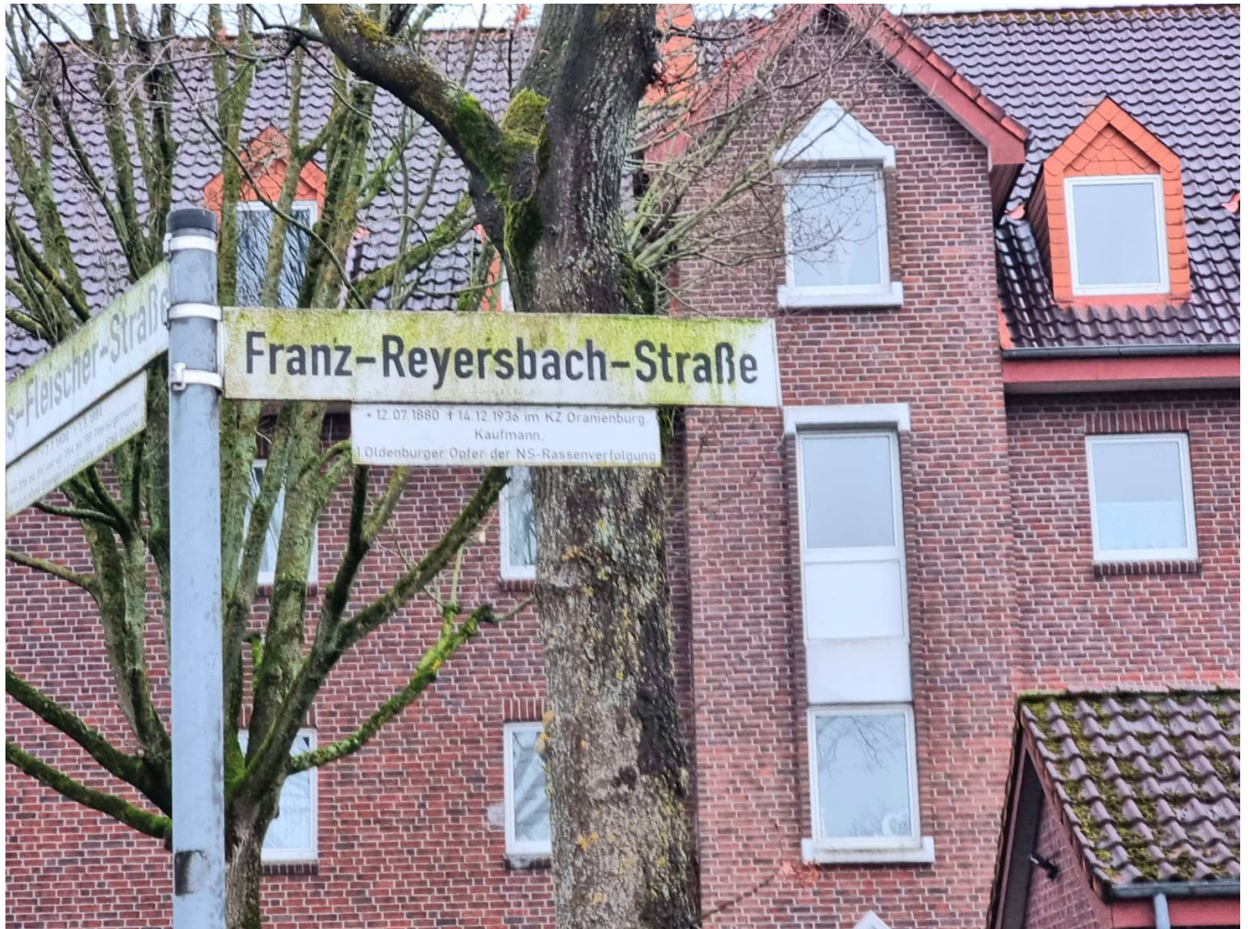
Straßenschild mit dem Namen Franz Reyersbach, Oldenburg, aktuelle Aufnahme