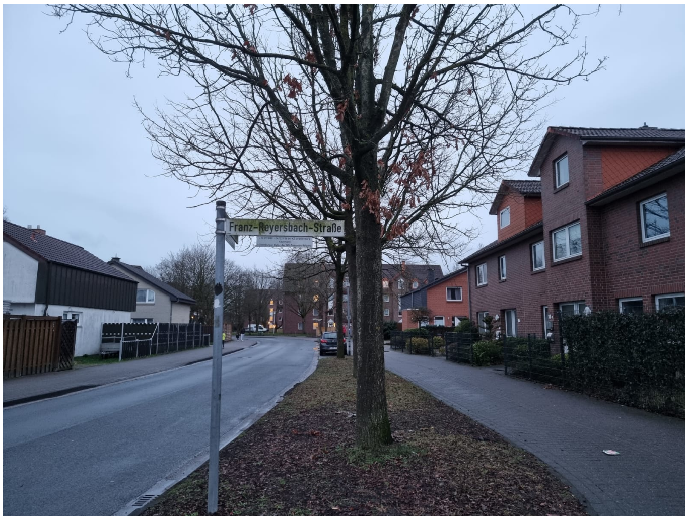
Franz-Reyersbach-Straße, Oldenburg, aktuelle Aufnahme