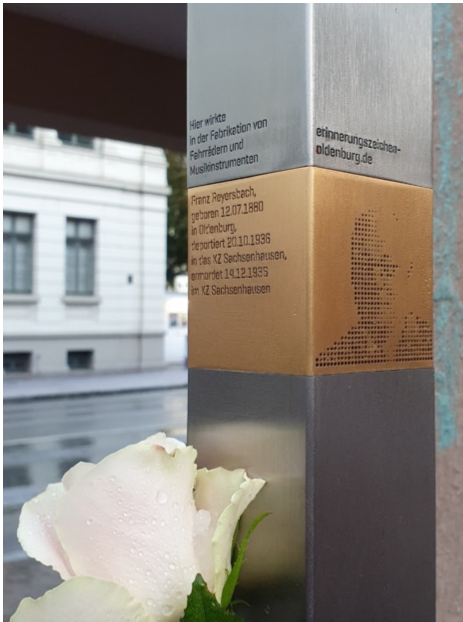
„Erinnerungszeichen“ zu Ehren von Franz Meyersbach in der Damm 4, Oldenburg.

So haben die Stadt Oldenburg, das Alte Gymnasium Oldenburg sowie Privatpersonen das Andenken an den erfolgreichen Unternehmer und liberalen Politiker Franz Meyersbach bewahrt. Er war eines der ersten Opfer der nationalsozialistischen Judenverfolgung in Oldenburg.