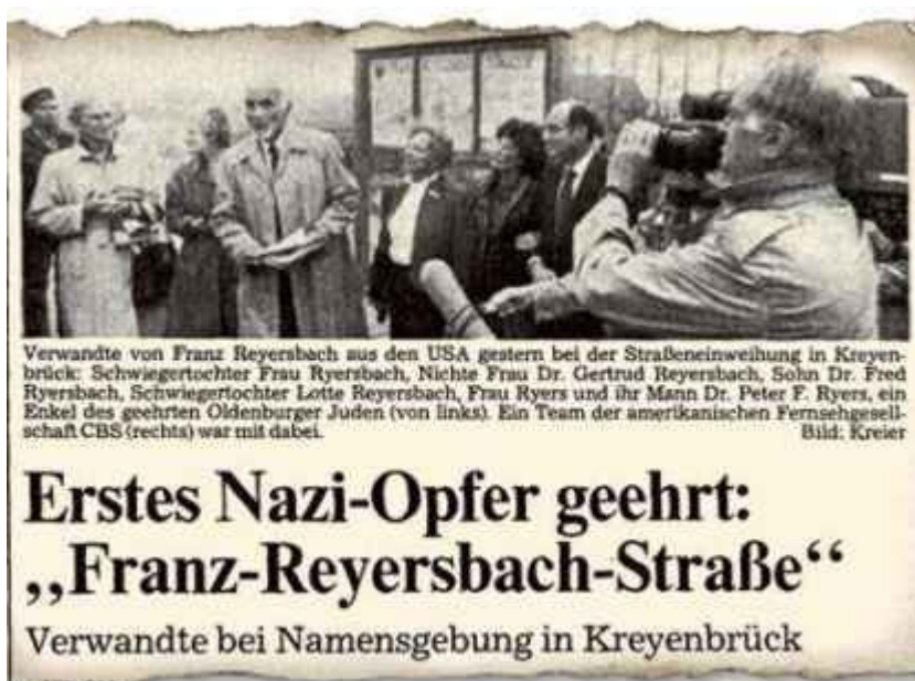
Ausschnitt aus der Zeitung NWZ, 1985