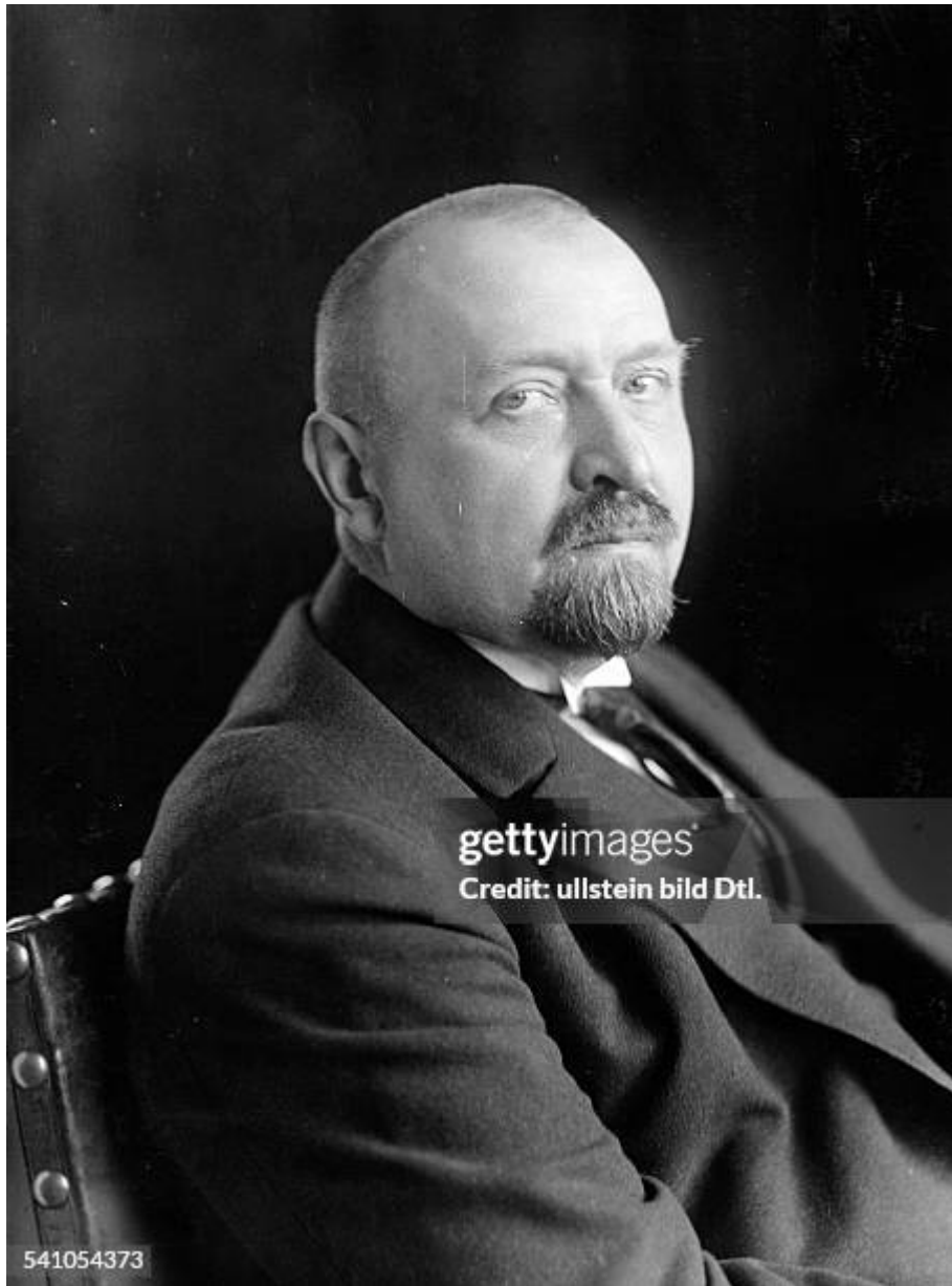
Theodor Tantzen (1877 – 1947)

Franz Reyersbach wird in verschiedenen Veröffentlichungen als Mitbegründer und aktiver Befürworter der Deutschen Demokratischen Partei (DDP) in Oldenburg gewürdigt. Hervorgehoben werden zudem seine persönlichen Verbindungen zu einflussreichen Vertretern der liberalen Politik in der Region, insbesondere zu Theodor Tantzen, dem Ministerpräsidenten des Freistaats Oldenburg. Als einflussreiche politische Persönlichkeit innerhalb der DDP gehörte Reyersbach zu den ersten Kritikern der NSDAP.