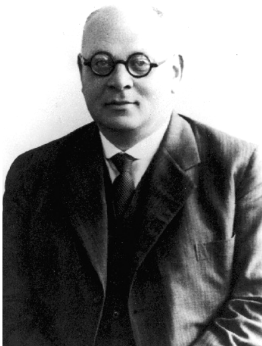
Der Unternehmer und Politiker Franz Reyersbach (1880–1936)

In dem vorherigen Kapitel dieser Essayreihe über jüdische Namen auf der Karte Oldenburgs habe ich unseren Lesern von dem Unternehmer und Kommunalpolitiker Leon Bukofzer berichtet. Er kam durch die Nationalsozialisten im