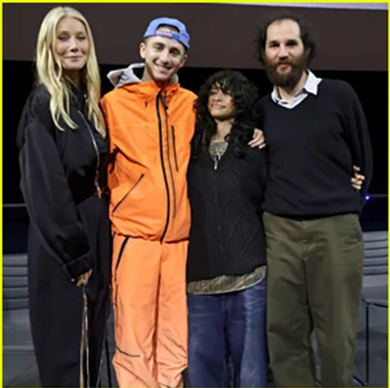
Von Links nach rechts: Gwyneth Paltrow, Timothée Chalamet, Odessa A`zion und Josh Safdie.