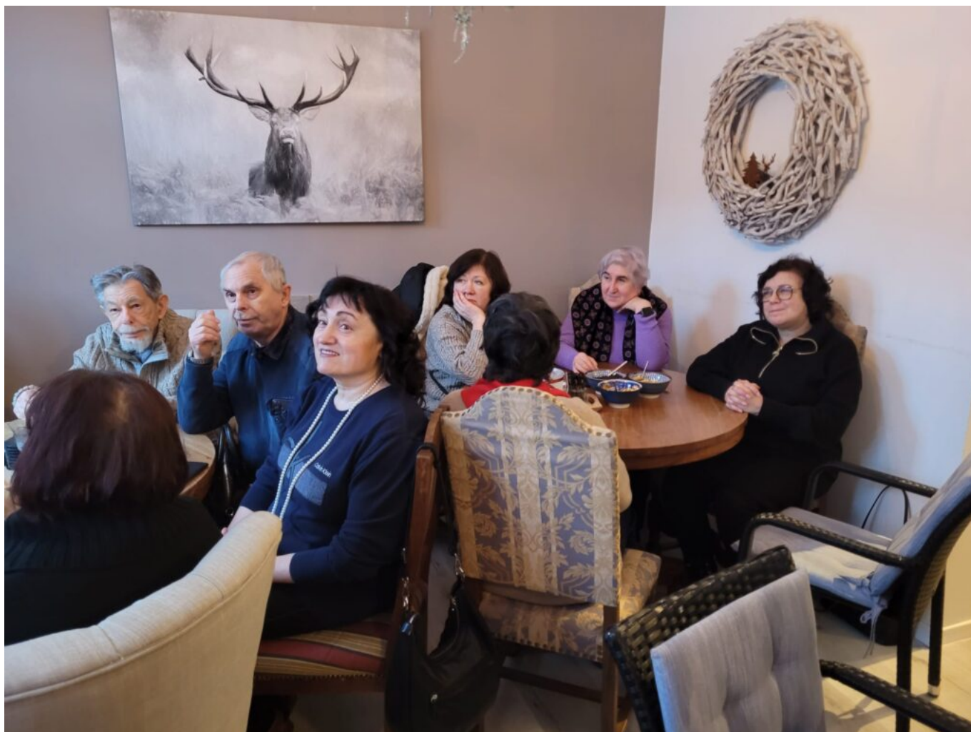
Члены ЛЕОО в кафе «Alte Backstube»