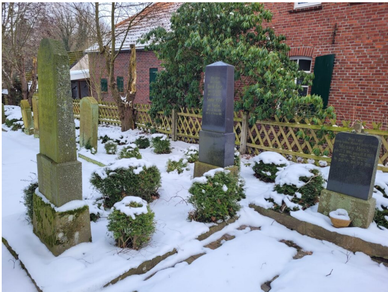
Старинное еврейское кладбище, Дорнум