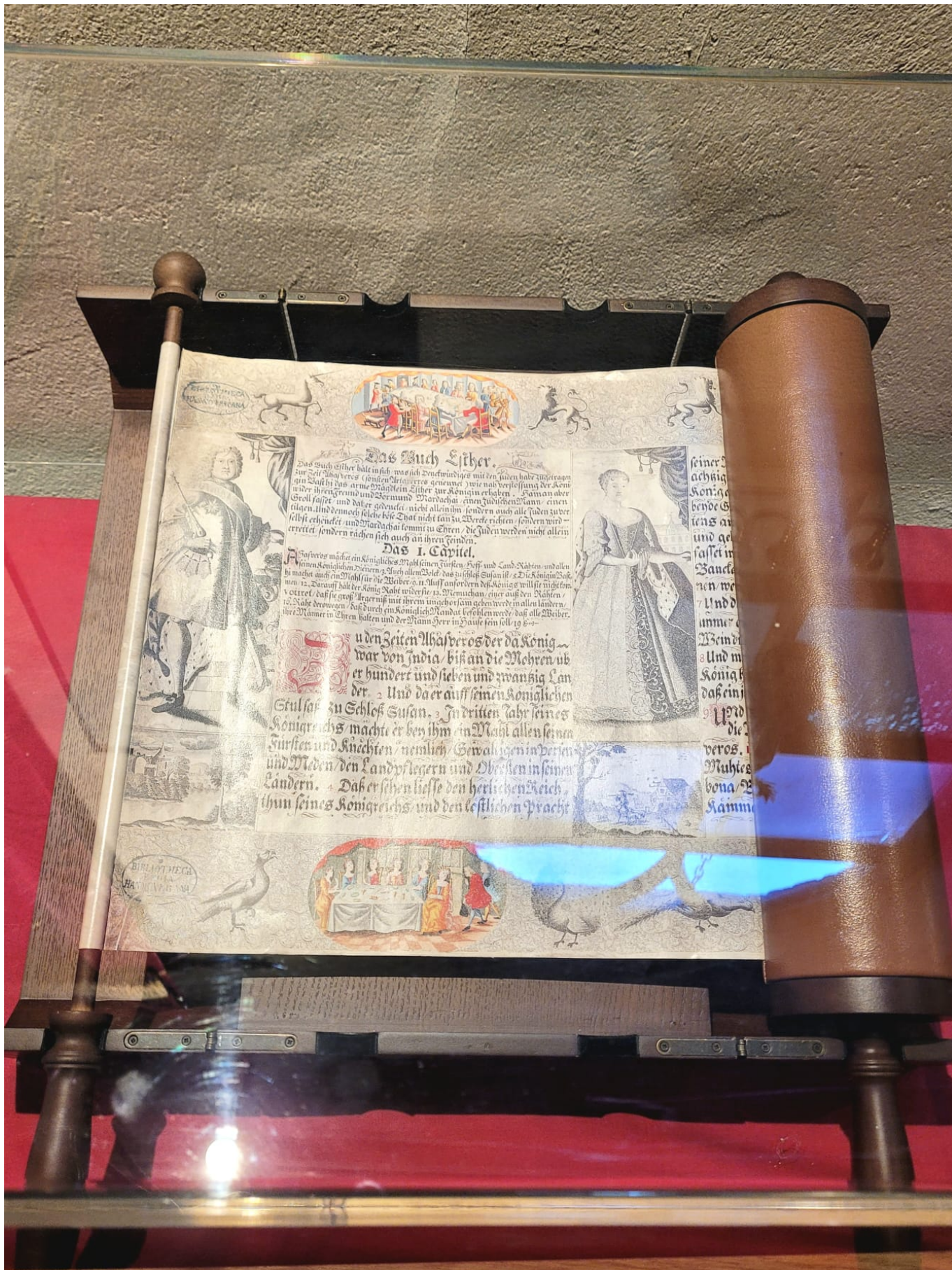
Некоторые экспонаты музея-синагоги