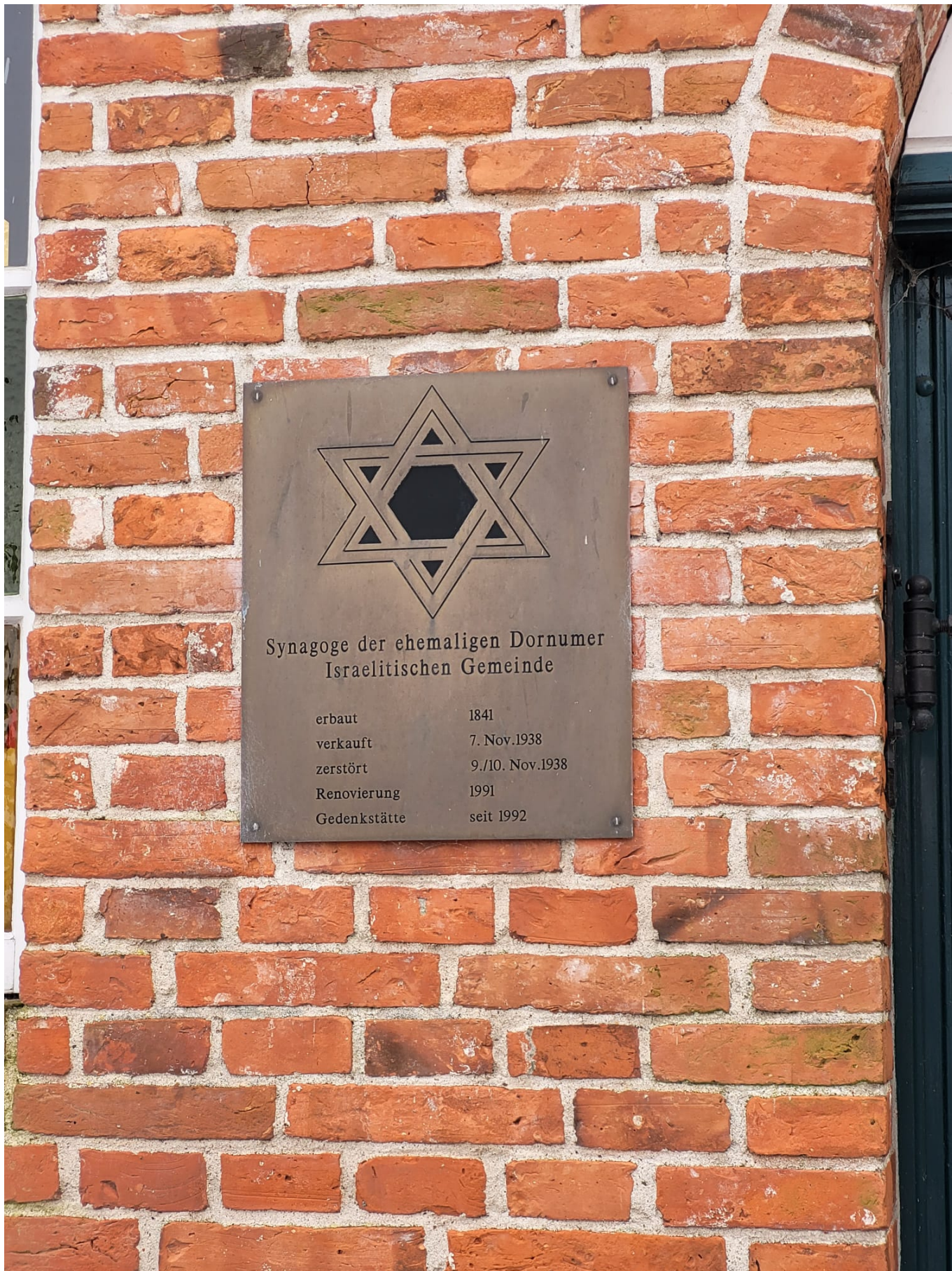
Памятная доска на здании синагоги, Дорнум