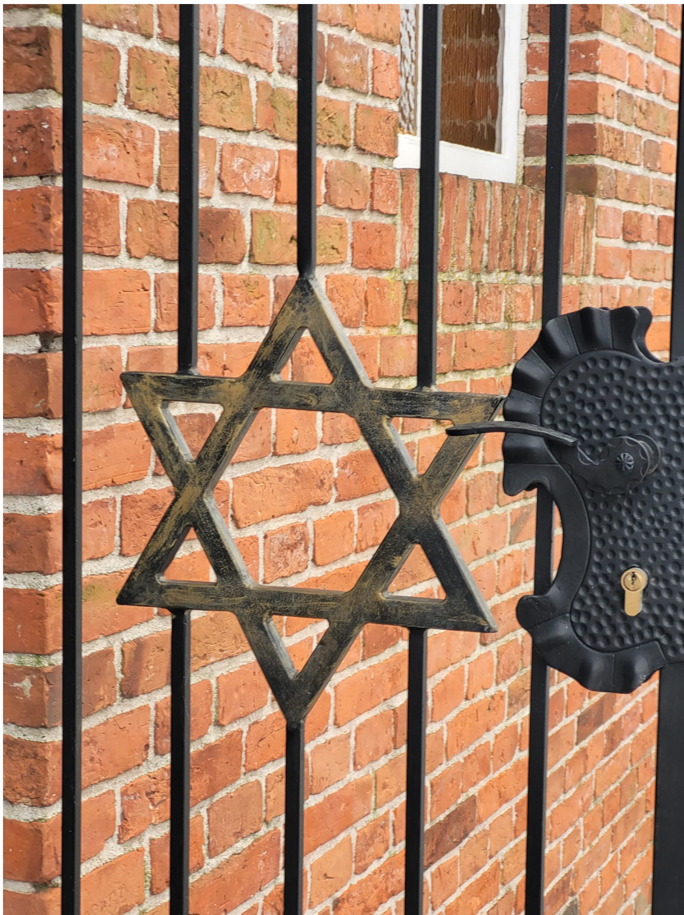
Звезда Давида на воротах синагоги, Дорнум

После окончания Второй мировой войны здание уже бывшей синагоги десятилетиями