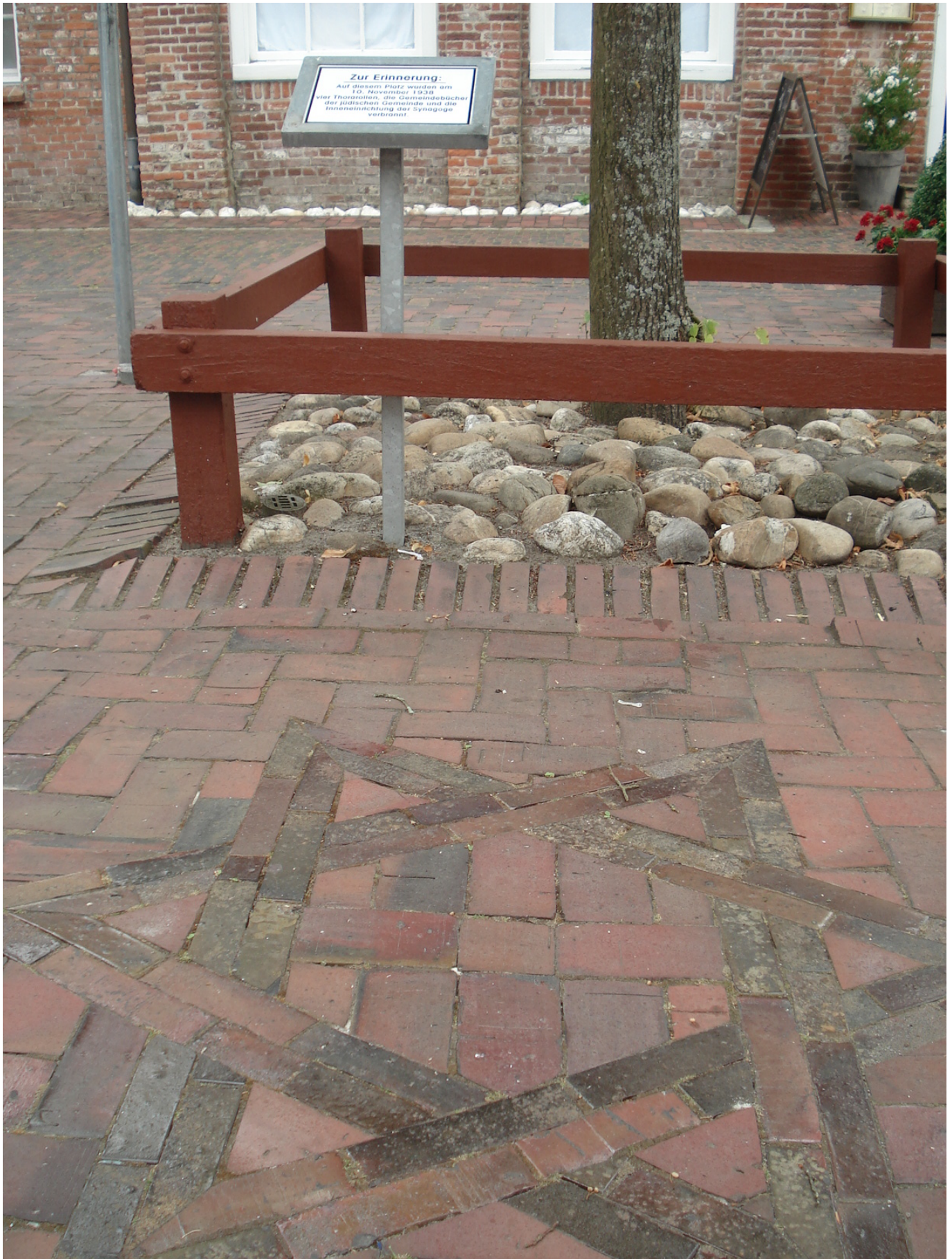
Gedenkzeichen auf dem Marktplatz, Dornum.

Am 7. November 1938, also drei Tage vor der berüchtigten Reichspogromnacht,