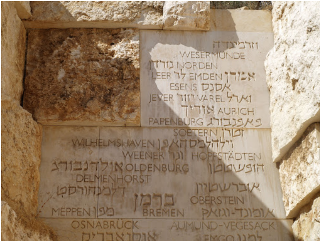
Fragment einer Wand im „Tal der Gemeinden“ (Valley of the Communities) der Gedenkstätte Yad Vashem mit den Namen ostfriesischer Gemeinden, Jerusalem.

Betrachtet man eine Karte Norddeutschlands, so erkennt man im Nordseegebiet die Inselkette des Ostfriesischen Archipels und die küstennahen Landschaften Ostfrieslands. Das Gebiet liegt im Nordwesten Niedersachsens und grenzt im Westen an die Niederlande. Die Kette der Ostfriesischen Inseln erstreckt sich dabei von der Emsmündung bis zum Jadebusen. Seit dem 16. Jahrhundert ließen sich hier Juden nieder. Über Jahrhunderte fanden die Mitglieder jüdischer Gemeinden mit der lokalen Bevölkerung, den Friesen, eine gemeinsame Sprache, auch wenn diese Beziehungen nicht immer ungetrübt waren. Dennoch gab es in dieser Region bis zur Machtergreifung der Nationalsozialisten mehr als ein Dutzend kleiner jüdischer Gemeinden mit Synagogen, jüdischen Schulen und Friedhöfen. Auch diese Gegend blieb vom Holocaust nicht verschont. Auf einer der Steinwände des Yad-Vashem-Memorials im „Tal der Gemeinden“ (Valley of the Communities) sind die Namen Norden, Leer, Emden, Jever, Varel, Aurich ... auf Hebräisch und Englisch eingemeißelt. Dies sind nur einige wenige ostfriesische Gemeinden von insgesamt mehr als 5.000, die die Nationalsozialisten während der Schoa, der Katastrophe des europäischen Judentums, vernichtet haben.