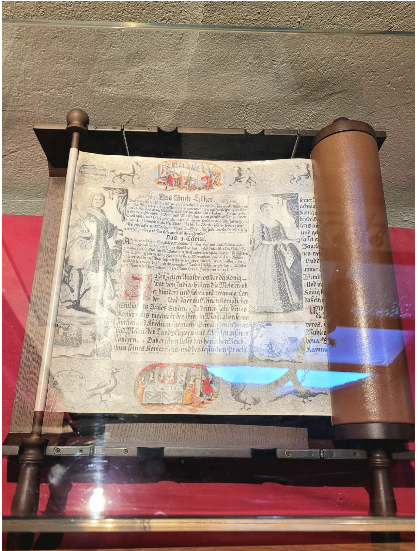
Einige Exponate des Synagogenmuseums.