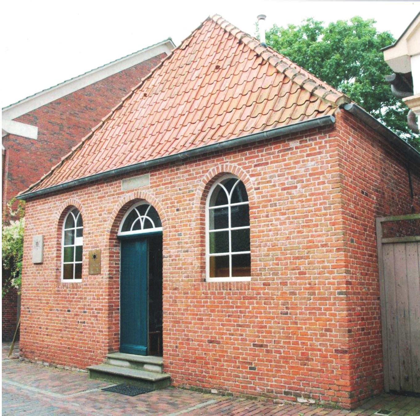
Synagoge in Dornum, aktuelle Aufnahme.