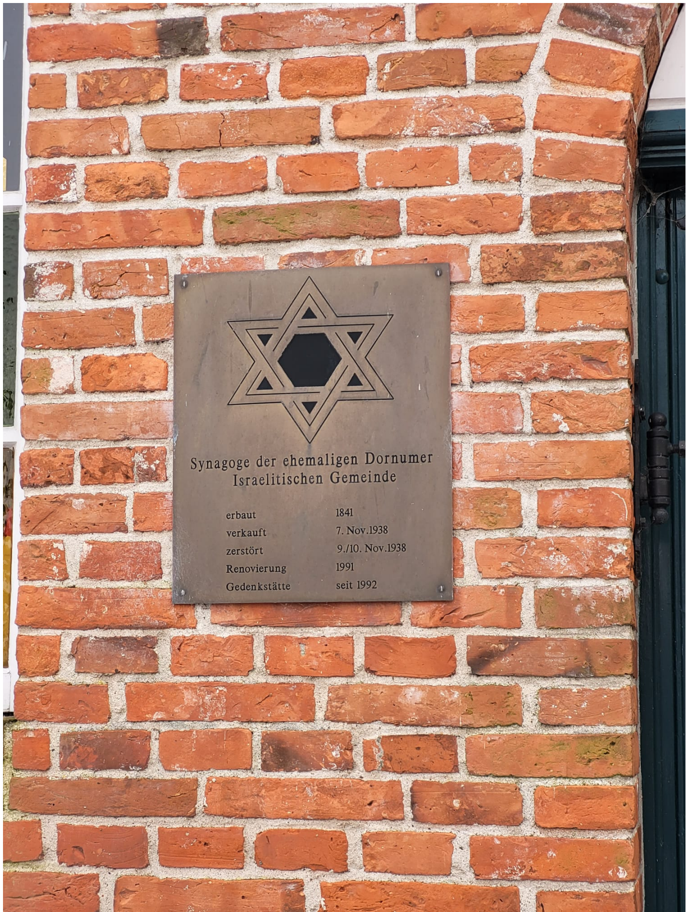
Gedenktafel am Synagogengebäude, Dornum.