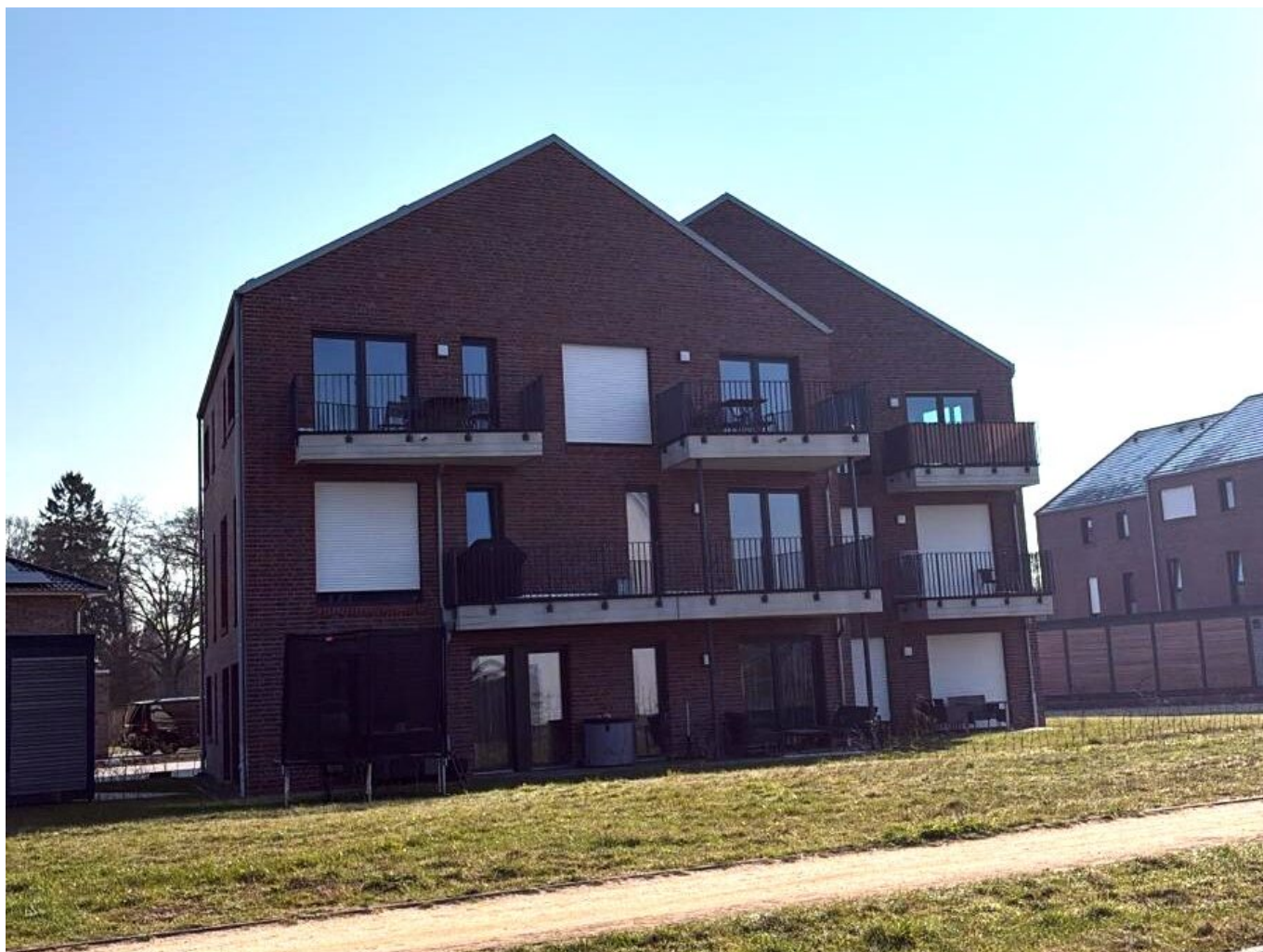
Hannah-Arendt-Straße, Oldenburg