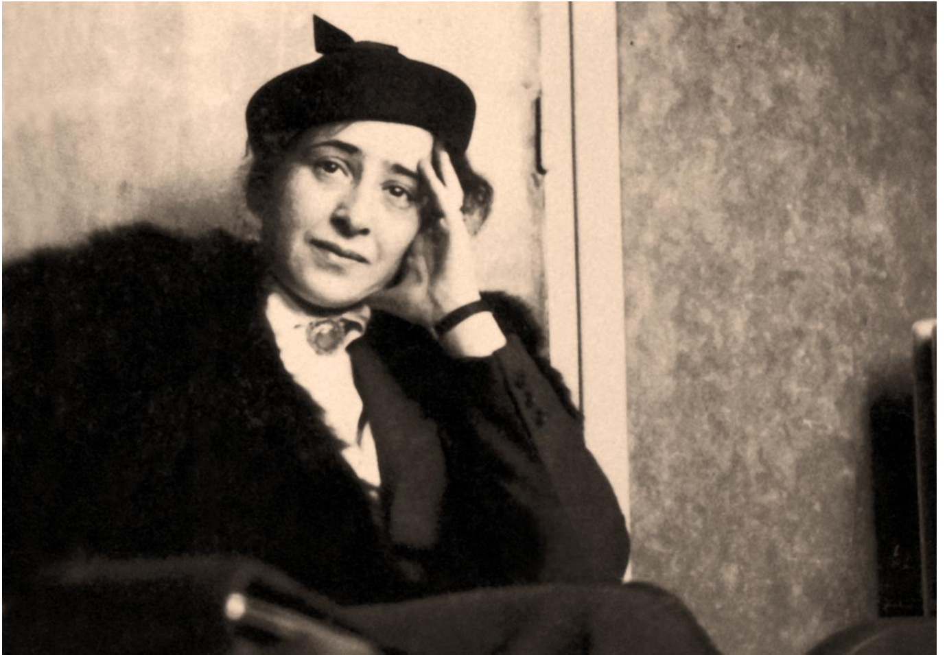
Hannah Arendt in New York City, Anfang der 1950er Jahre.