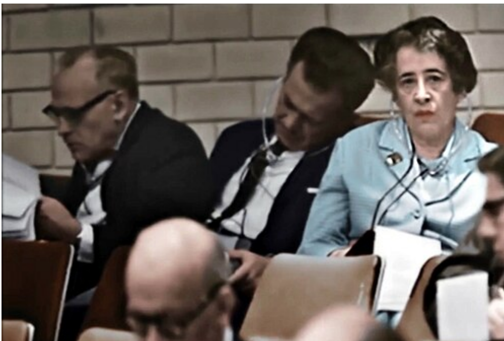
Hannah Arendt beim Prozess gegen Adolf Eichmann, Jerusalem, 1961