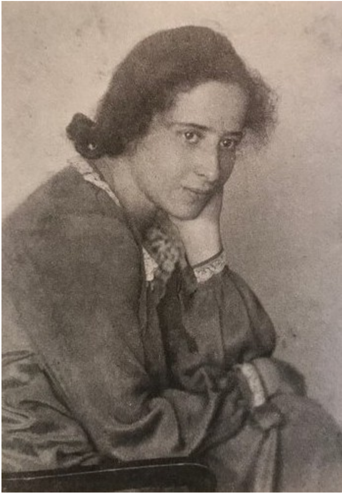
Hannah Arendt im Jahr 1924

Hannah Arendt lernte in ihrer Jugend Altgriechisch und Latein, sodass sie die Werke antiker Denker später ohne Schwierigkeiten im Original lesen konnte. Bereits mit 14 Jahren war sie eine für ihr Alter ungewöhnlich intellektuelle Person. Sie las nicht nur unterhaltsame Romane, sondern auch sehr schwer verständliche Werke wie Immanuel Kants „Kritik der reinen Vernunft“ und Karl Jaspers' „Psychologie der Weltanschauungen“. „Mit 14 Jahren hatte ich mich endgültig entschieden, mein Leben der Philosophie zu widmen“, erzählte sie in einem Interview, das Mitte der 1960er Jahre für das Fernsehen aufgezeichnet wurde. Tiefer in die Philosophie „eintauchte“ Hannah Arendt im Jahr 1924, als sie an der Universität Marburg studierte. 1928 setzte sie ihr Studium an der Universität Freiburg fort. Die Universität Heidelberg war die letzte „Alma Mater“ Arendts. Dort studierte sie bei Karl Jaspers, dessen Bücher sie seit ihrer Kindheit mit Begeisterung gelesen hatte. Hier promovierte sie 1930 in Philosophie.