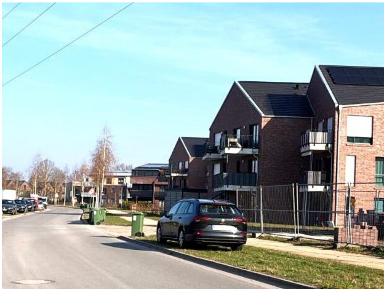
Hannah-Arendt-Straße, Oldenburg