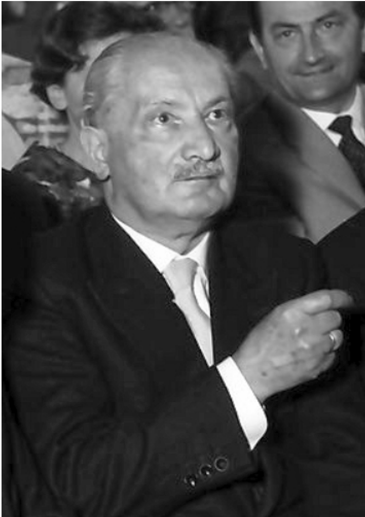
Professor Martin Heidegger, fotografiert im Jahr 1960