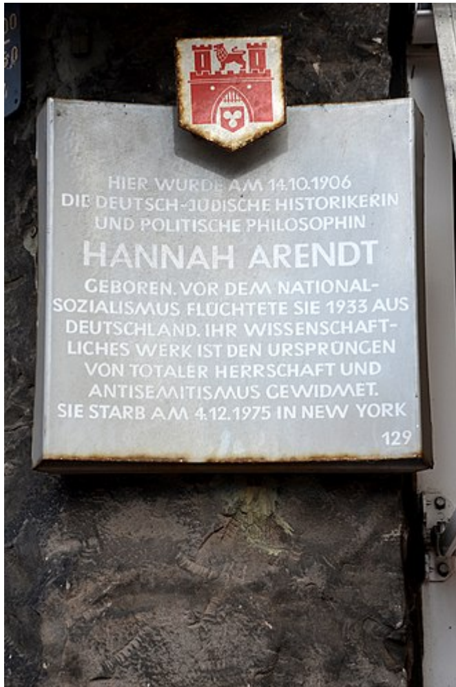
Eine Gedenktafel in Hannover (Linden) am Geburtshaus von Arendt

Die Deutsche Post hat zweimal Briefmarken mit Porträts von Hannah Arendt herausgegeben. Das erste Mal geschah dies 1988 in der „Standardausgabe Frauen der deutschen Geschichte“, das zweite Mal zum 100. Geburtstag der Philosophin im Jahr 2006.