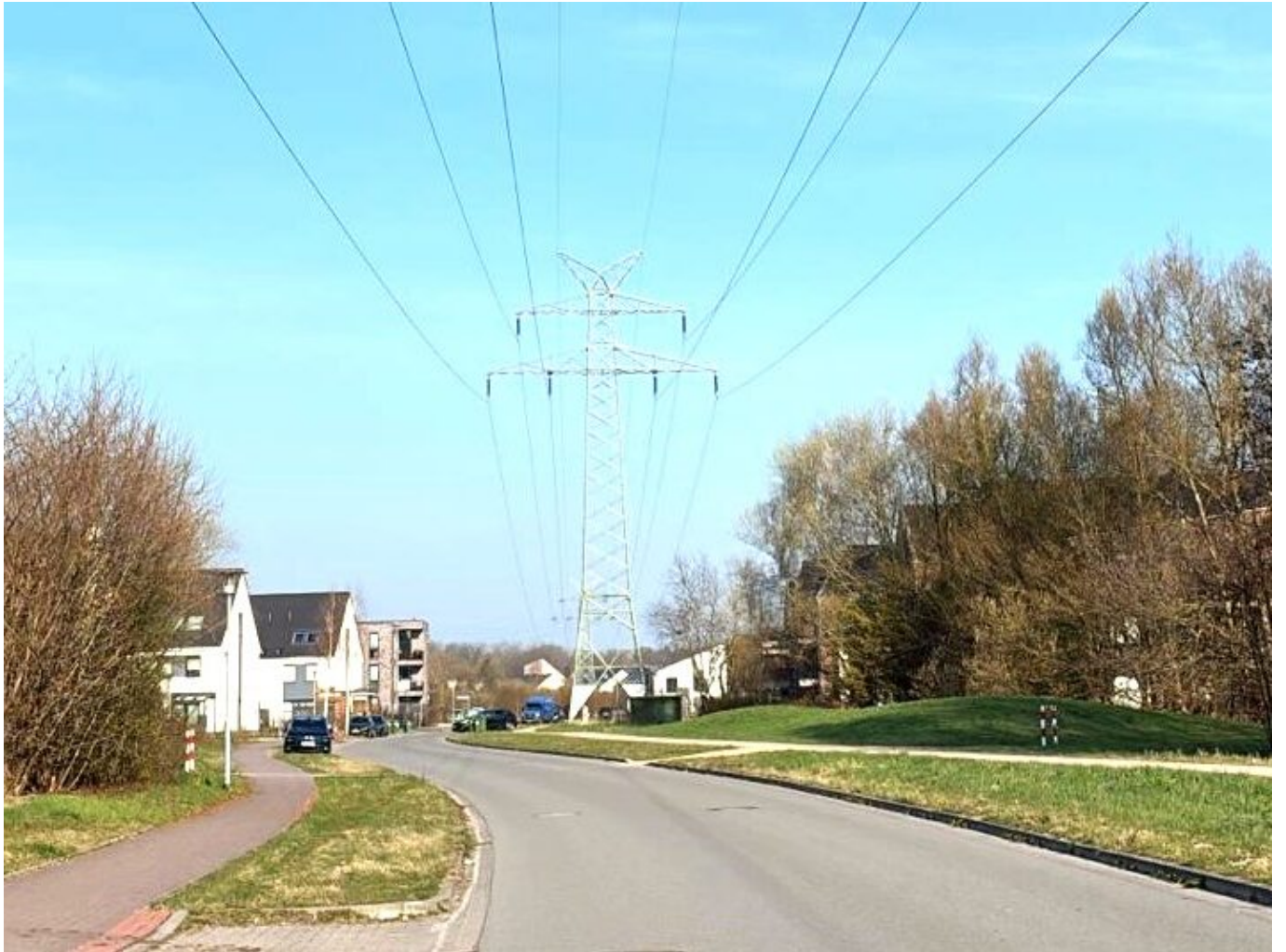
Hannah-Arendt-Straße, Oldenburg, © Foto: Elena Ljubarova