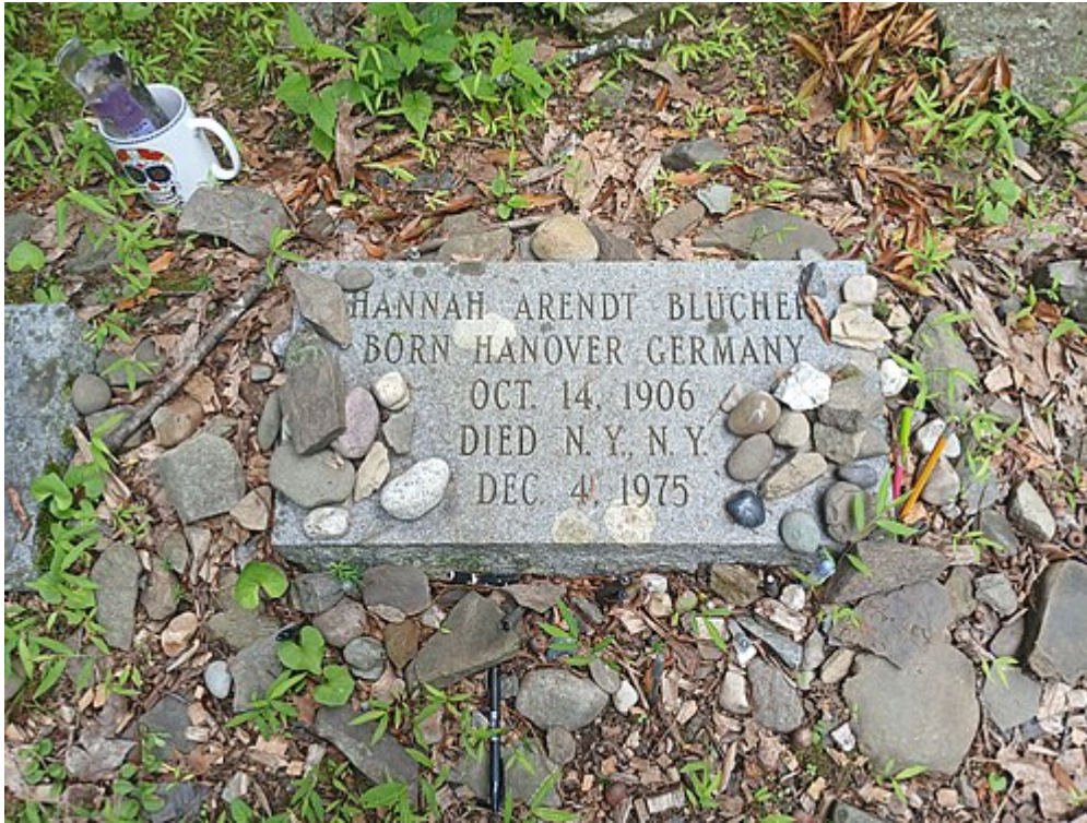
Hannah Arendts Grab in New York City, fotografiert im Jahr 2025.

Arendt hinterließ mehr als 450 Werke zu unterschiedlichsten Themenbereichen, die jedoch durch die Idee der Auseinandersetzung mit der Gegenwart verbunden sind. Zu ihnen gehören: „Das Leben des Geistes“, „Verantwortung und Urteil“, „Über die Revolution“, „Über Gewalt“, „Die Ursprünge des Totalitarismus“ und „Die Banalität des Bösen: Eichmann in Jerusalem“.