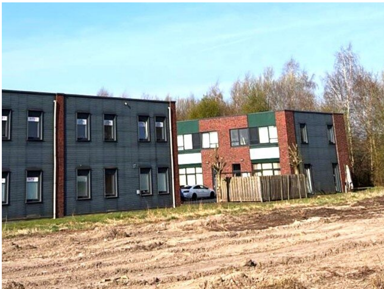
Die Bauarbeiten in der Hannah-Arendt-Straße gehen weiter