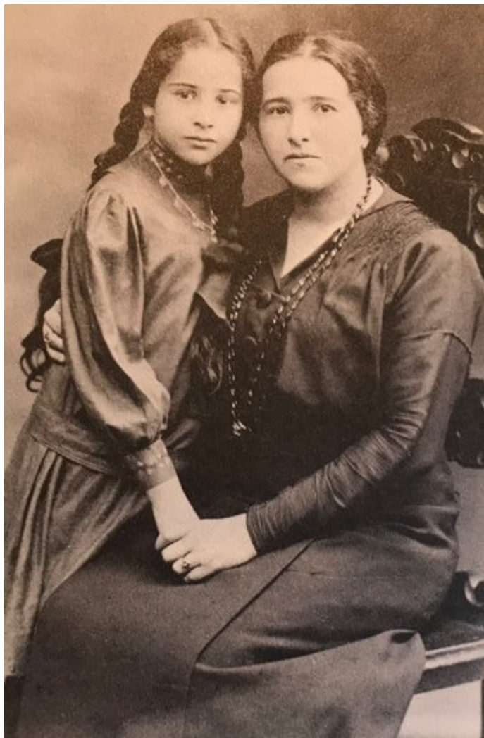
Hannah Arendt mit ihrer Mutter, 1914, Königsberg