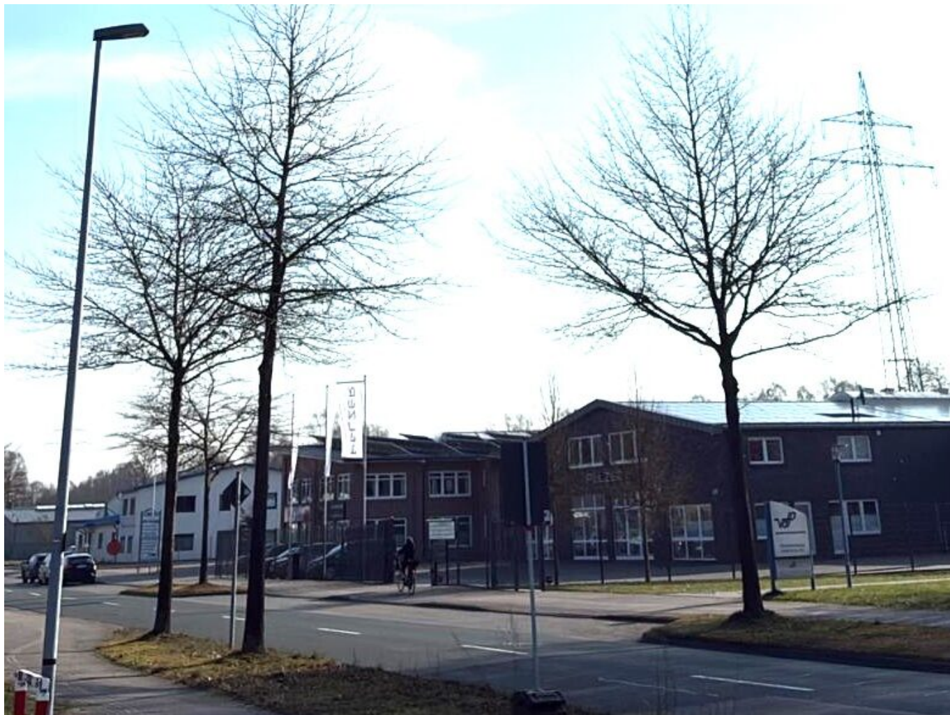
Hannah-Arendt-Straße, Oldenburg, © Foto: Elena Ljubarova