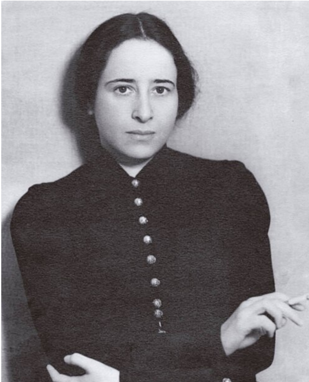
Hannah Arendt im Jahr 1933