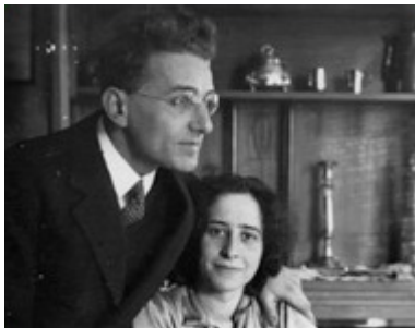
Hannah Arendt mit ihrem Ehemann Günther Stern, 1929

Hannah Arendt studierte in Marburg bei Martin Heidegger, der zu den bedeutendsten Philosophen des 20. Jahrhunderts zählt. Sie besuchte seine Vorlesungen über die Lehren antiker griechischer Philosophen und nahm an seinen Seminaren teil. Heidegger sah in seiner jungen Schülerin nicht nur eine gute Studentin, sondern auch eine echte Schönheit. Er war damals 35 Jahre alt, sie gerade einmal 17, als zwischen ihnen eine Liebesbeziehung entstand. So begann im Jahr 1924 ihre „Marburger Romanze“. Hannah mietete ein Zimmer in einem Haus in der Nähe der Universität, in dem sie sich heimlich mit ihrem Lehrer traf. Im selben Jahr begann auch der Briefwechsel zwischen der Studentin und dem Professor, in dem sie nicht nur über Liebe, sondern auch über Philosophie, Politik und vieles andere sprachen. Dieser Briefwechsel wurde veröffentlicht und ist auch aus wissenschaftlicher Sicht von großem Interesse. Dennoch erlosch die Romanze bereits Ende 1924 und Hannah sah sich gezwungen, sich von ihrem Geliebten zu trennen. Martin war verheiratet und hatte zwei Kinder. Außerdem wollte er seine Karriere nicht ruinieren. Dennoch blieben sie befreundet.