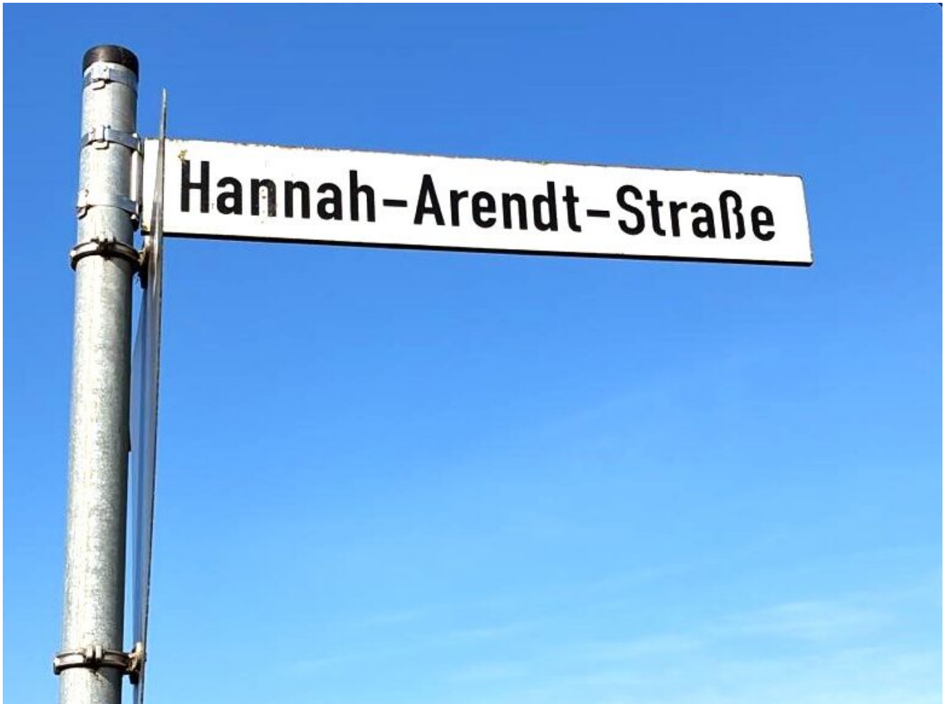
Straßenschild mit dem Namen Hannah Arendt, Oldenburg, © Foto: Elena Ljubarova

hat die in der Stadt bekannte Wohnungsbaugesellschaft GSG Mehrfamilienhäuser errichtet und es wurden Einfamilienhäuser nach individuellen Entwürfen gebaut. Da an die Straße weitläufige unbebaute Flächen grenzen, ist in naher Zukunft mit der Entstehung eines schönen architektonischen Ensembles zu rechnen.