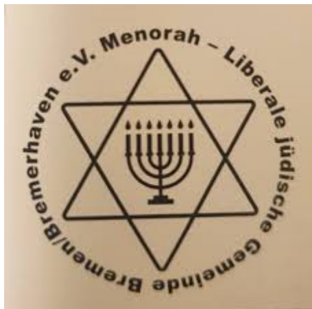
Логотип Либеральной еврейской общины Бремена/Бремерхафена

На берегу реки Везер, недалеко от места ее впадения в Северное море, уютно расположился город Бремерхафен. Это не только важный морской порт Германии для контейнерных перевозок, но и крупный промышленный центр автомобилестроения. Бремерхафен известен своей морской историей и является гостеприимным „домом“ для нескольких замечательных музеев, достопримечательностей и исторических мест, связанных с мореплаванием и судоходством. Это и интереснейший Немецкий эмиграционный центр, музей, рассказывающий об истории эмиграции миллионов людей, в том числе и евреев, покинувших Европу и отправившихся в Новый Свет в поисках своего счастья. Это и Морской музей, посвященный истории судоходства и мореплавания. И уникальный интерактивный музей климата, в котором посетители могут ознакомиться с различными климатическими зонами со всего мира, и замечательный зоопарк, и красивейшие новостройки города, придавшие ему неповторимый облик.