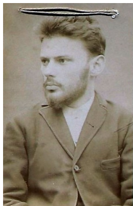
Мендель Шнеерсон, фотография из полицейского архива