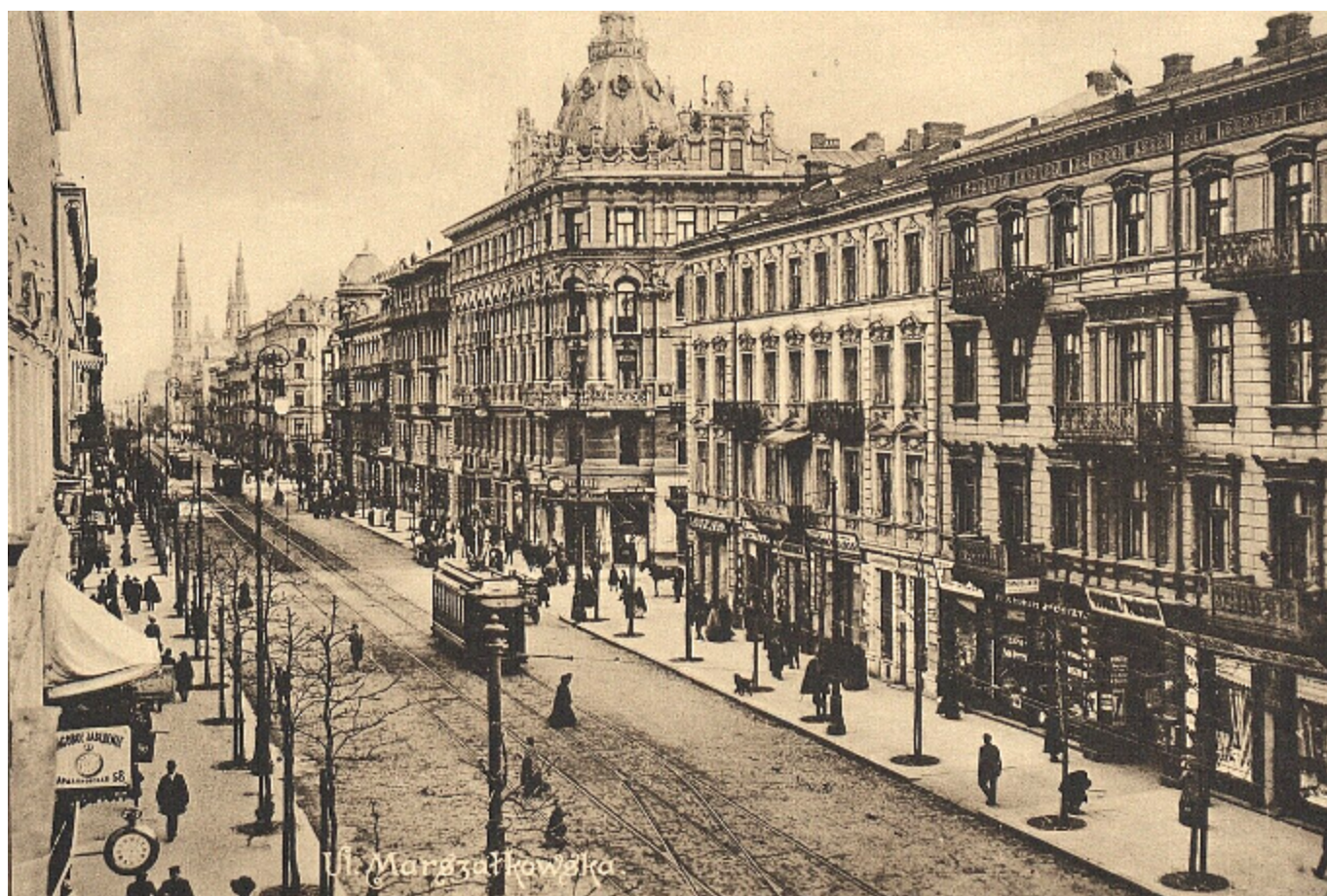
Варшава, с открытки конца XIX в.