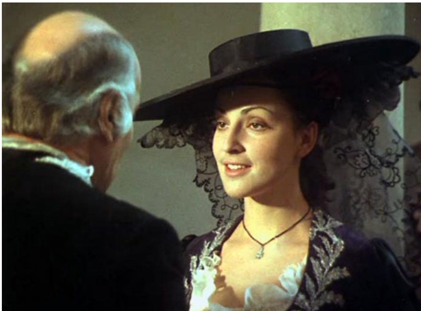
М.В.Ливанова в фильме «Дуэнья», 1978 г