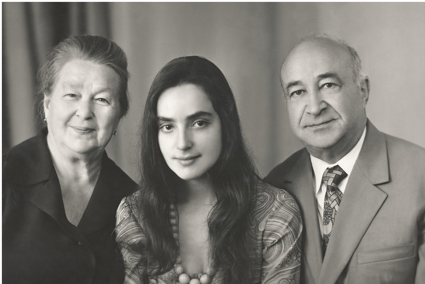
С бабушкой и дедушкой, г.Горький