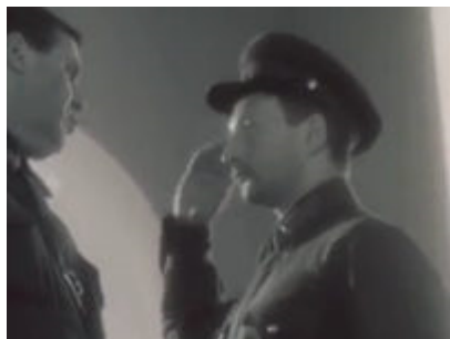
Александр Лобаков-Ливанов в фильме «Враг народа Бухарин», 1991 г.