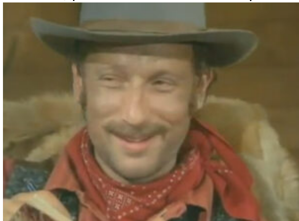
Александр Ливанов в сериале «Аляска Кид», 1993 г.