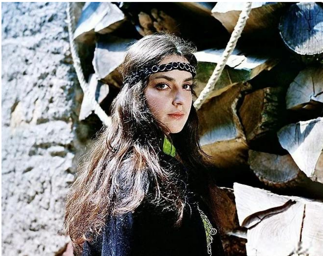
Марина Ливанова в фильме «Принцесса на горошине», 1976 г.