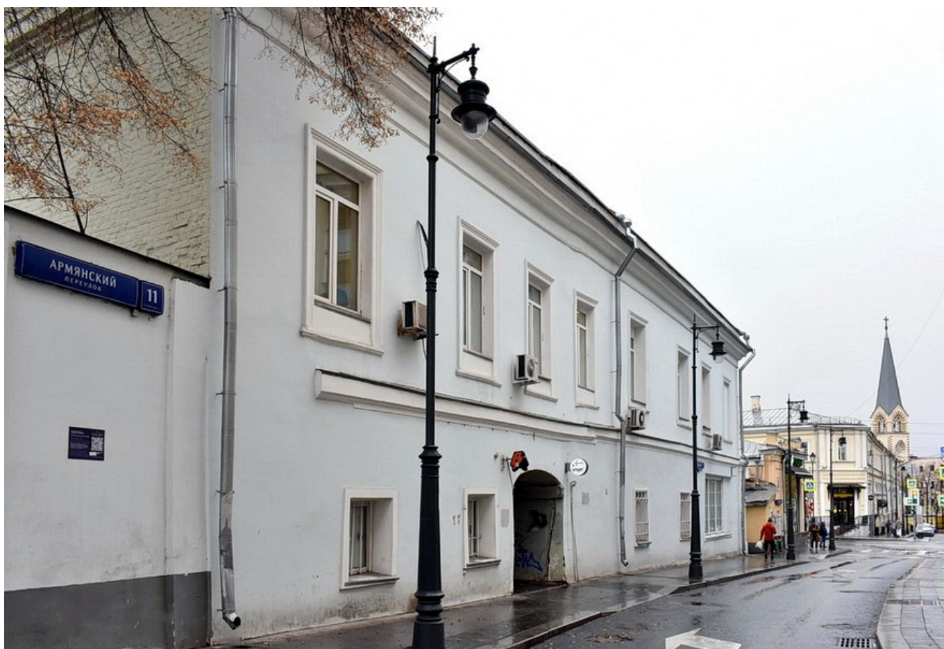
Доме №13 в Армянском переулке, Москва

24 октября 2021 г. в Москве, на доме №13, расположенном в Армянском переулке, в котором до своего ареста жил с семьёй профессиональный революционер, старый большевик Самуил Маркович Закс-Гладнев, был установлен памятный знак «Последний адрес».