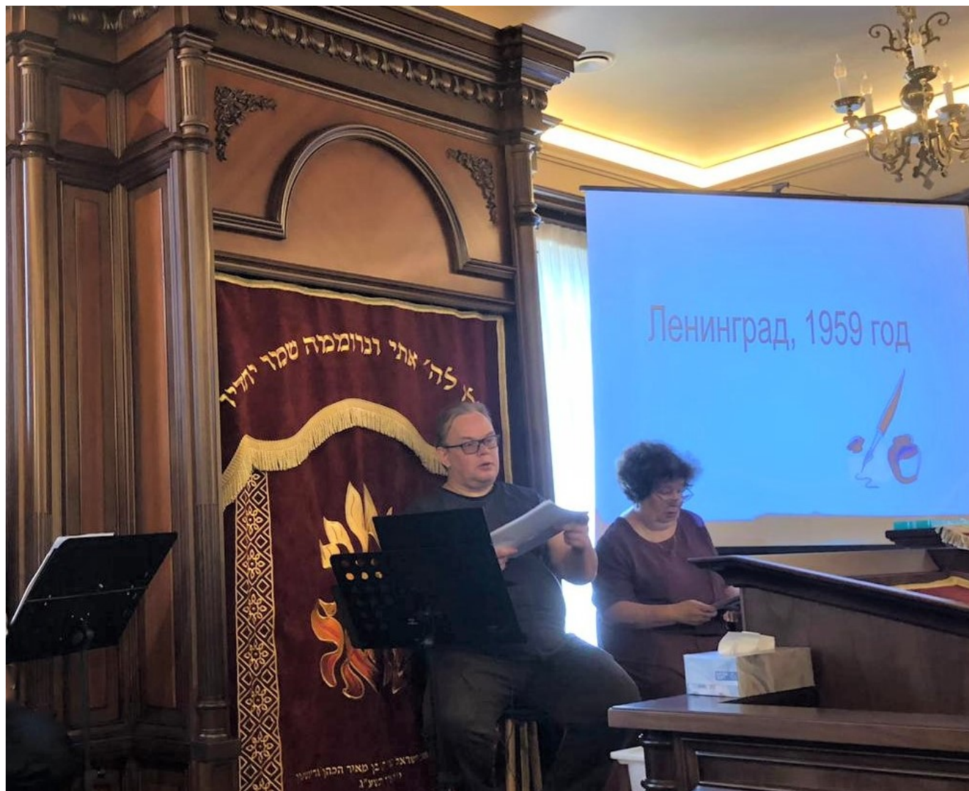
«Читакль» по пьесе «Плюс-минус сто лет», Юрмальская синагога, 2023 г.