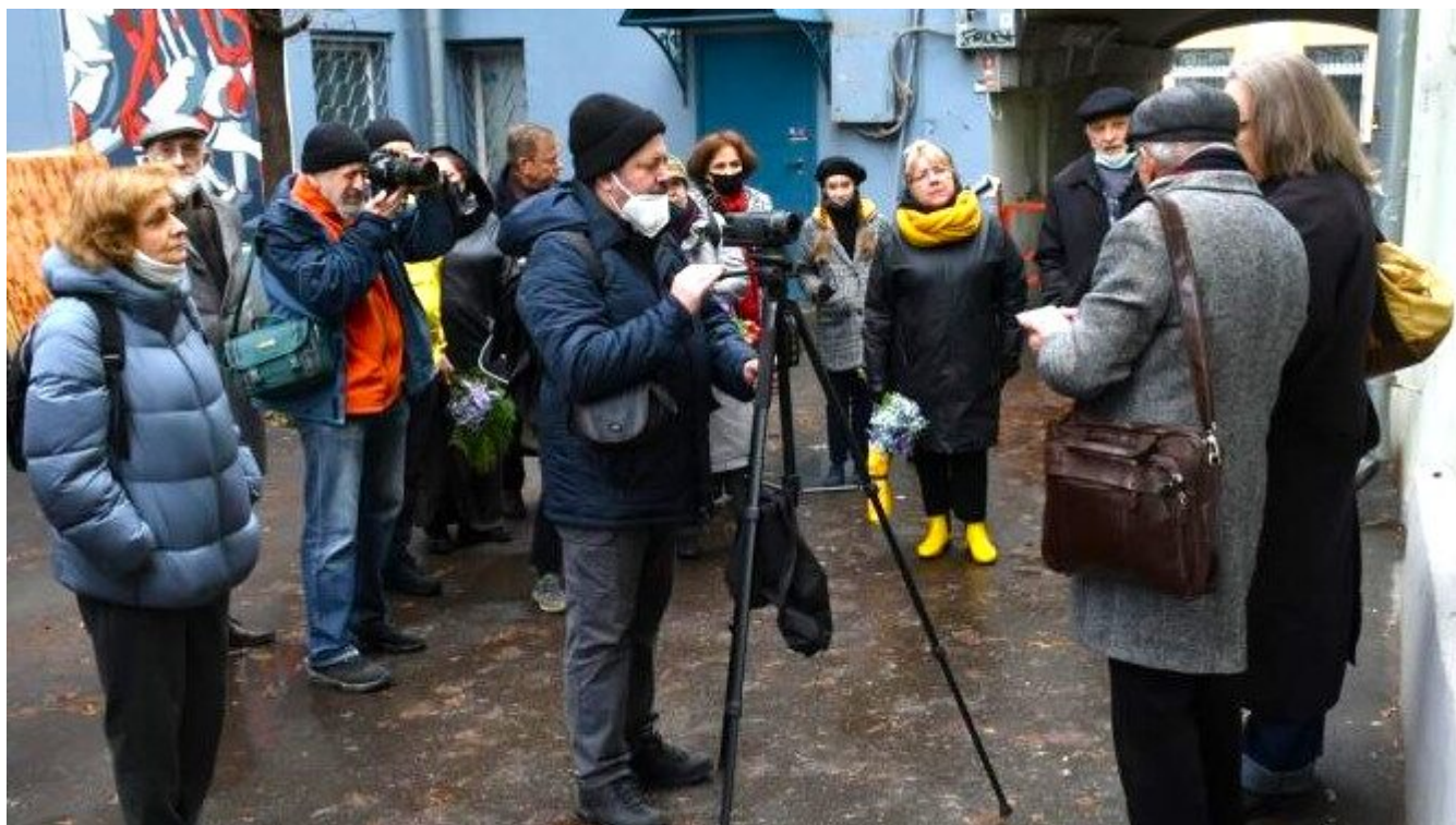
На церемонии установки таблички «Последний адрес» на стене здания в Армянском переулке