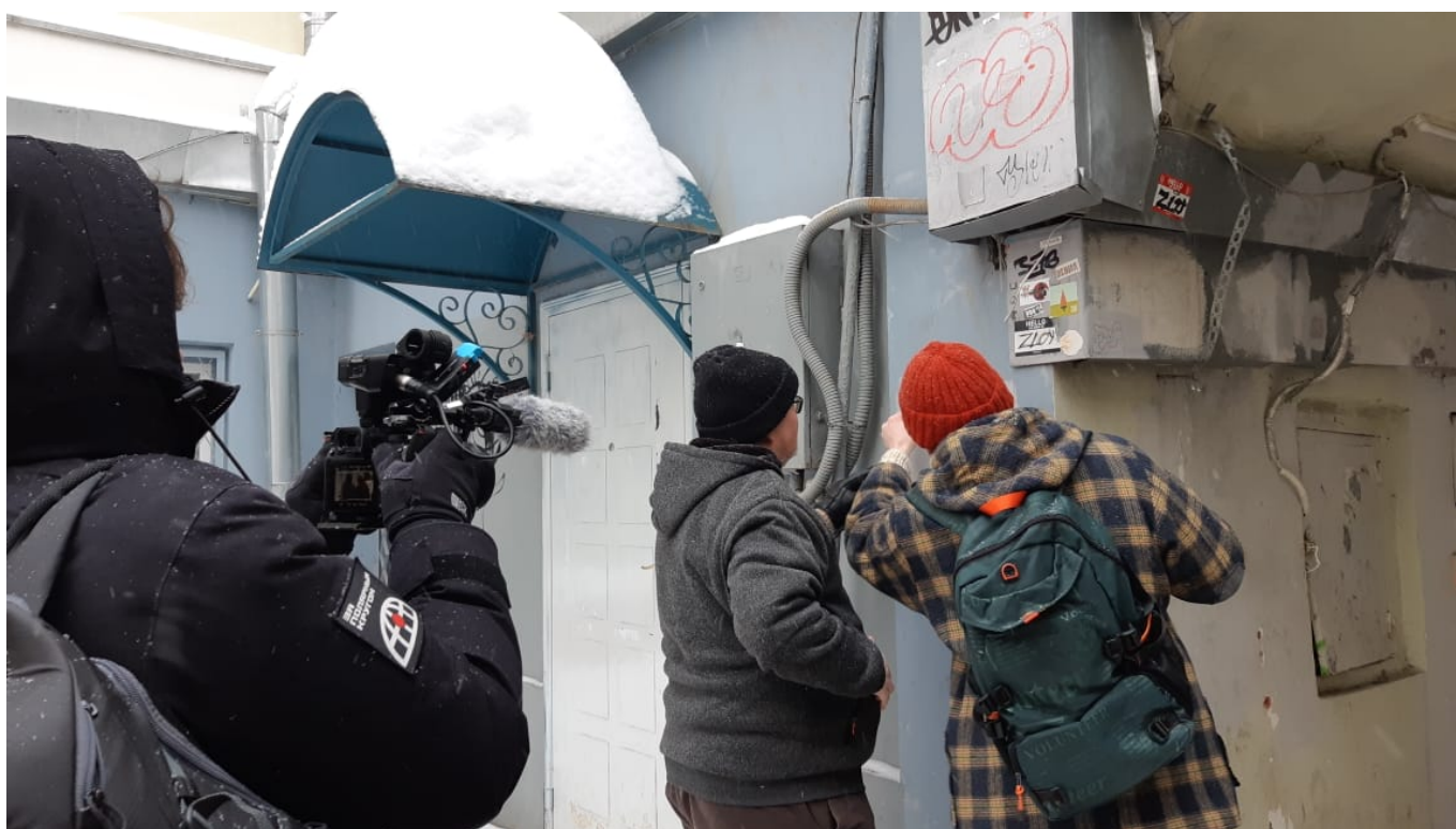
Повторная установка памятной таблички, Москва, 10.12.2023