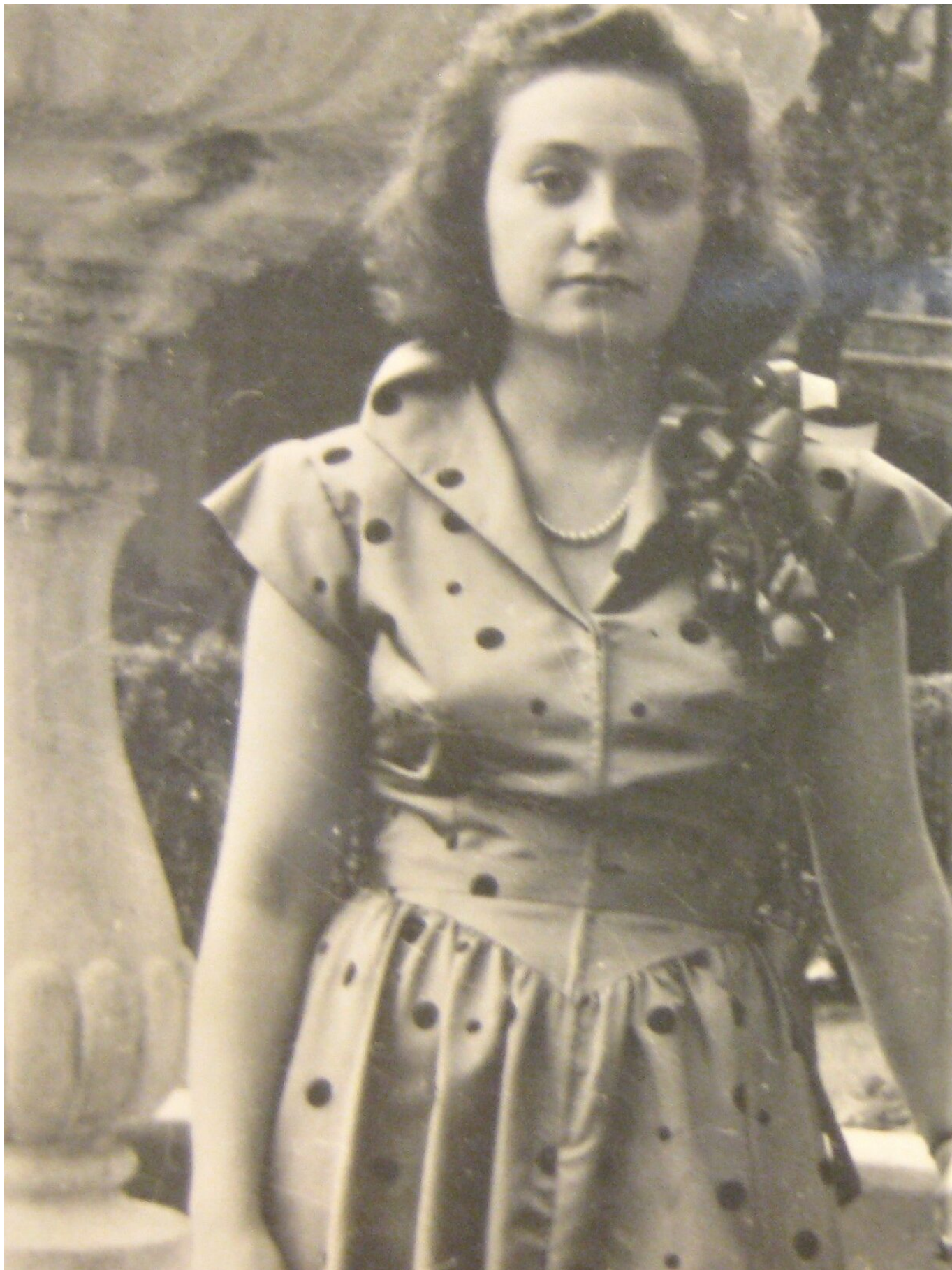
Нозми в молодые годы