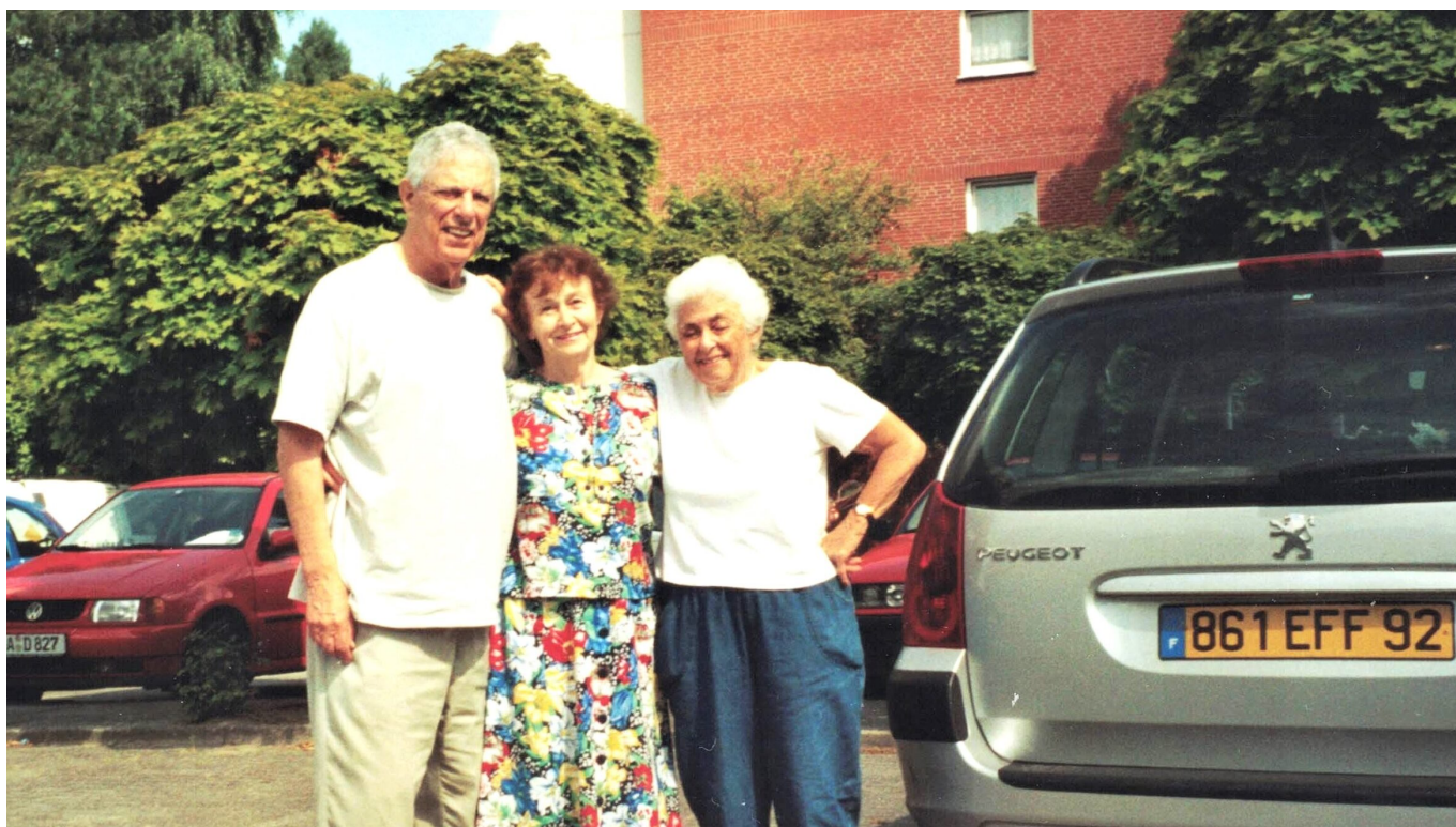
По дороге из Шяуляя во Францию, Ольденбург, 2005 г.