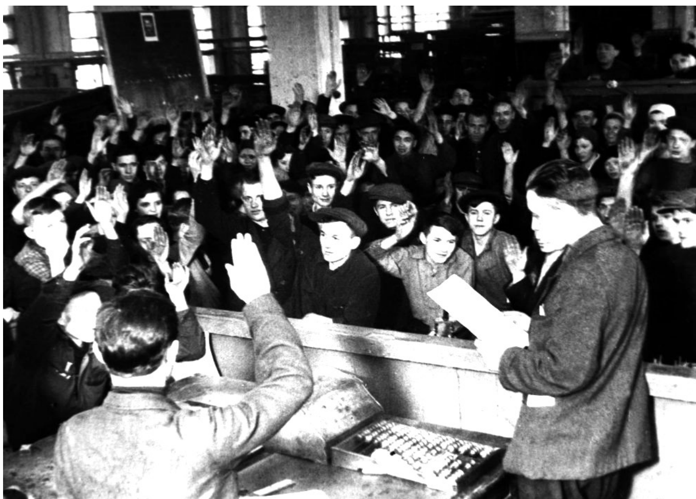
Митинг рабочих завода «Динамо», Москва, 1936 г