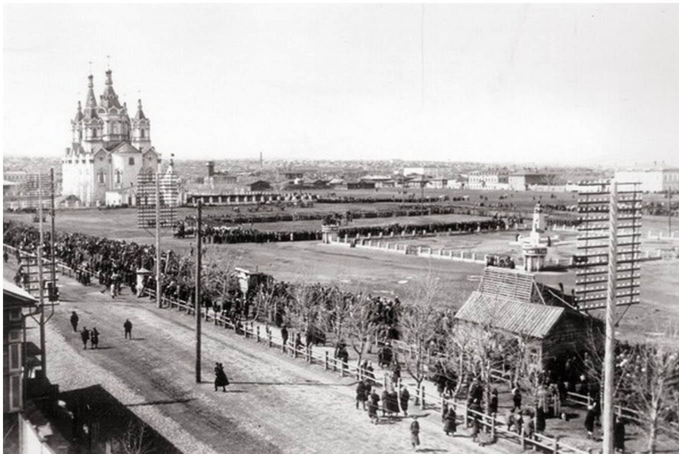
Красноярск, начало 1930-х гг.