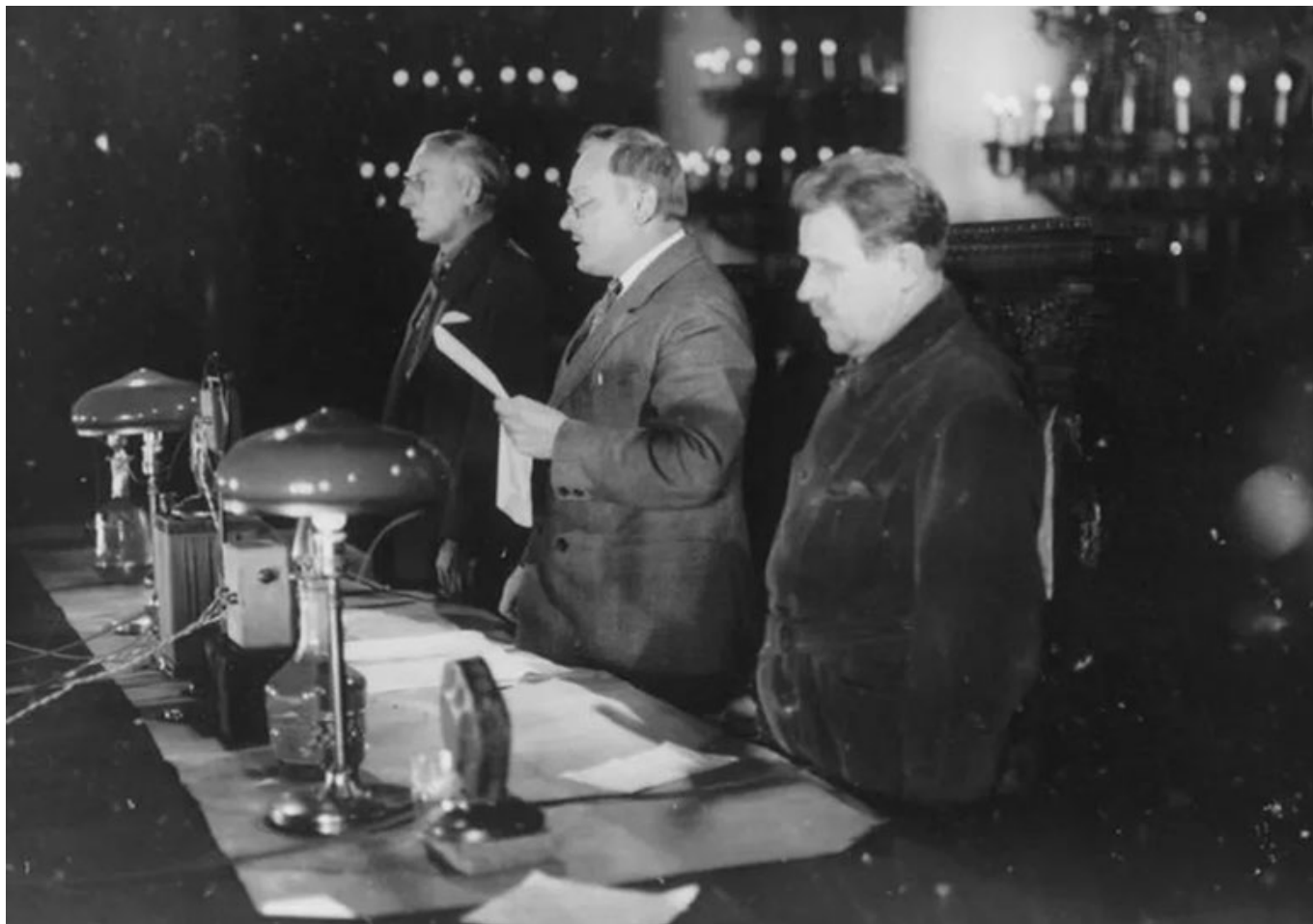
Прокурор СССР А.Вышинский (в центре), гособвинитель на Московских процессах

Приведу выдержку из письма Рафы отцу из архивного уголовного дела Рафаила Самуиловича Закса. На этом письме не указана дата, но, возможно, оно написано в конце 1934—начале 1935 г., вскоре после убийства Кирова и начала раскручивания серии арестов и судов над теми, кого НКВД арестовывало по подозрению в организации и соучастии в этом убийстве.