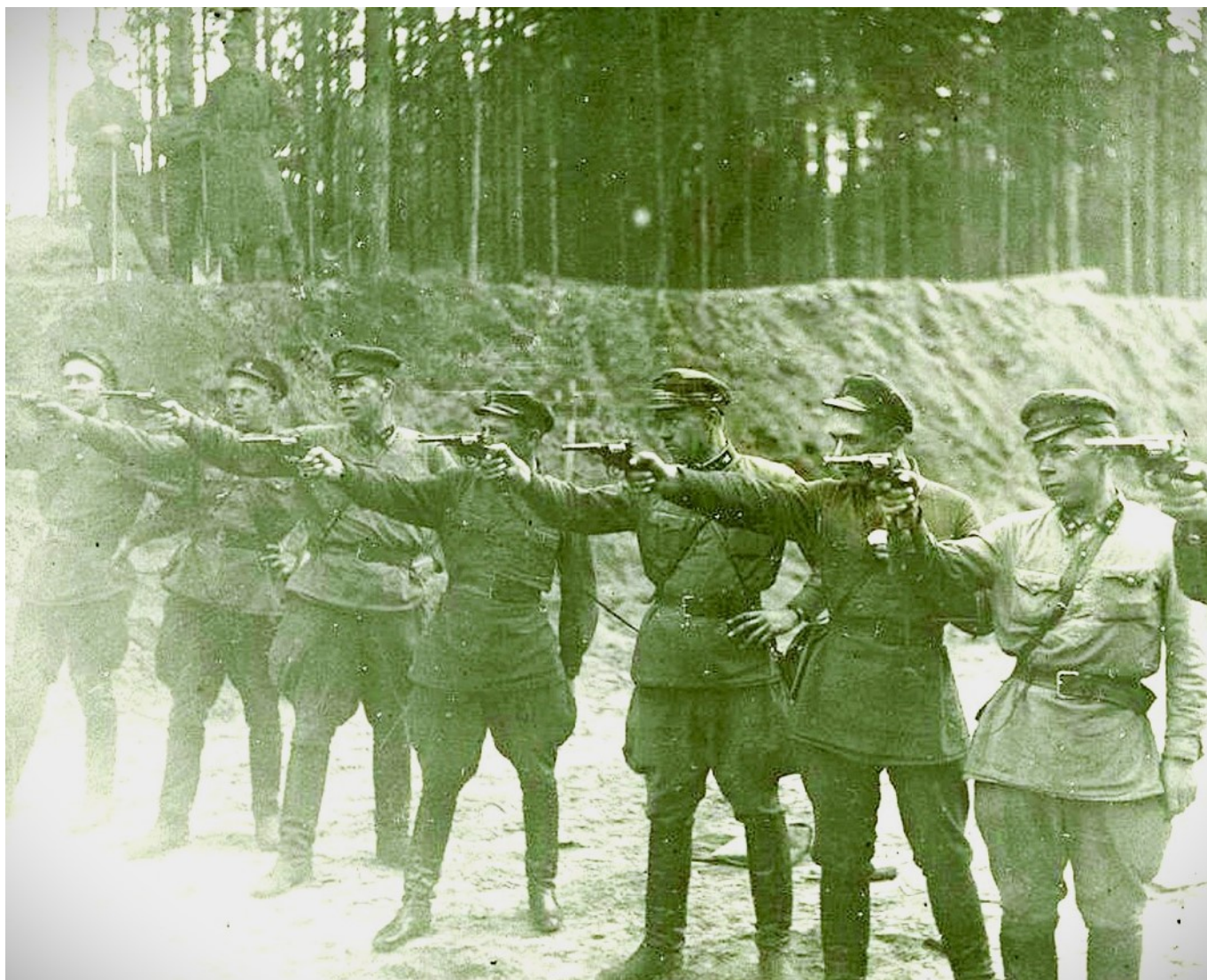
Расстрельная команда НКВД за «работой»