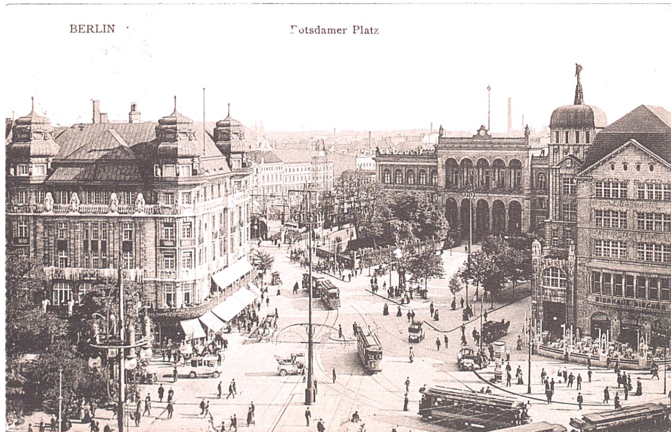
Берлин, начало XX в., старинная открытка