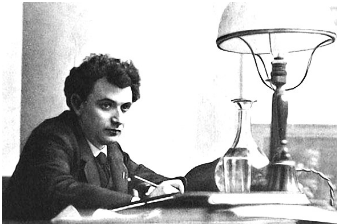
Григорий Зиновьев (1883-1936), председатель Ленсовета (по 1926 г.)