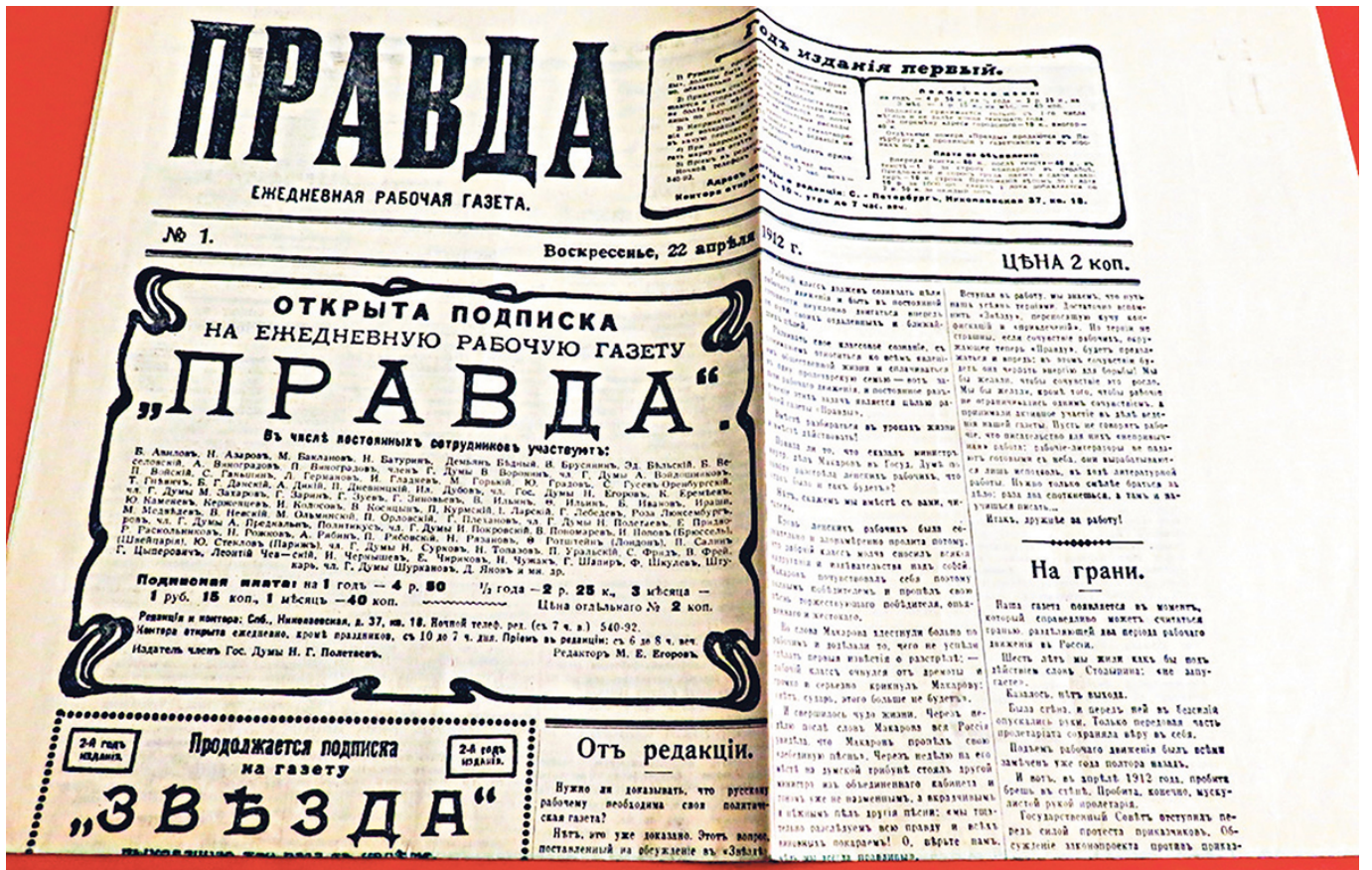
Первый номер большевистской газеты «Правда», апрель 1912 г.