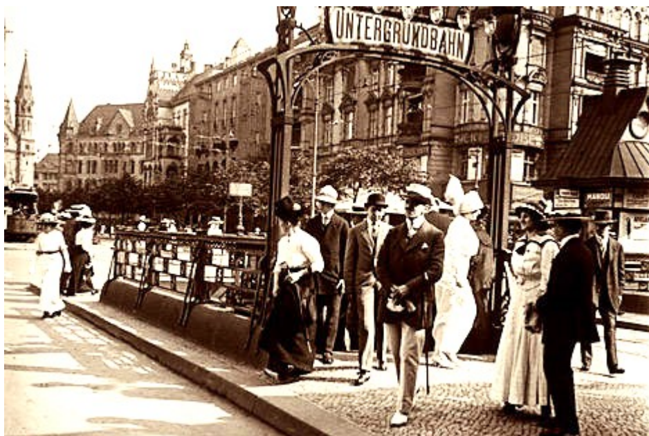
Шарлоттенбург, «русский» район Берлина, 1920-е гг.