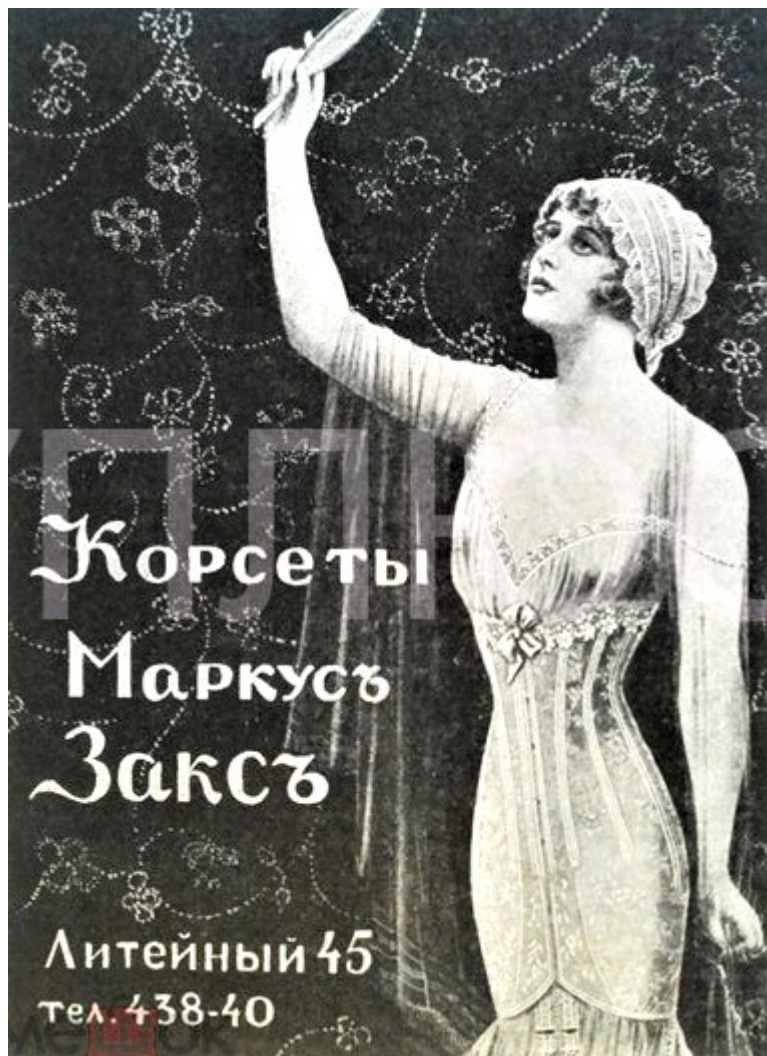
Рекламный плакат фирмы Закса, Петербург, начало XX в.

Самуил Маркович Закс-Гладнев родился 24 августа 1884 г. в Санкт-Петербурге в семье богатого купца и фабриканта Маркуса Закса, который владел бандажной фабрикой и магазинами корсетов, граций, бандажных изделий и другого специального белья. Благодаря ему в России появились женские «грудодержатели» (бюстгальтеры) по парижским образцам. Муля и его сестра Ципора рано остались без матери Рахили Закс: она умерла вскоре после рождения дочери. Для Маркуса это был страшный удар, от которого он так никогда и не оправился. После окончания Реформатского училища в Петербурге Самуил уехал в Германию, чтобы продолжить там своё образование. В автобиографии он указывал, что немецким языком владеет так же свободно, как и русским.