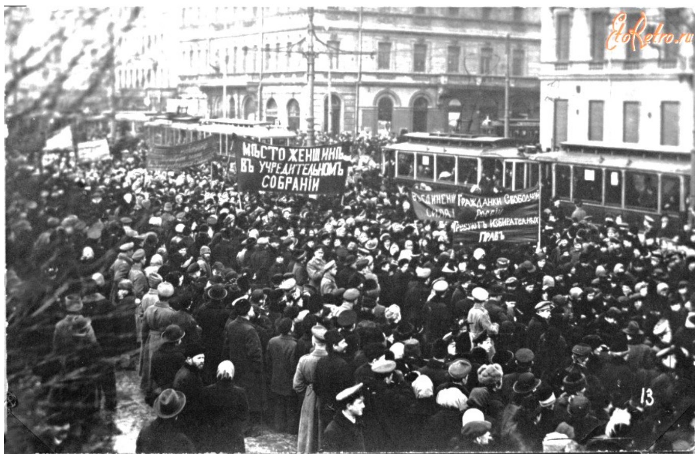
Митинг на Невском проспекте после Февральской революции, 1917 г.