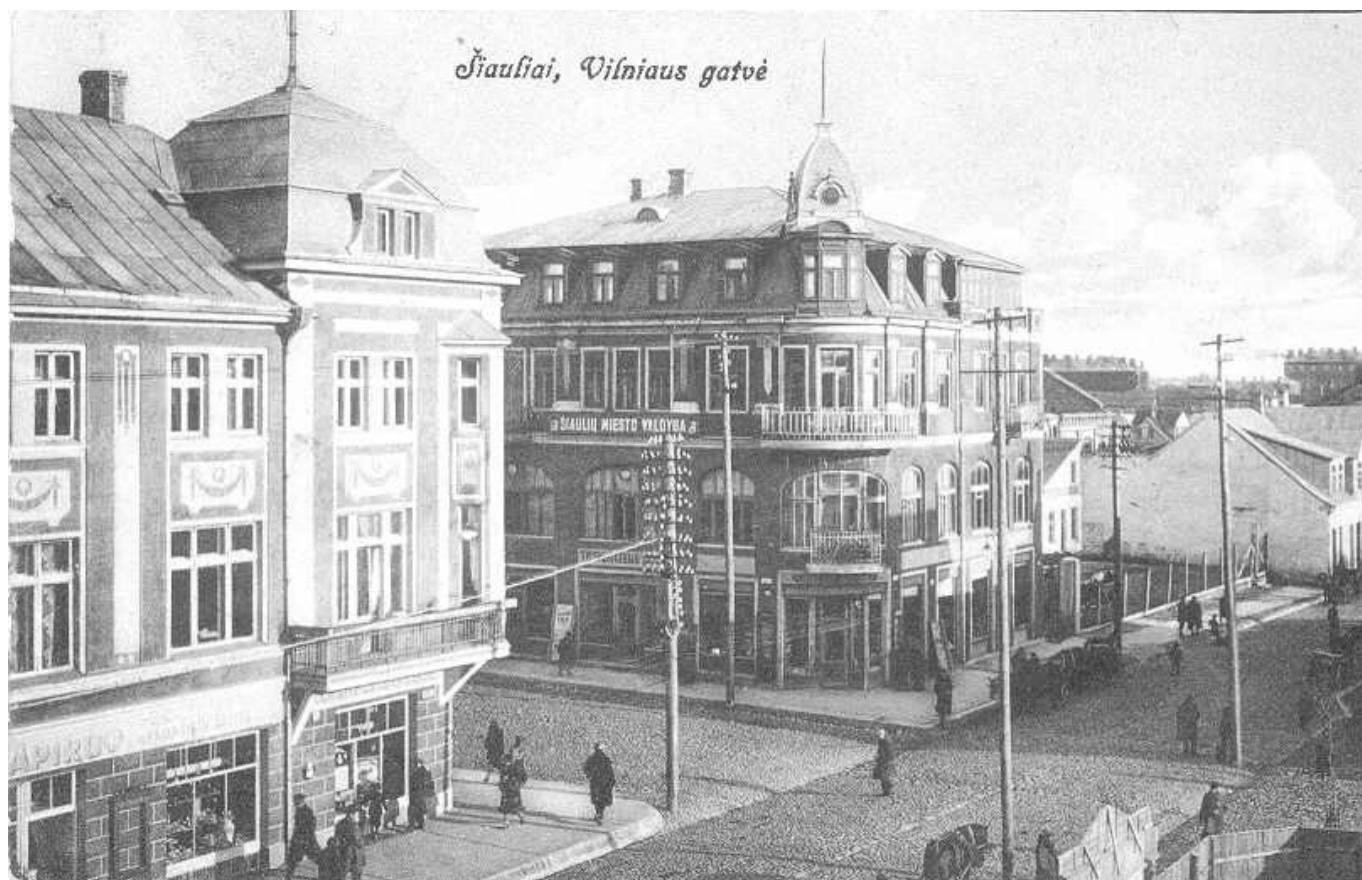
Шяуляй, Вильнюс гатве, старинная открытка

независимой Литвы. В городе работали крупные предприятия по производству кож, обуви, льняных тканей, кондитерских изделий. В Шяуляе открываются музеи, издательства, драматический театр, филиал клайпедского торгового института и др. культурно-образовательные организации. Перед Второй мировой войной население города достигает 32 тыс. жителей.