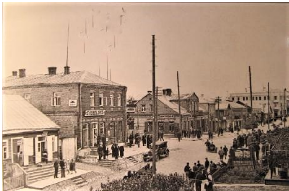
Шяуляй, Вильнюс гатве, 1930 г.