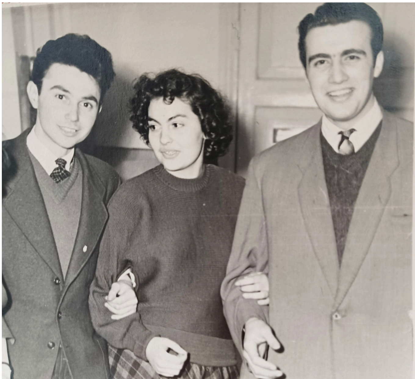
С друзьями молодости