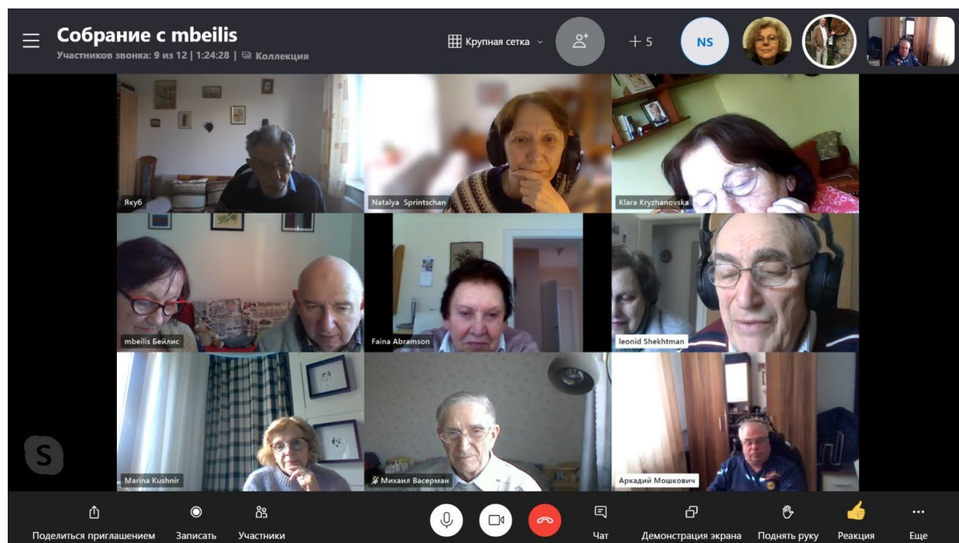
Online-заседание клуба сеньоров Еврейской общины