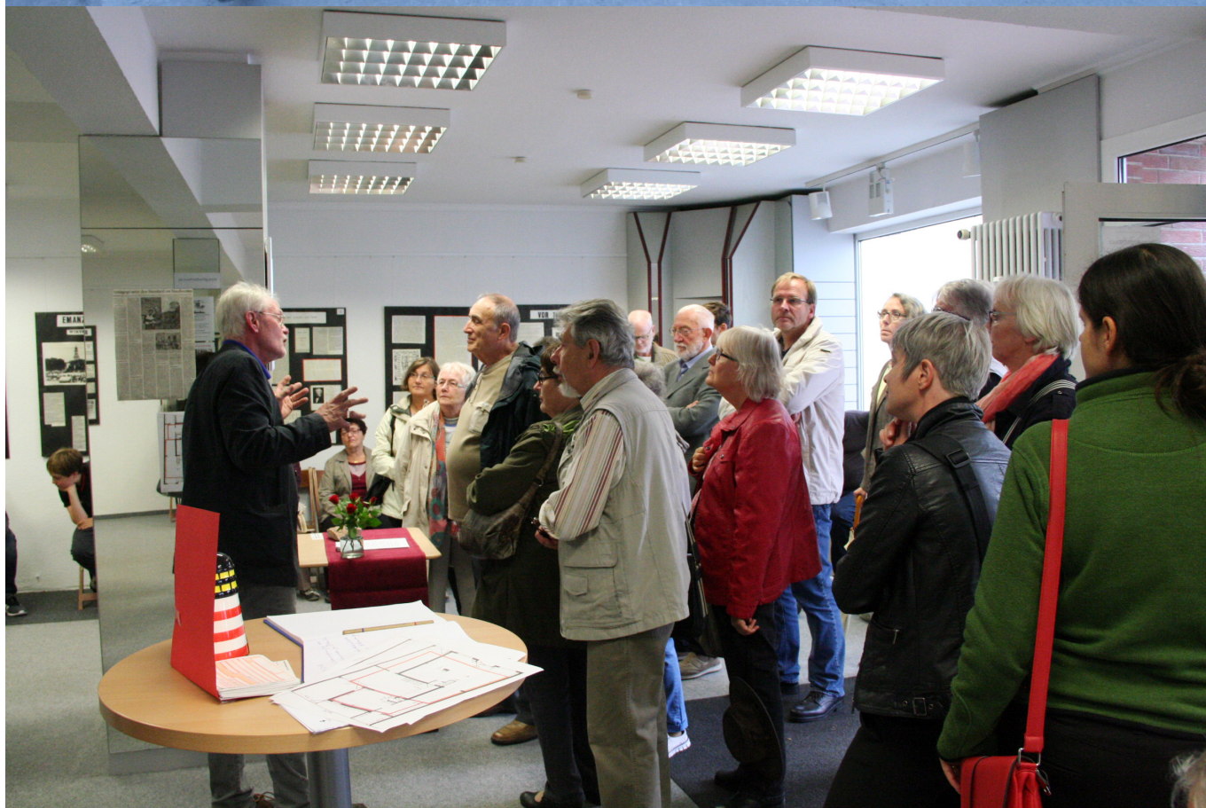
Выездные „заседания“ Клуба сеньоров