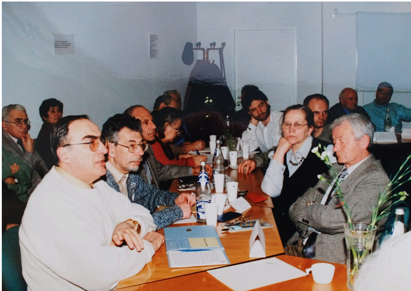
Организационное собрание Общества еврейских изобретателей IWIS, Берлин, 1999 г.

дней он активно включился в жизнь Еврейской общины Ольденбурга. Почти 20 лет, пока были силы, работал волонтером на Старом еврейском кладбище в Ольденбурге, поддерживая там совместно с коллегами чистоту и порядок, в частности, они содержали в хорошем состоянии братскую могилу захороненных там пленных красноармейцев. С 1999 по 2003 гг. был членом Клуба изобретателей Weser-Ems.