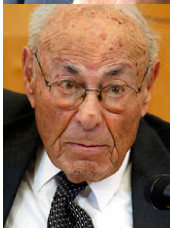
Раввин Лео Трепп в разные годы жизни