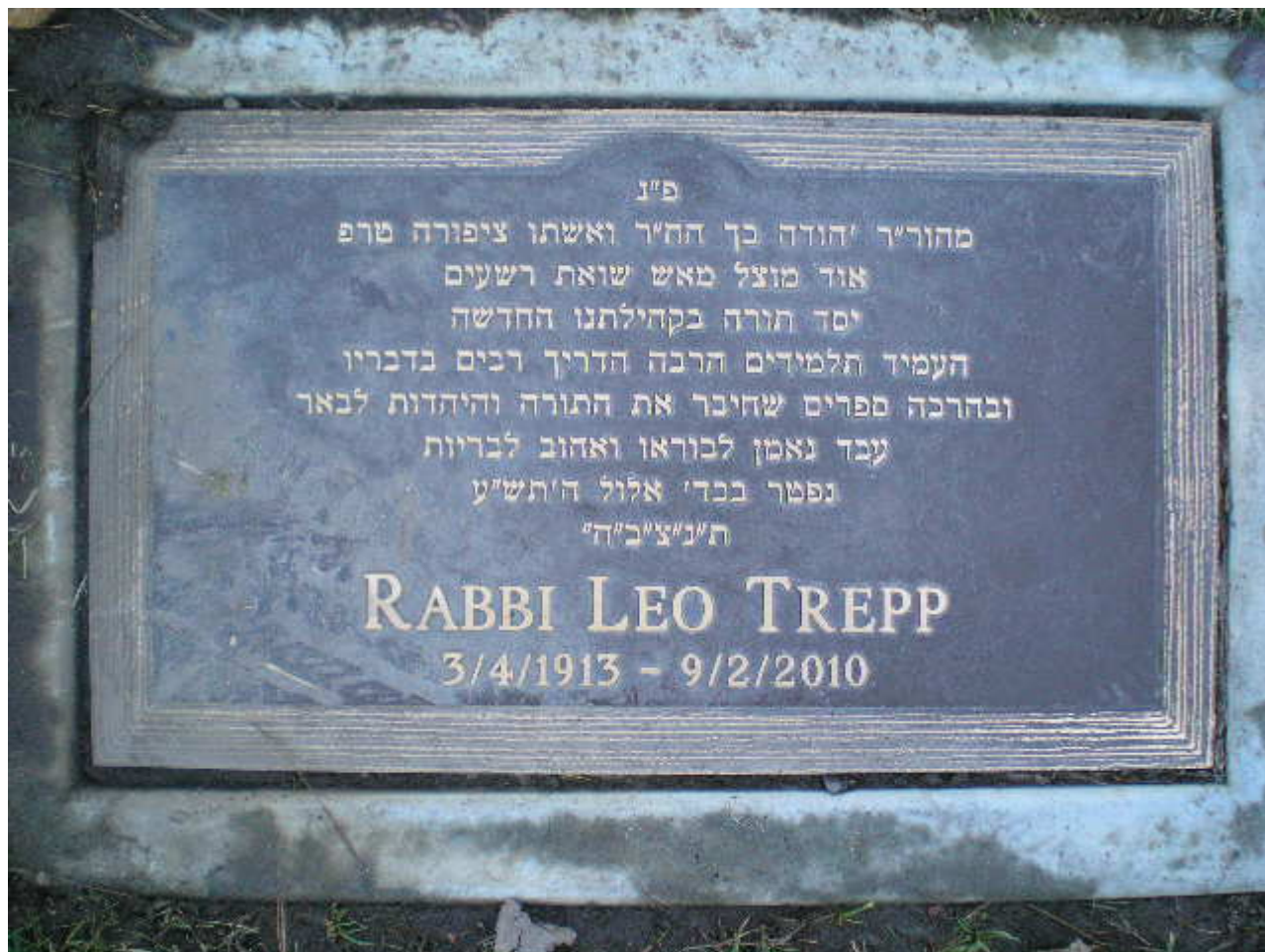
Памятная доска в честь раввина Лео Трепп

К 100-летию со дня рождения раввина Лео Треппа 4 марта 2013 г. администрация города переименовала одну из улиц в честь этого человека, почётного гражданина Ольденбурга. Теперь южная часть Wilhelmstraße, на которой расположены синагога и общинный центр Еврейской общины, между улицами Marienstraße и Katharinenstraße, носит имя раввина Лео Треппа, значительная часть жизни и деятельности которого тесно связана с бывшей столицей Земли Ольденбург.