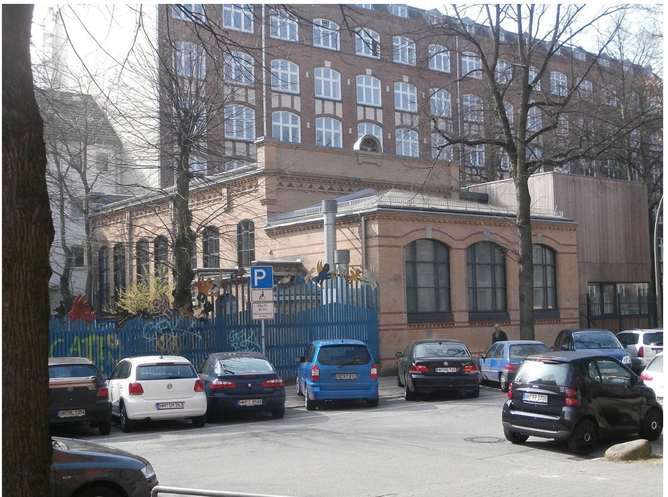
Улица Флоры Нойман, дом 1, где расположено ITVNH, Гамбург

Лишь только в 2004 г. произошло возрождение Либеральной общины Гамбурга, одной из главных задач которой было сохранение её архитектурного и культурного наследия. В частности, решался вопрос о том, чтобы в городе снова появилась либеральная синагога. С этой целью в 2021 г. община обратилась в Сенат Гамбурга с просьбой об утверждении основополагающего документа о культурном, финансовом и социальном равенстве либеральной и ортодоксальной еврейских общин Гамбурга. Позиционируя себя в качестве наследницы и продолжательницы дела исторической либеральной общины, на логотипе современной общины имеется надпись «Israelitischer Tempelverband zu Hamburg» (ITVNH) и две важные даты в её истории – 1817 и 2004. Сегодня в общине уже более 340 членов, и она является третьей по величине либеральной еврейской общиной в составе Союза прогрессивных евреев Германии.