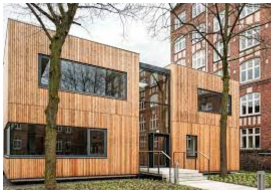
Израэлитское храмовое объединение Гамбурга

В настоящее время ITVНН размещается в выделенном ей помещении, являющимся пристройкой к зданию бывшей еврейской школы для девочек. Ранее община занимала только часть этой пристройки, но сейчас ей предоставили всё полностью. Во всех помещениях, где расположена община, выполнен ремонт, сооружена надёжная ограда, оборудованы полицейский пост и проходная. Видно, что здесь вопросы безопасности решаются в наши непростые времена не формально.