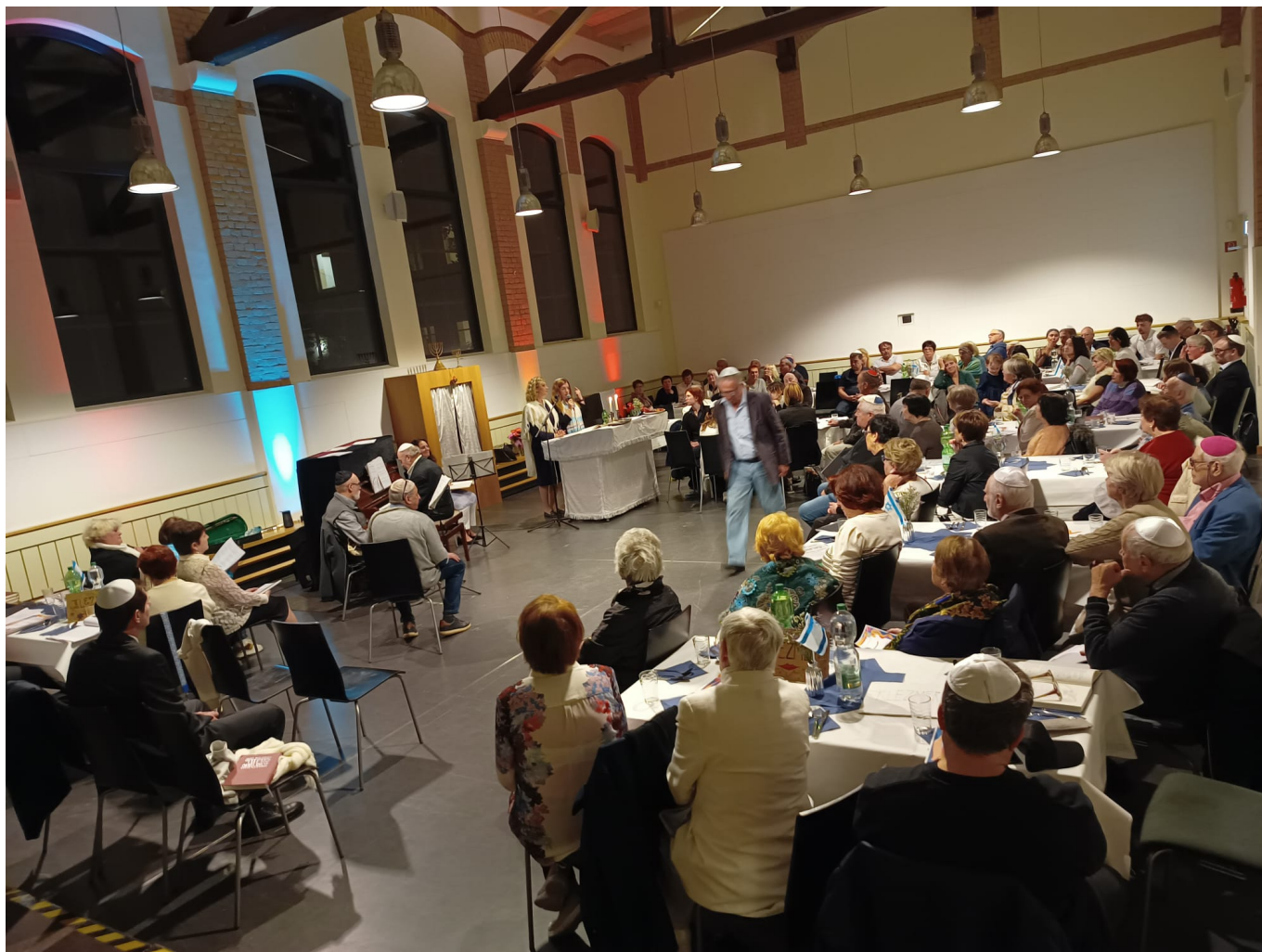
Эрев Рош-ха-Шана в ITVНН, 2.10.2024, Гамбург

общины и наших гостей из других еврейских общин Германии. У всех было приподнятое, праздничное настроение. Выступил хор, который исполнил песню к Рош ха-Шана. Вся атмосфера праздника была очень доброжелательной и необыкновенно теплой, «хозяева» были гостеприимны и радушны, а гости – открыты и дружелюбны. Это был уже третий раз, когда я проводила богослужение в этой общине, и вновь хочу отметить, что ее члены очень душевные, поддерживающие друг друга люди, а меня принимают просто замечательно. Я очень рада и благодарна за возможность быть частью этой прекрасной общины».