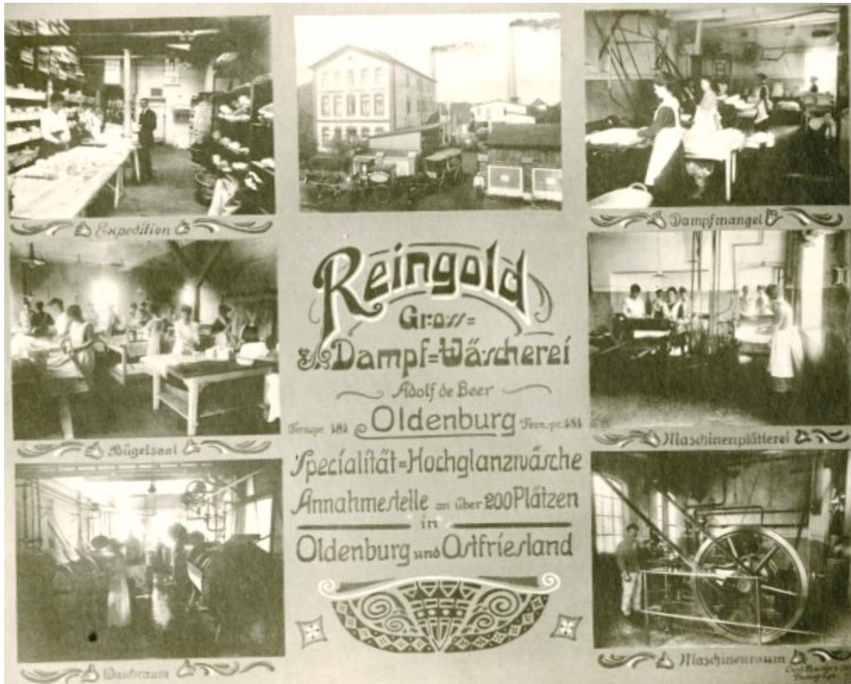
Рекламный проспект паровой прачечной „REINGOLD“