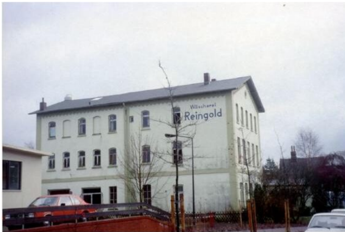
Hochheider Weg 3, здание прачечной „REINGOLD“, 1970-е годы