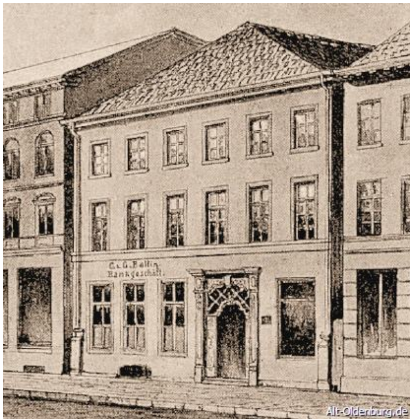
Банковский дом Баллин, Lange Straße 51 , 1890 г.

Любопытно, что в новой синагоге был установлен орган, который однако в 1891 г., после вступления в должность раввина д-ра Давида Маннхаймера, был удален.