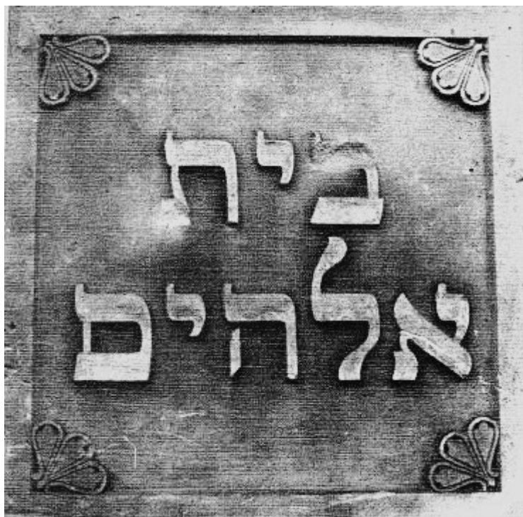
Памятный камень «Бет Элохим»