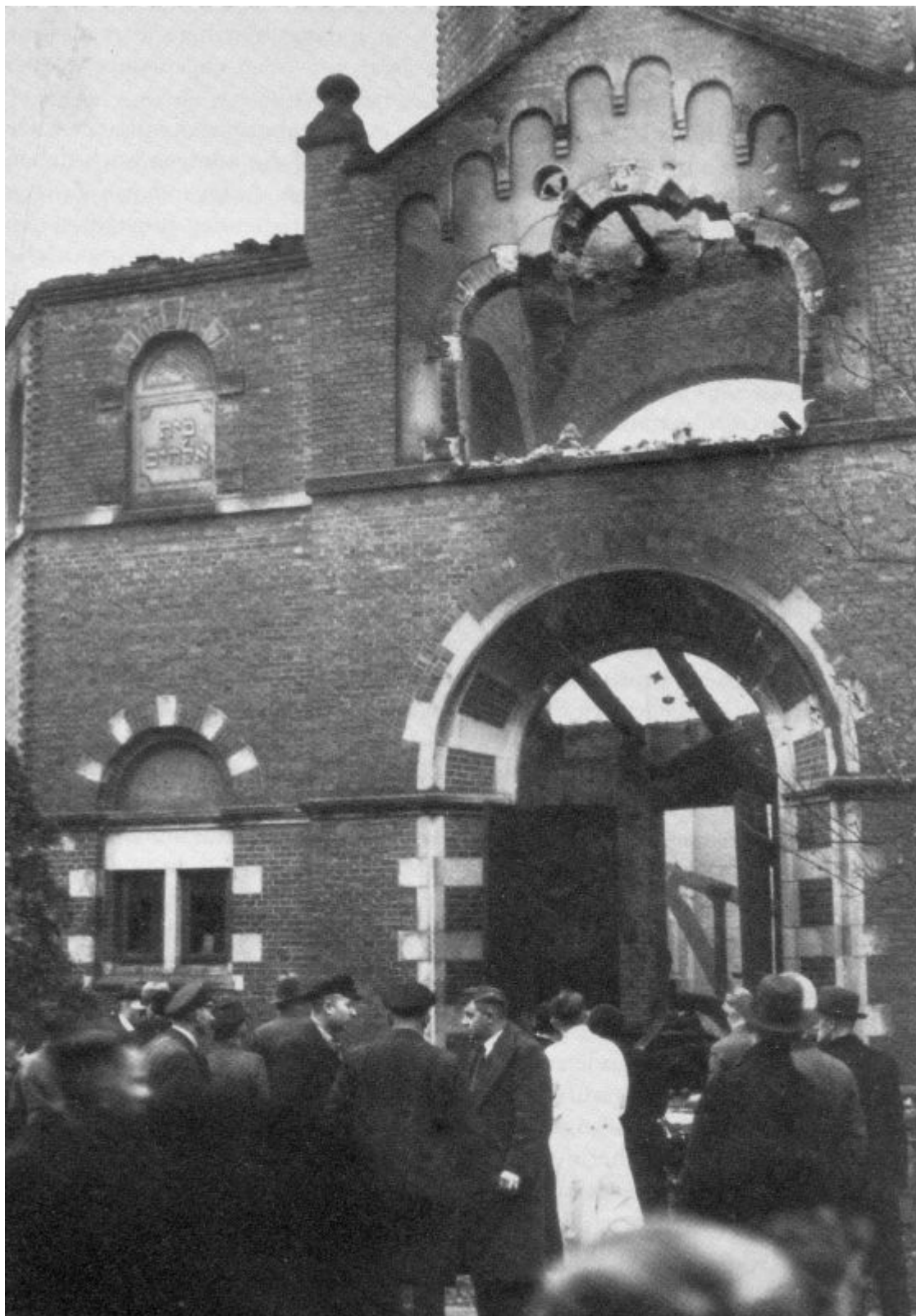
Здание разрушенной синагоги, Peterstraße 2, 1938 г.

Интересна история этой доски. Впервые она была установлена на здании синагоги на Peterstraße ещё в 1855 г. Когда эта синагога была перестроена, то памятная