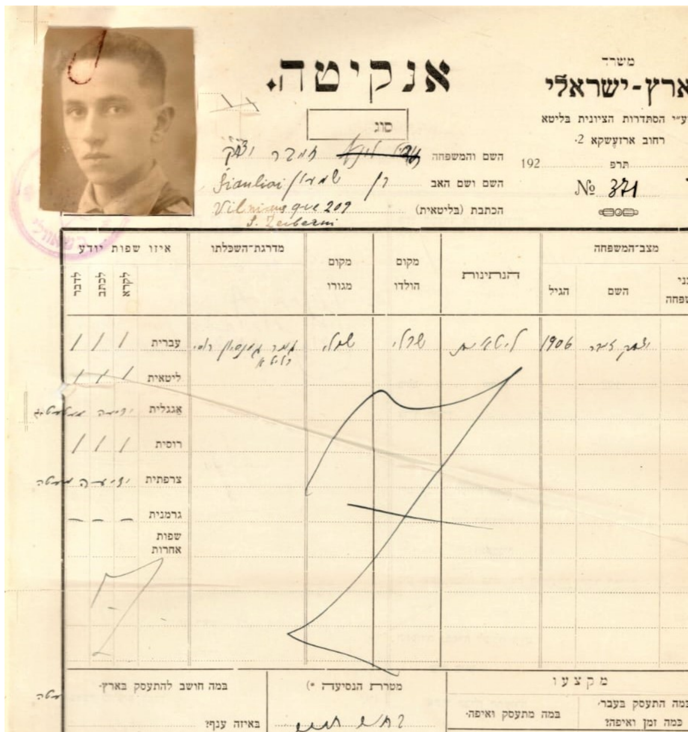
Анкета для поступления в ковненскую иешиву, фрагмент, 1923 г.

В 1923 г. он поехал в Ковно (Каунас), тогдашнюю временную столицу Литвы, и поступил в местную иешиву, высшее еврейское религиозное учебное заведение, предназначенное для изучения главным образом Талмуда.