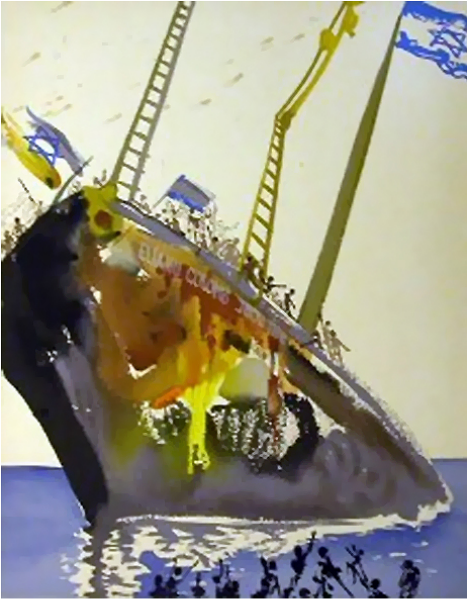
«К берегам свободы»