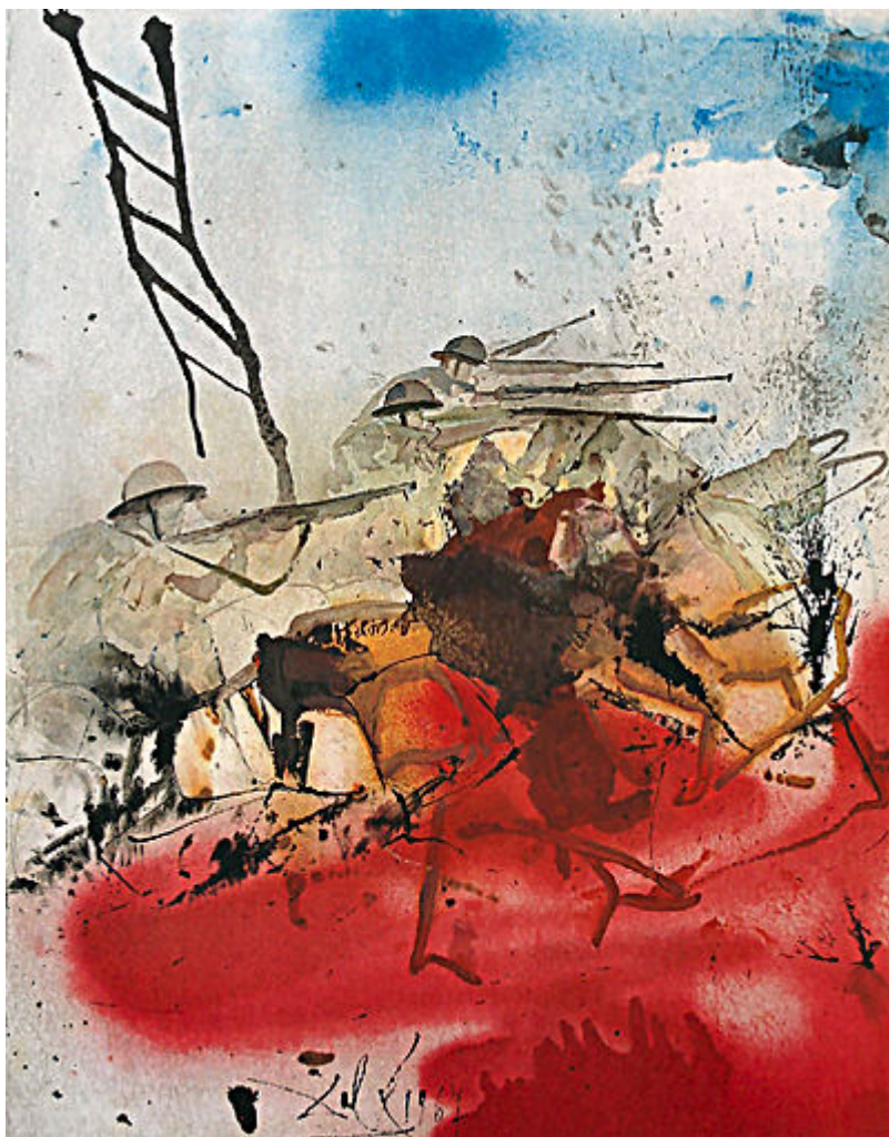
«Битва на Иерусалимском холме»

Серию открывает рисунок, давший ей название – «Алия». Это – юноша с откинутой курчавой головой, обнажённый торс которого обвит флагом Израиля. Среди работ этой серии – не оставляющие никого равнодушным сцены Холокоста. Одна из них – заключённые за колючей проволокой, полная драматизма и страданий. На другой литографии – нацистская свастика над погибшими евреями и сияющая в небе звезда Давида – как символ надежды. Часть работ этой серии посвящена теме алии, созданию государства Израиль и Войны за независимость. На одной из работ мастера – «К берегам свободы» – корабль под флагом со звездой Давида, прибывающий на Землю обетованную. Обращает на себя внимание то, что художник изобразил на берегу группу людей, которые машут руками, приветствуя корабль. Дали, вероятно, полагал, что тогда всех репатриантов встречали с распростёртыми объятиями. На другой литографии изображён исторический момент: Давид Бен-Гурион зачитывает Декларацию независимости 5 мая 1948 г. Справа от Бен-Гуриона – Моше Хаим Шапиро, первый министр здравоохранения, иммиграции и внутренних дел; слева – раввин Иегуда Маймон, глава религиозной партии сионистов. Один из драматических моментов Войны за независимость – битве на Иерусалимском холме – посвящена ещё одна работа Дали.