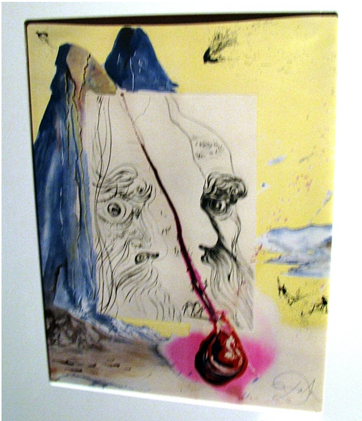
«Моисей со скрижалями Завета»