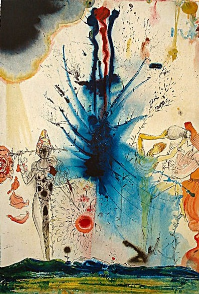
«Земля, текущая молоком и мёдом»

А работы Дали на библейские темы свидетельствуют о том, что он был хорошо знаком со священными текстами. Искусствоведы предполагают, что у него, возможно, даже был консультант, который комментировал и разъяснял для него тексты из Танаха. Среди работ Сальвадора Дали, посвящённых еврейским мотивам, особый интерес вызывают несколько серий литографий. Одна из этих серий, состоящая из 25 гравюр, носит название «Алия. Возрождение Израиля» и рассказывает о становлении еврейского государства. Любопытно, что первый из 250 отпечатанных экземпляров этой серии Дали подарил Музею Израиля в Иерусалиме в 1968 г. во время празднования 20-летия государства.