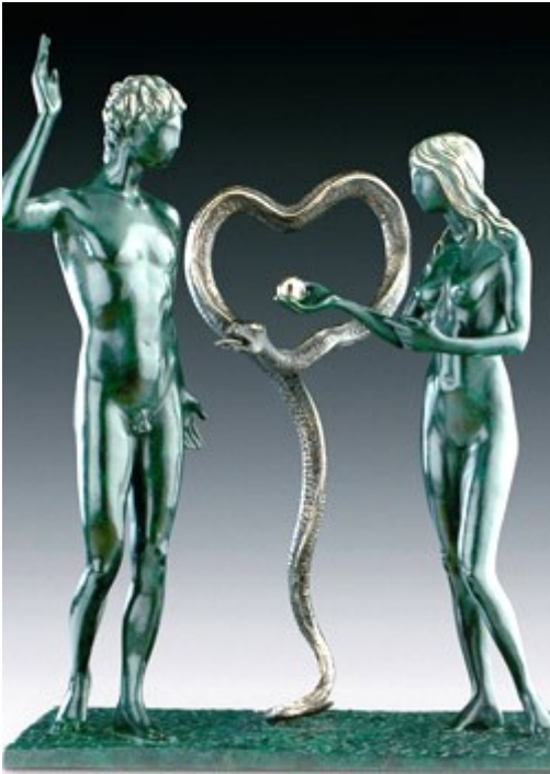
«Адам и Ева»