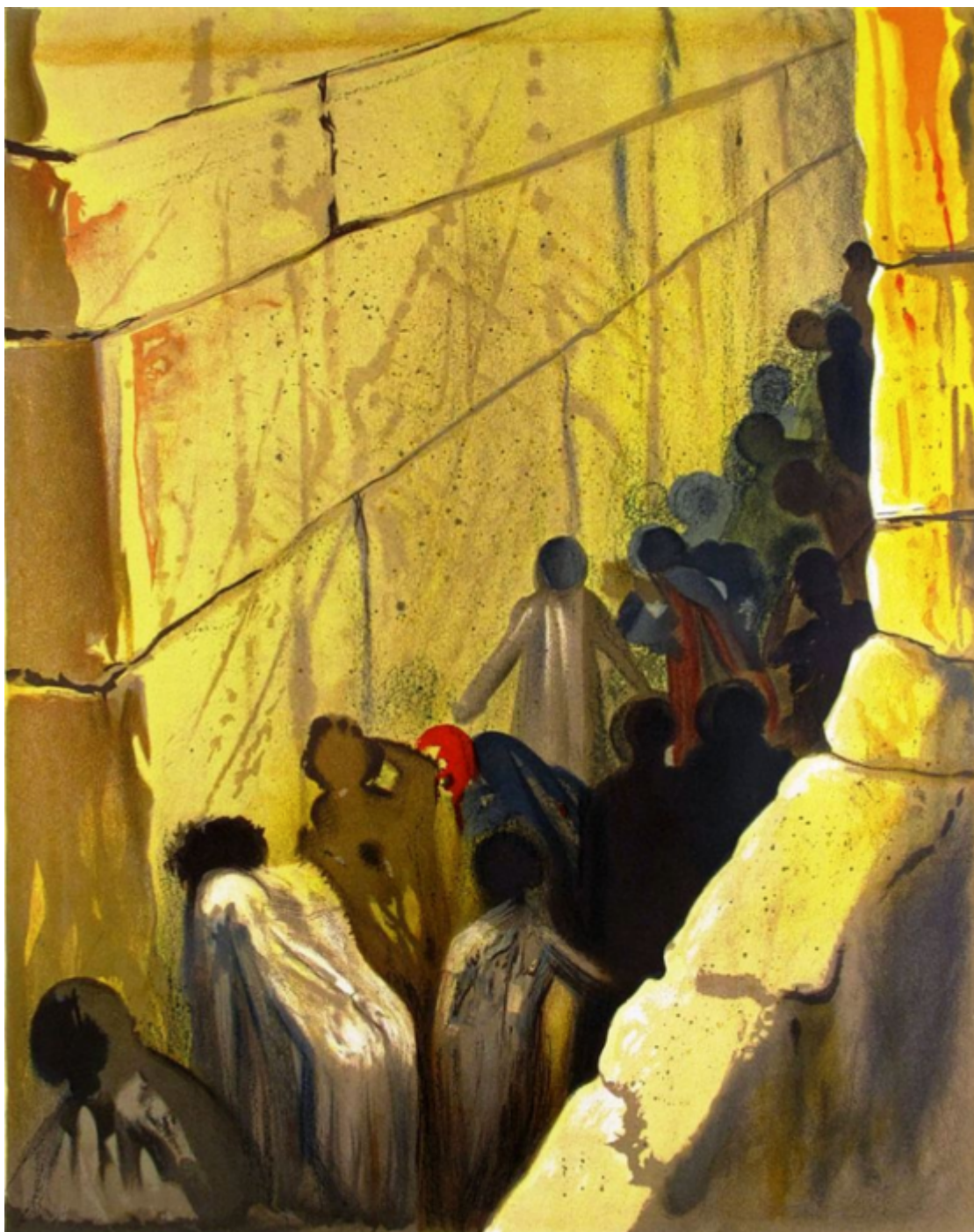
“Котель” («Стена Плача»)

К числу наиболее интересных работ художника по этой тематике относится также рельеф «Моисей и монотеизм». В образе Моисея Дали прослеживает связь между иудаизмом и христианством, считая этого пророка неевреем и подчеркивая египетское происхождение Моисея. Свое восхищение гениями еврейского народа и Израиля Дали выразил также в выполненных в технике гравюры портретах великого физика Альберта Эйнштейна, психоаналитика Зигмунда Фрейда, генерала Моше Даяна и политика Давида Бен-Гуриона. Уже после смерти художника, в июле 1998 г., состоялось открытие пятиметровой бронзовой Меноры Мира работы Сальвадора Дали перед входом в израильский аэропорт им. Бен-Гуриона. На открытии этой скульптуры были оглашены замечательные слова великого художника, которые он записал в своём