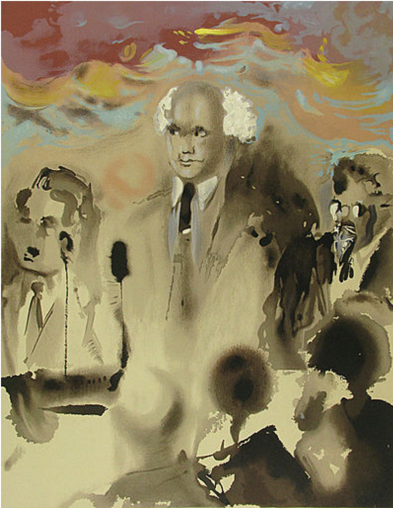
«Провозглашение Декларации независимости»