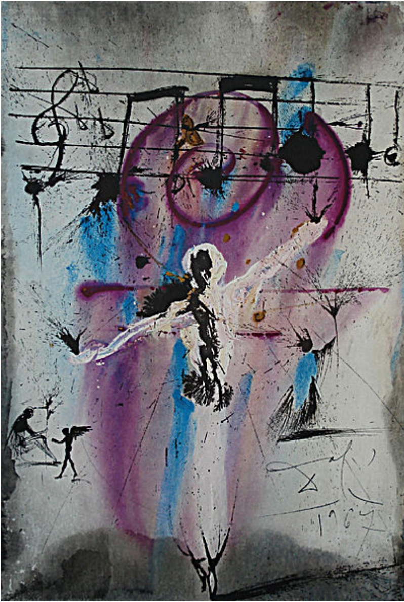
«Хатиква» («Надежда»), гимн Израиля