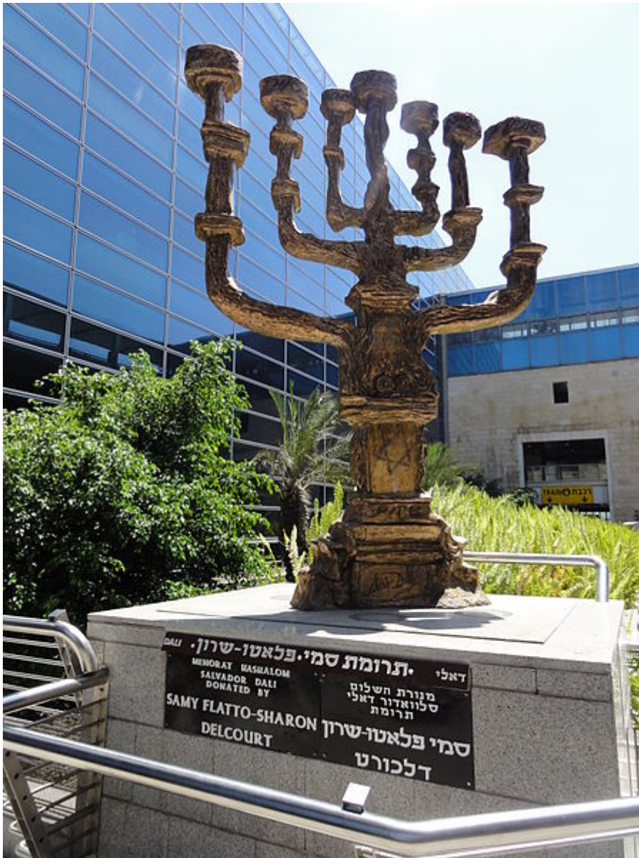
«Менора Мира» у аэропорта им. Бен-Гуриона