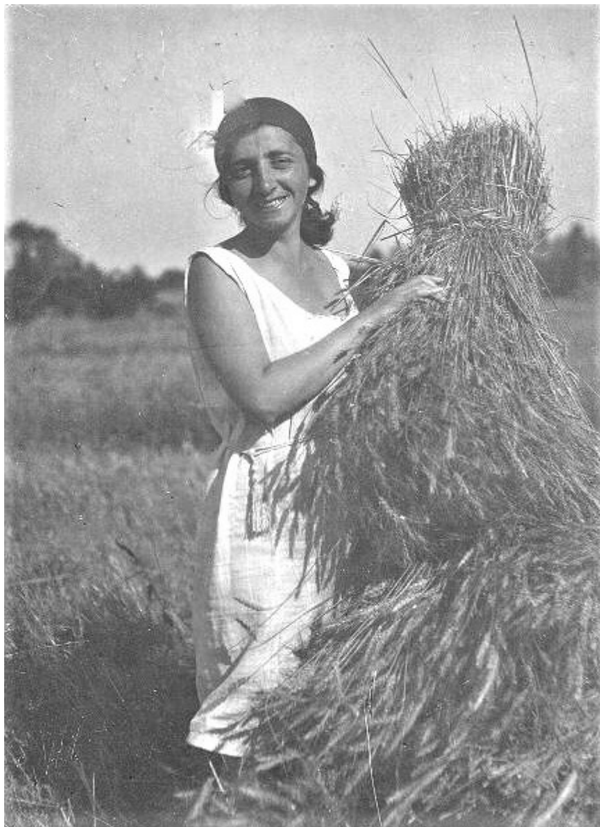
На сельхозработах, конец 1920-х гг.