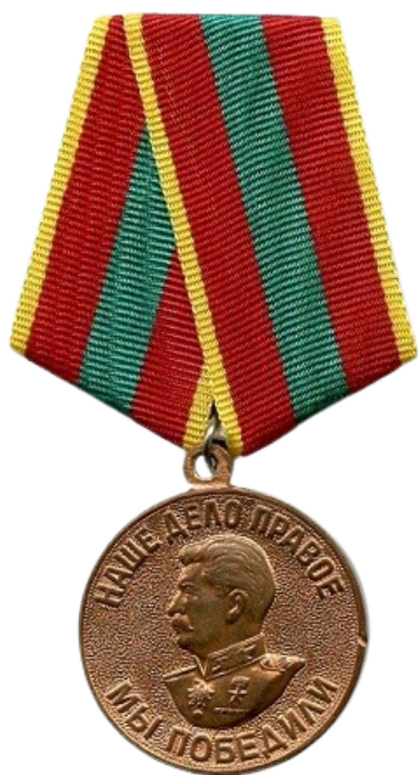
Медаль «За доблестный труд в Великой Отечественной войне 1941-1945»