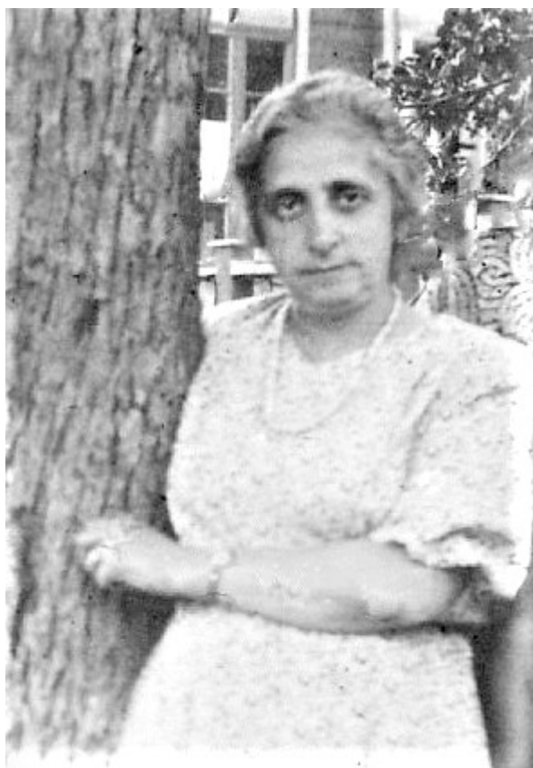
В доме отдыха „Коробовы Хутора“ под Харьковом, август 1947 г.