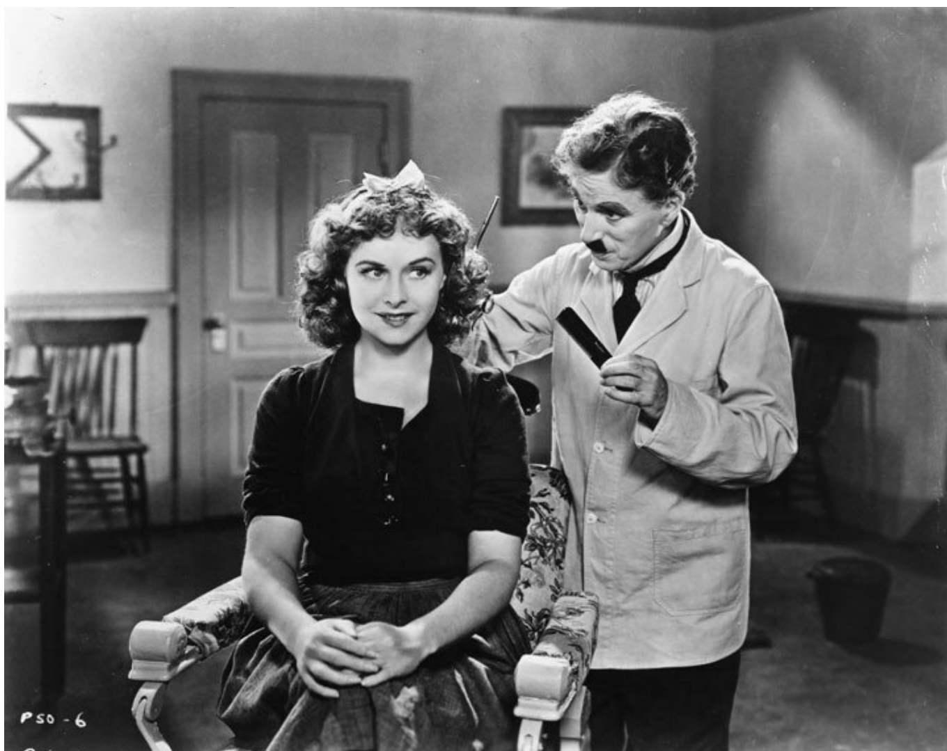
Кадр из фильма „Великий диктатор“, 1940 г.