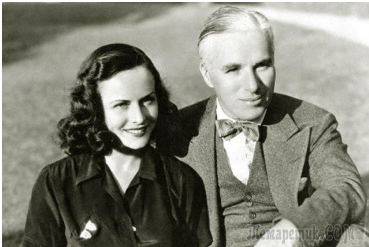
Полетт и Чарльз Чаплин