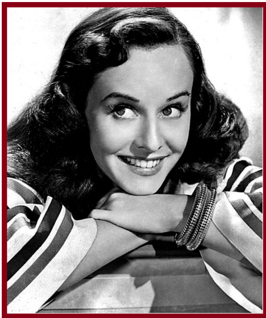
Кинозвезда Полетт Годдар, 1940 г.

В Лос-Анжелесе на престижной голливудской „Аллее славы“, на Вайн-стрит, 1652, установлена её именная звезда. Она была необыкновенно красивой, живой, веселой, открытой, харизматичной, взбалмошной. И при этом умной и самодостаточной. Женщины ее ненавидели. А на мужчин она производила неизгладимое впечатление. Она сыграла около 70 ролей в кино и на телевидении. Была номинирована на премию «Оскар». У неё было несколько мужей, в том числе гении – Чарли Чаплин и Эрих Мария Ремарк, а также череда любовников. Звали её Полетт Годдар.