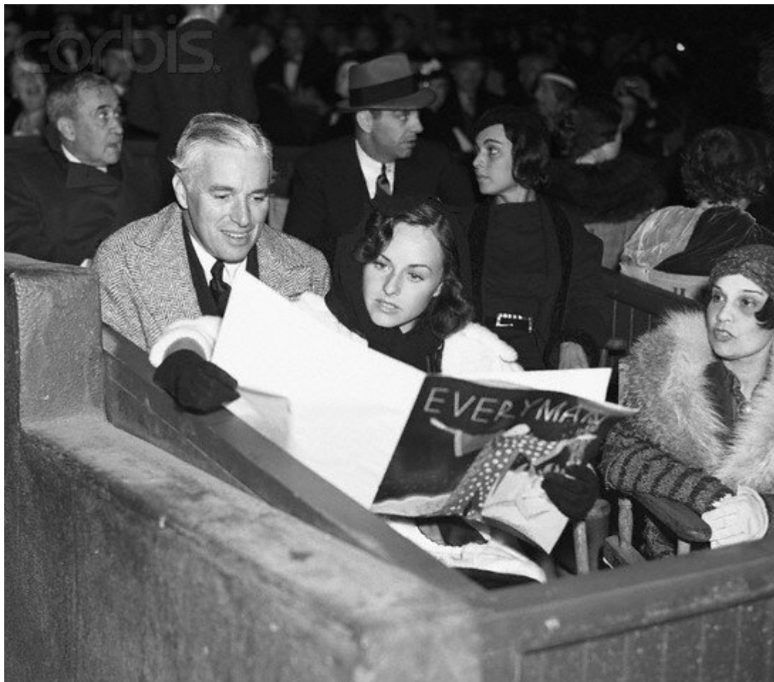
Чарли Чаплин и Полетт Годдар на скачках

Полетт растопила лед в сердце Чарли, научила его понимать женщин такими, какие они есть, прощать им их слабости и капризы. Завела дружбу с его сыновьями, стала для них прекрасной мачехой, а они её просто обожали. Однако и по сей день остается загадкой, были ли они действительно женаты. Кстати, Полетт лишилась роли Скарлетт О'Хара в фильме „Унесенные ветром“ из-за того, что не предоставила руководству студии брачное свидетельство. В то время студия строго следила за моральным обликом своих звезд. В качестве утешения Чаплин подарил ей бриллиантовый браслет. Любопытно, что Марлен Дитрих позже вспоминала, что меркантильная Годдар рассказывала, как правильно получать от мужчин бриллианты. Но кто поверит словам одной красивой женщины о другой, тем более, что обе любили одного мужчину?