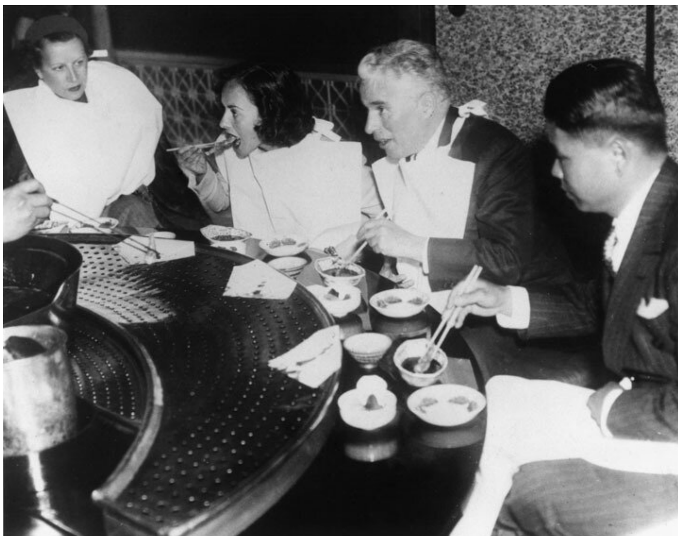
Чарли Чаплин и Полетт Годдар в Японии, 1936 г.

Чарли Чаплин и Полетт Годдар – лучшие сцены из кинофильма „Новые времена“, 1936 г.