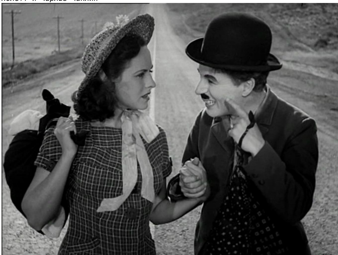
Кадр из фильма „Новые времена“, 1936 г.