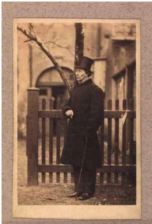
Ханс Кристиан Андерсен, 1862 г