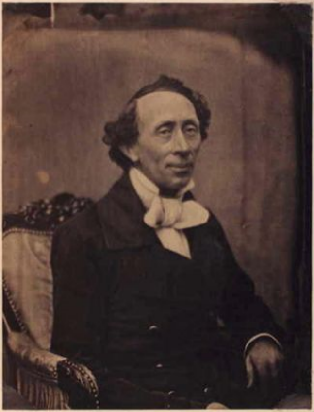
0 1 2 3 4 5 cm Det kongelige Bibliotek