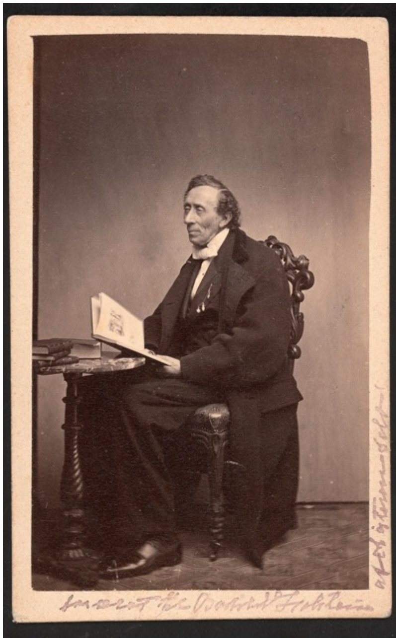
Фотографии Х.-К. Андерсена разных лет