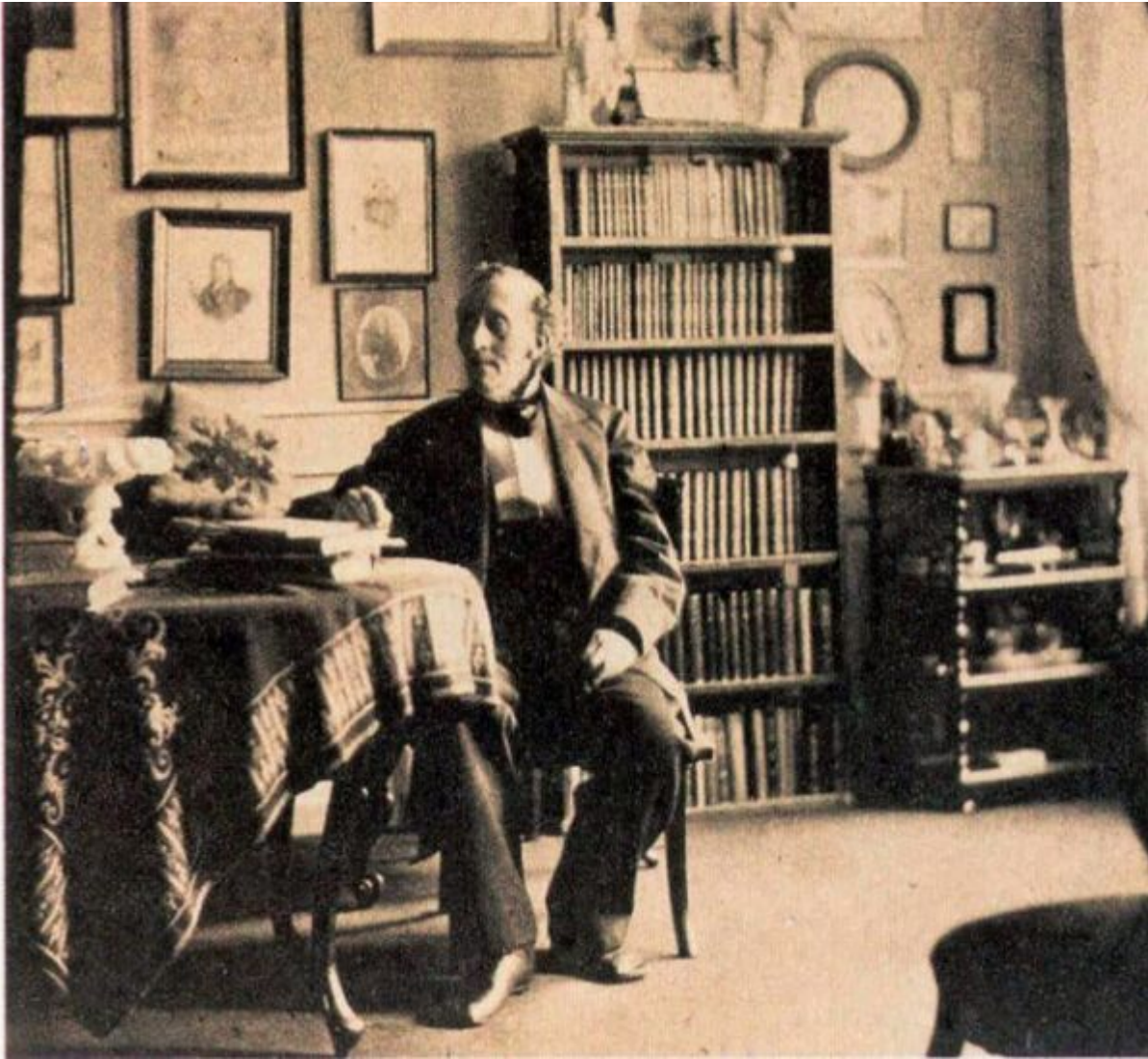
Х.-К. Андерсен в своей квартире «вечно холостяка», 1874 г.