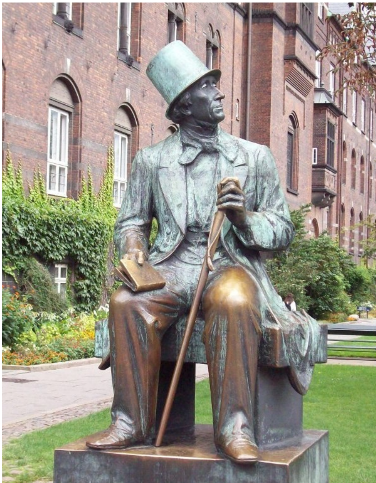
Памятник Андерсену в Копенгагене