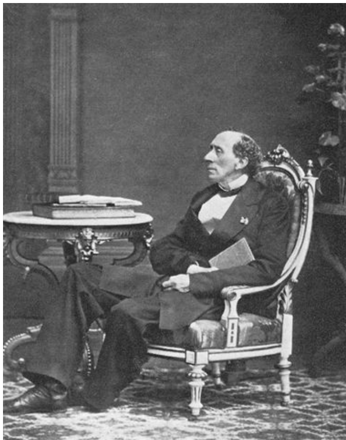
Х.-К. Андерсен, 1868 г.