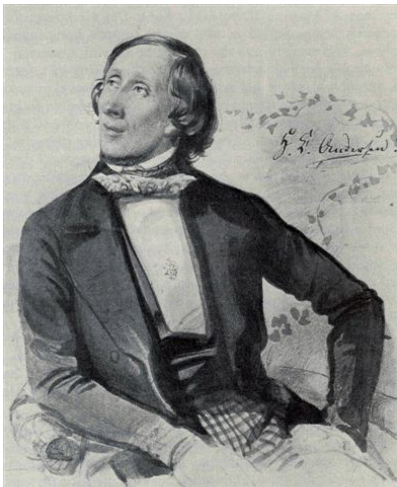
Ханс Кристиан Андерсен, 1845 г.

О погроме, увиденном им в детстве, писатель рассказал в романе «Всего лишь скрипач». Еврейская тема, разумеется, не была основной в творчестве Андерсена, но, помимо этого романа, она присутствует еще в нескольких его романах, рассказах и сказках. В кругу его близких друзей были евреи, и по меркам своего времени Андерсен мог считаться филосемитом.