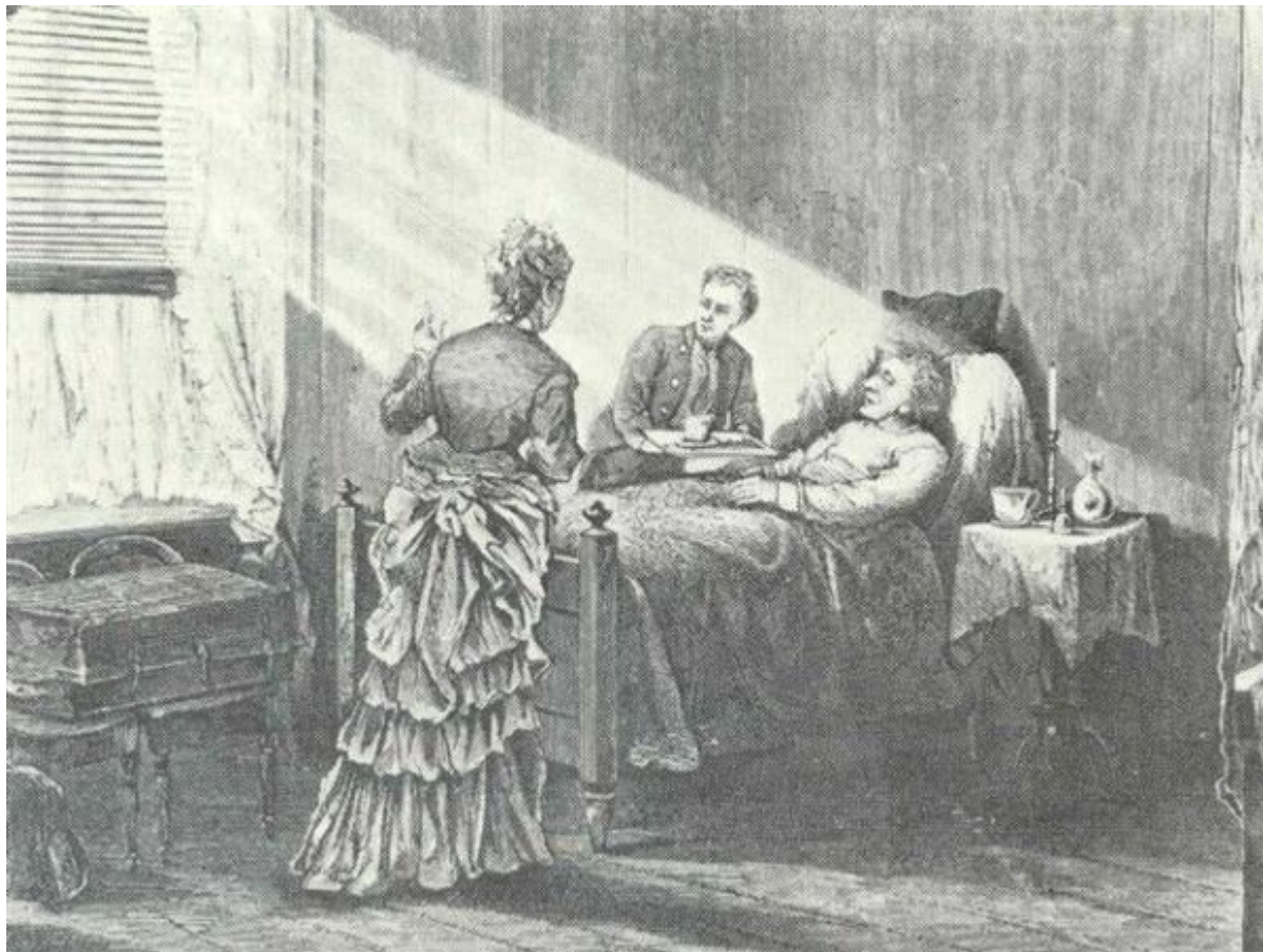
Х.-К. Андерсен на смертном ложе в „Ролигхеде“, в доме семьи Мелхиор, 1875г. (рис. неизв. художника)

одеяло. Вчера, после ухода доктора Мейера, Ханс Кристиан сказал мне: „Доктор собирается вернуться вечером – это дурная примета“. Я ему напомнила, что доктор приходит к нему уже две недели подряд два раза в день, утром и вечером. Мои слова успокоили его. И вот свет погас. Смерть – как нежный поцелуй! В 11 часов 5 минут наш дорогой друг вздохнул в последний раз...“ Этот дневник в 12 томах был издан через сто лет после смерти сказочника.