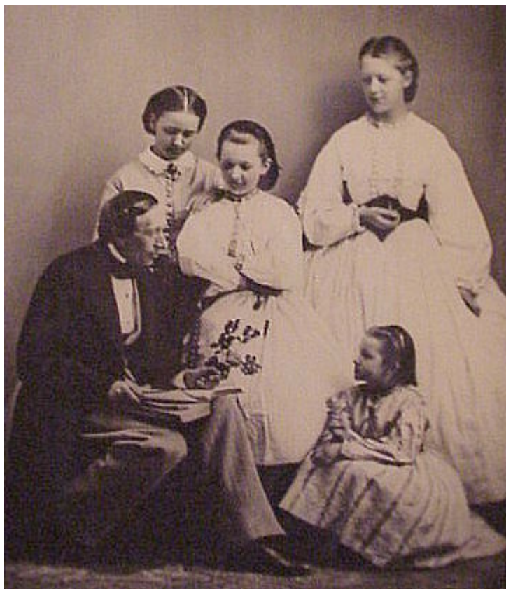
Андерсен читает сказки детям, 1863 г.

мать отвела сына к Федеру Карстенсу, и тот принял мальчика в свою школу. Этот факт был известен всем биографам писателя. Но только очень немногие из них отмечают, что директор школы Карстенс был евреем, а сама школа – еврейской. Впоследствии Андерсен сочинил несколько сказок на еврейские темы ( Only a Fiddler , The Jewish Maiden ), которые никогда не переводилась на русский, а в его биографии на русском языке до последнего времени отсутствовал тот факт, что будущий писатель в подростковом возрасте был свидетелем еврейского погрома.