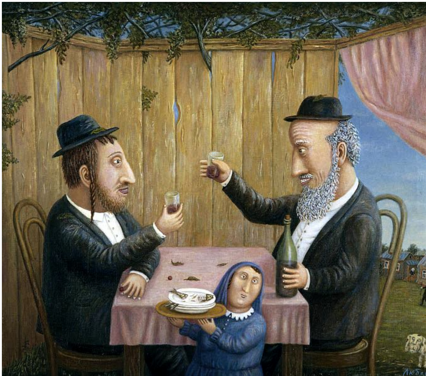
„Праздник в шалаше“