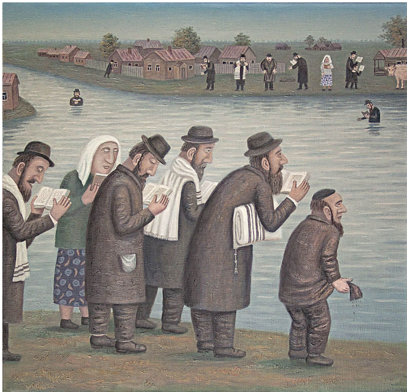
«Ташлих» (моление у воды)