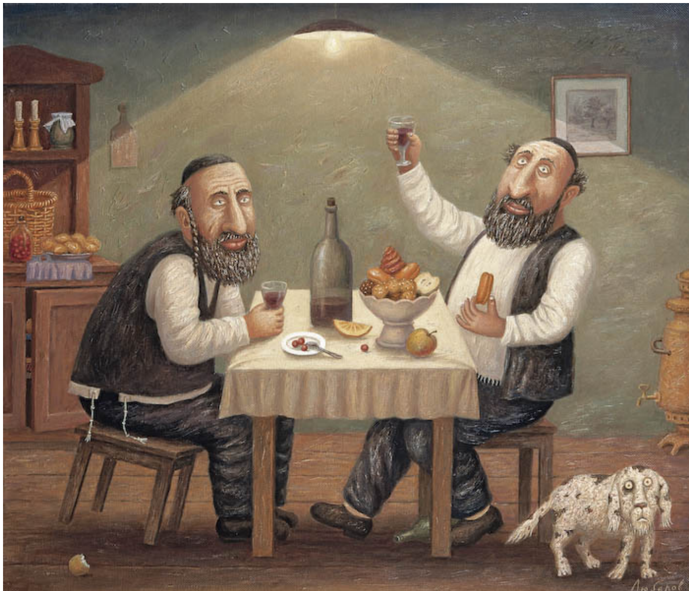
„За здоровье Мордехая!“