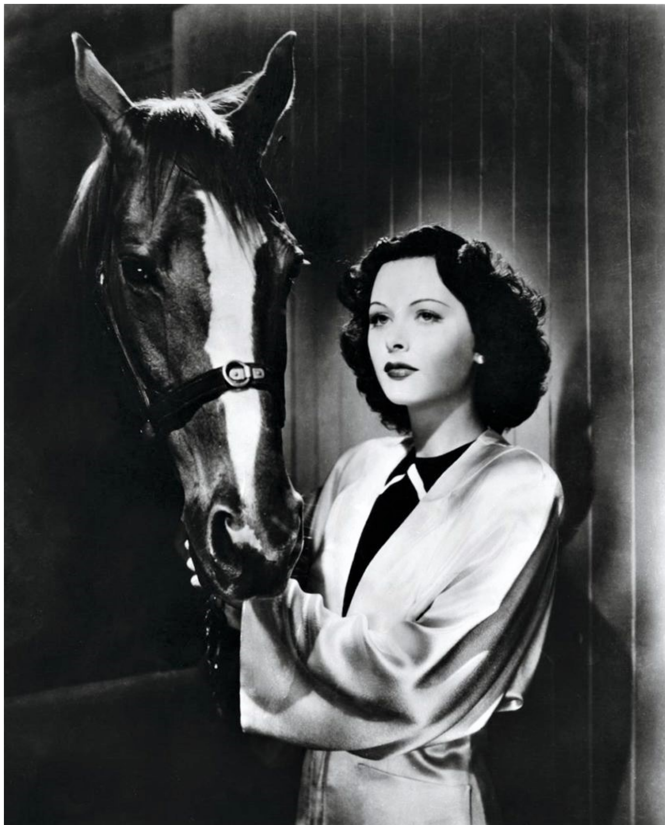
Кадр из фильма «Шумный город», 1940 г.