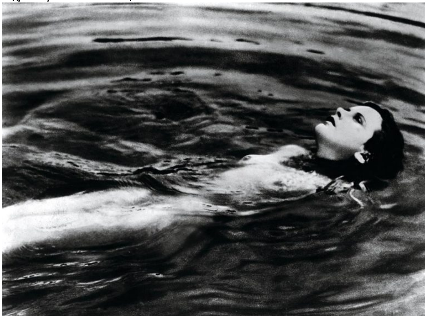
Кадр из фильма «Экстаз», 1933 г.