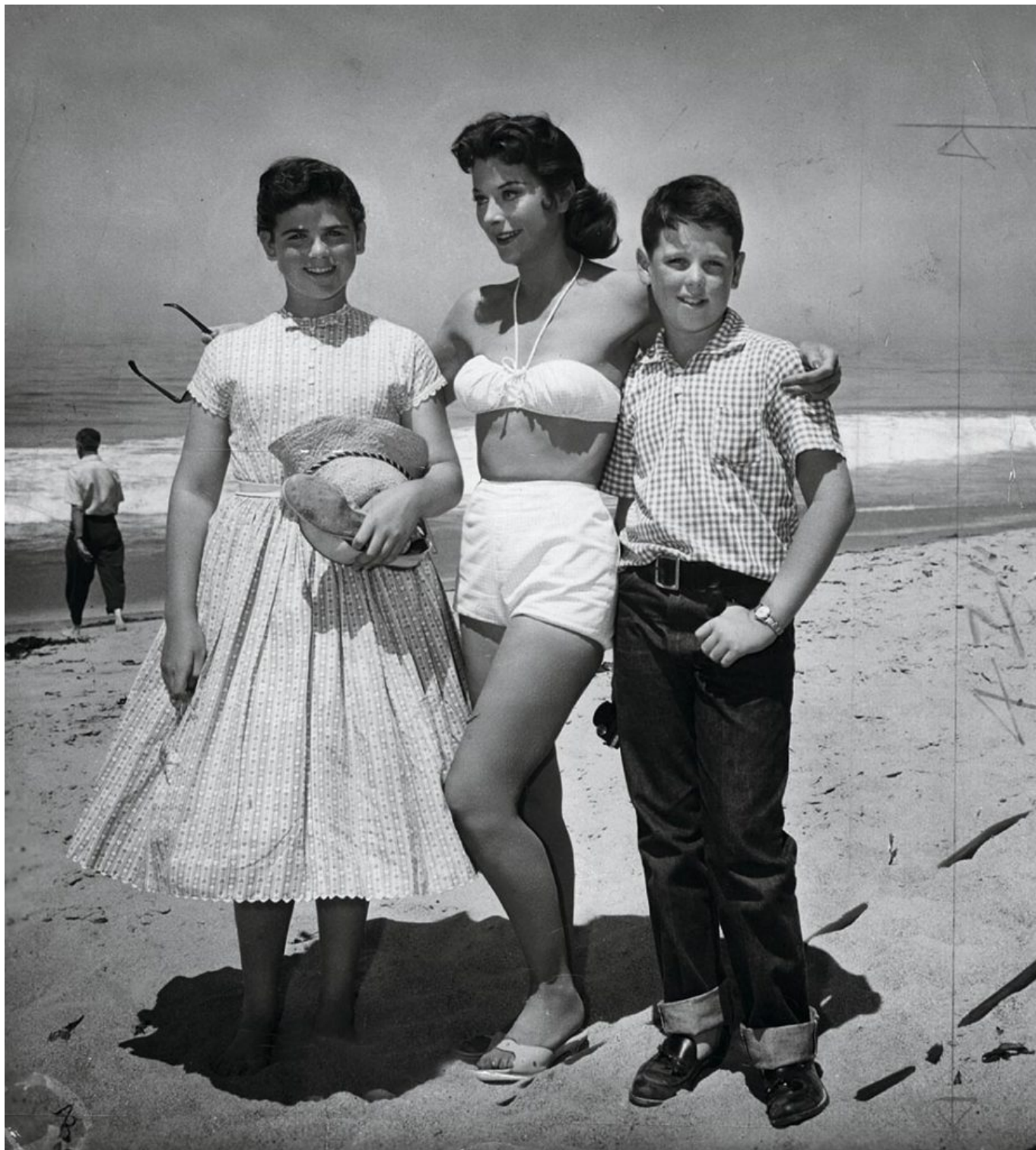
Хеди Ламарр с детьми