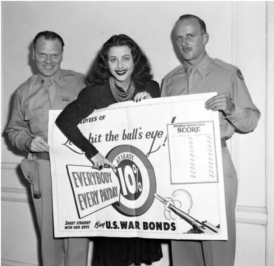
Хеди Ламарр в рекламе облигаций оборонного займа