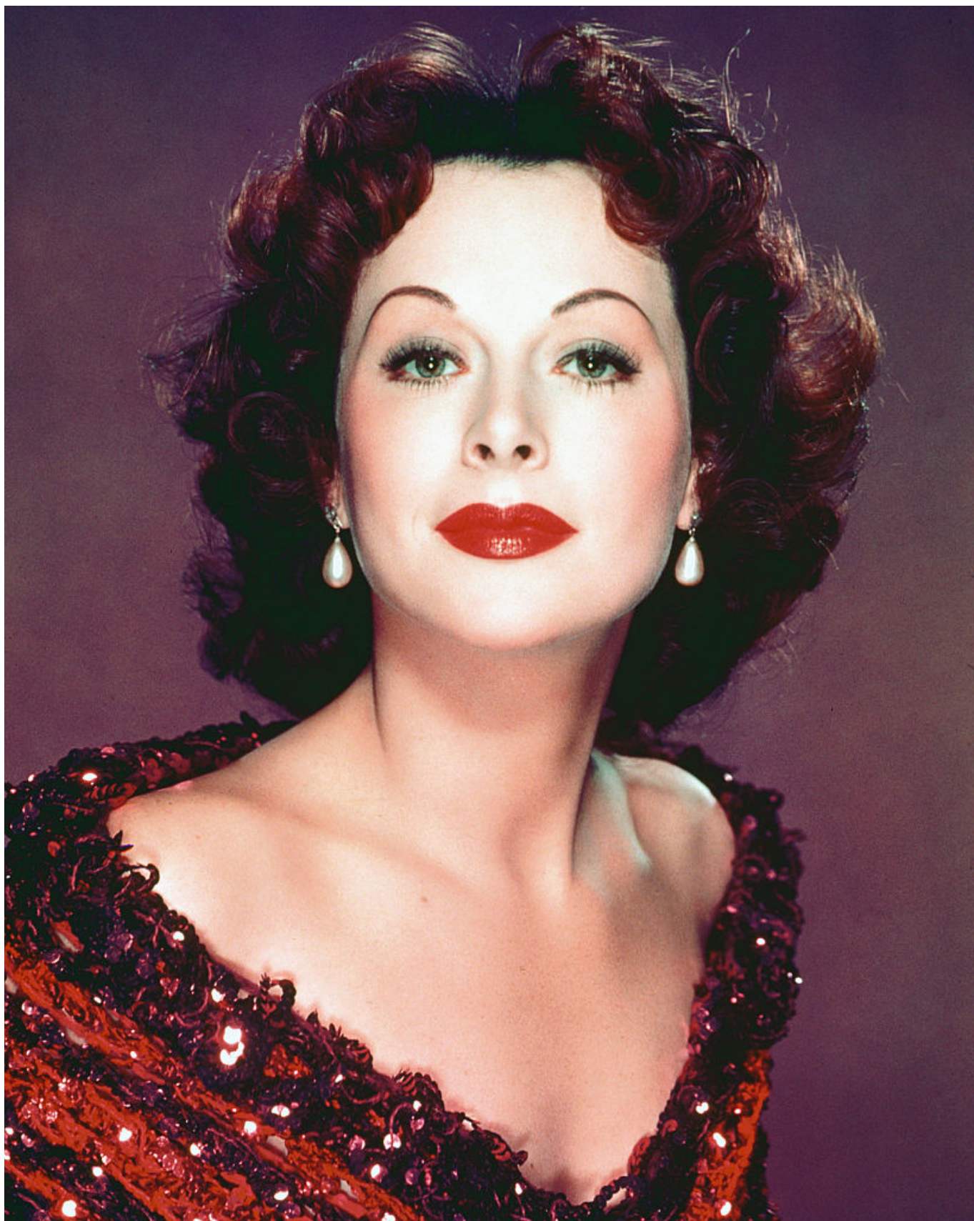
Хеди Ламарр, 1950 г.