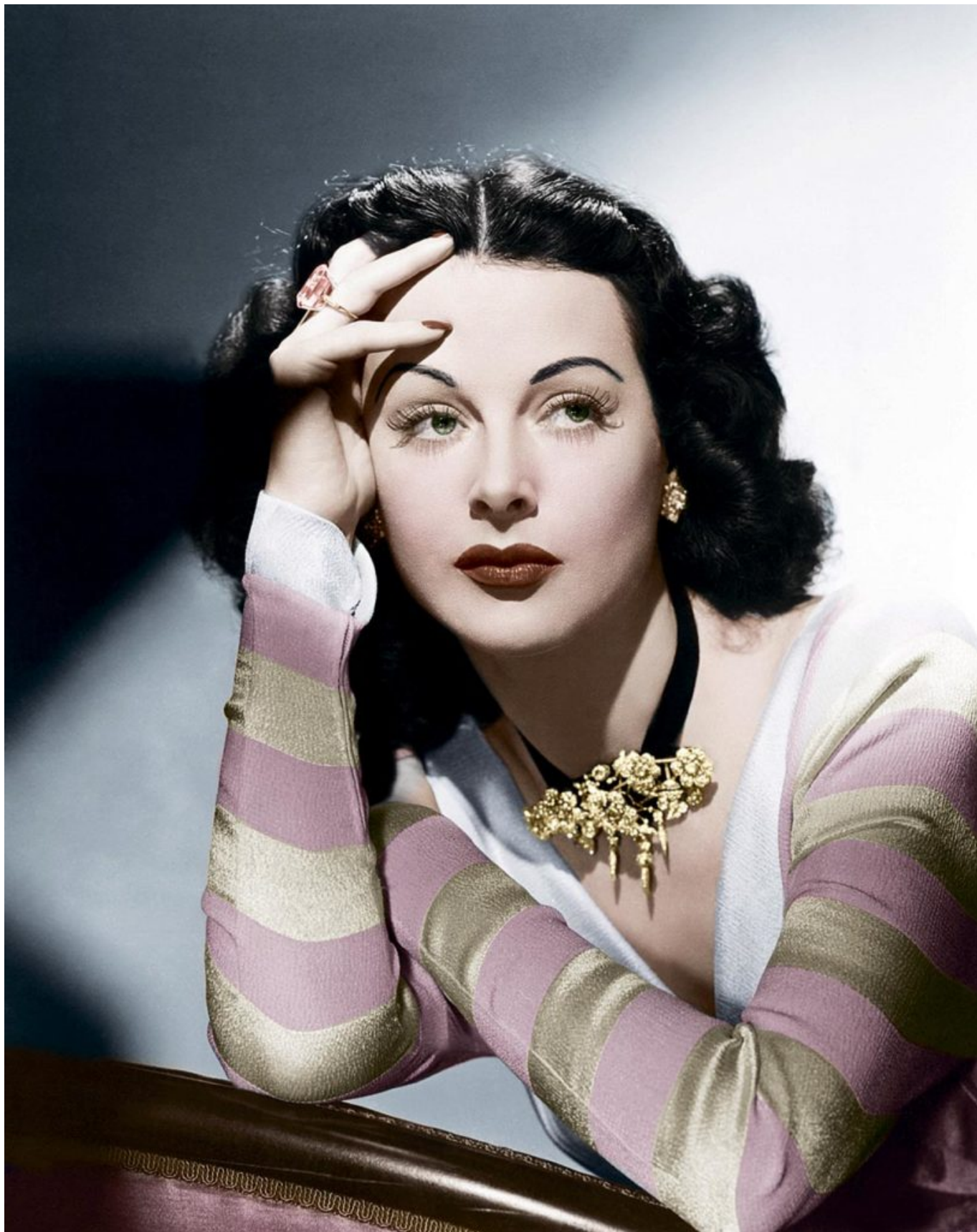
Студийная фотография, 1947 г.