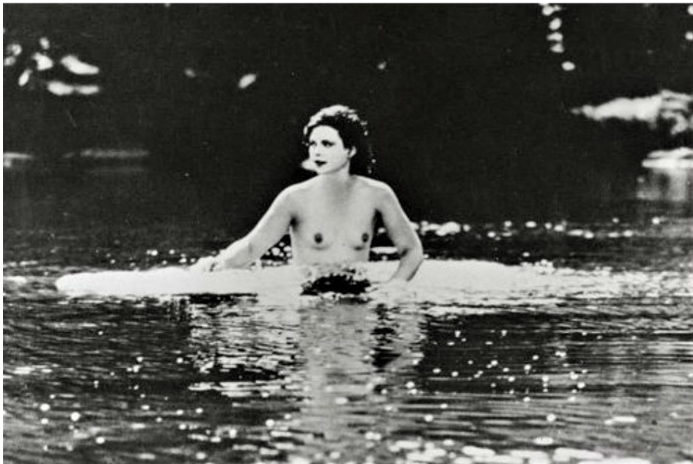
Кадр из фильма «Экстаз», 1933 г.