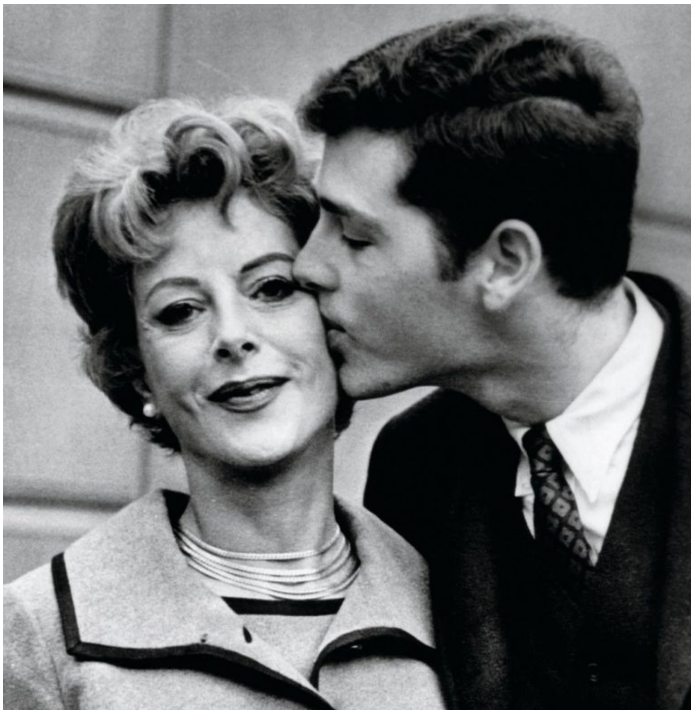
Хеди Ламарр с сыном Энтони, 1966 г.