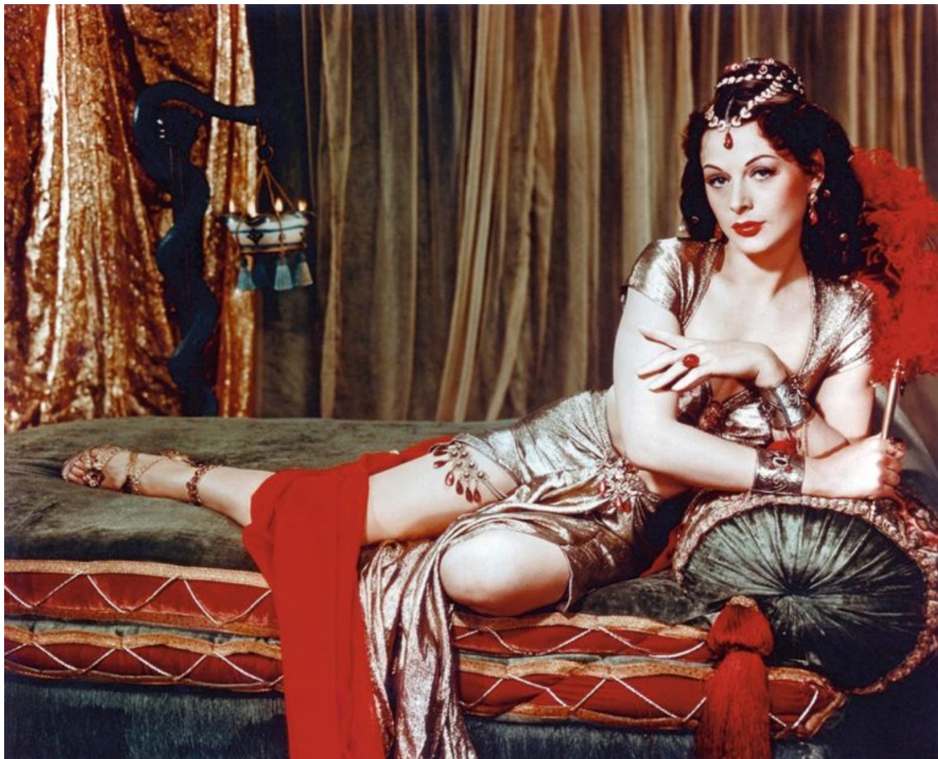
В фильме «Самсон и Далила», 1949 г.