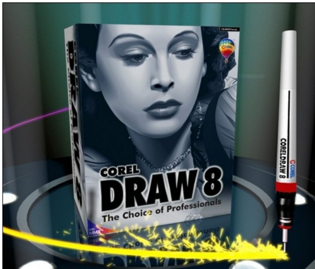
Лицо программного продукта