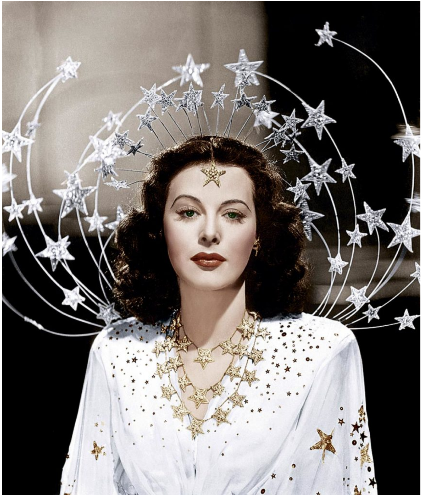
В фильме «Девушка Зигфелда», 1941 г.