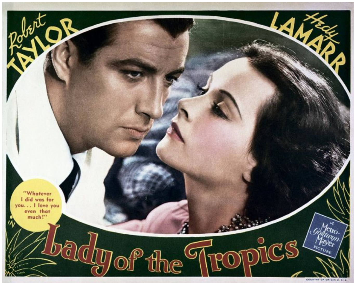
Хеди Ламмар и Роберт Тэйлор в фильме «Леди из тропиков», 1939 г.