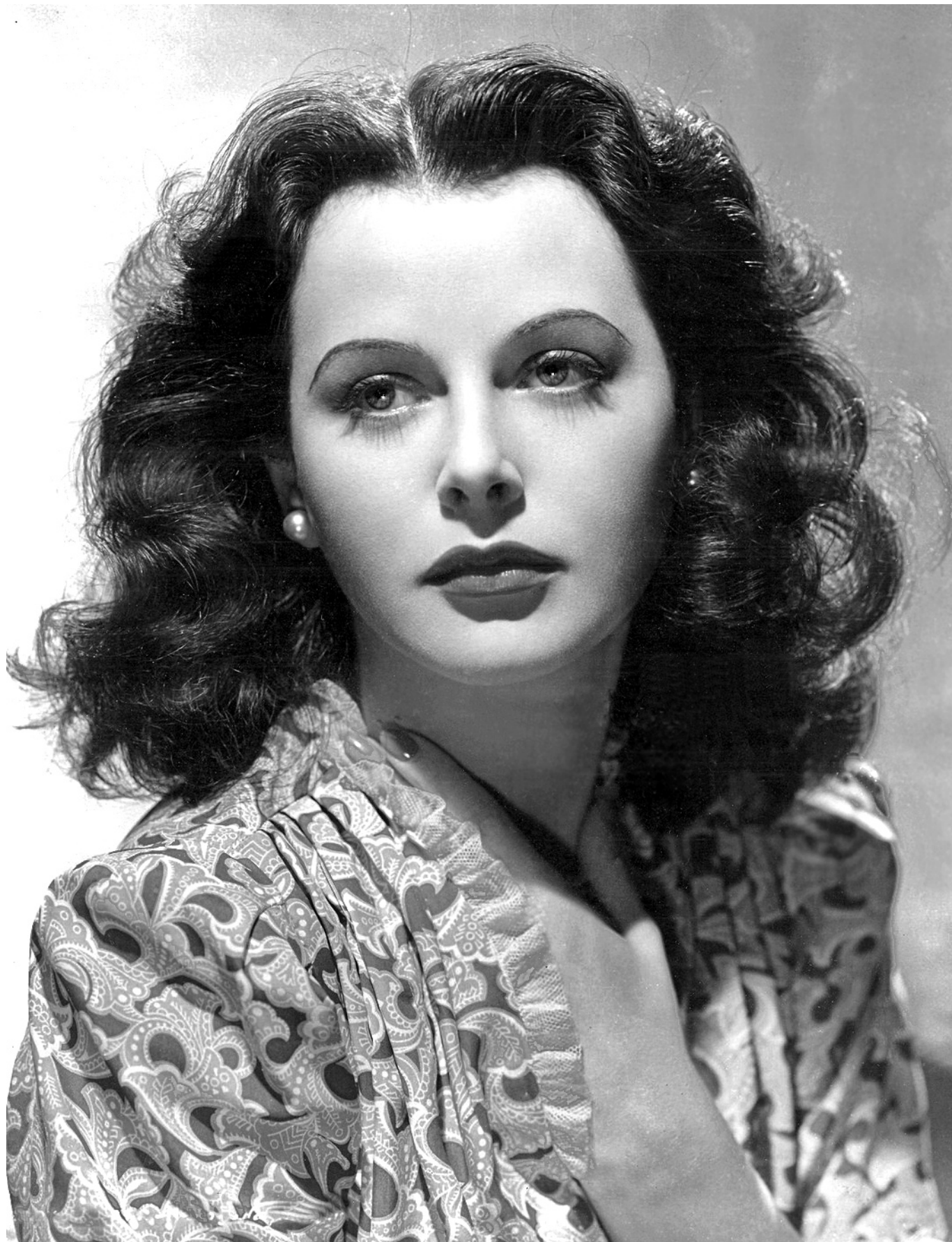
Студийная фотография 1930-х годов