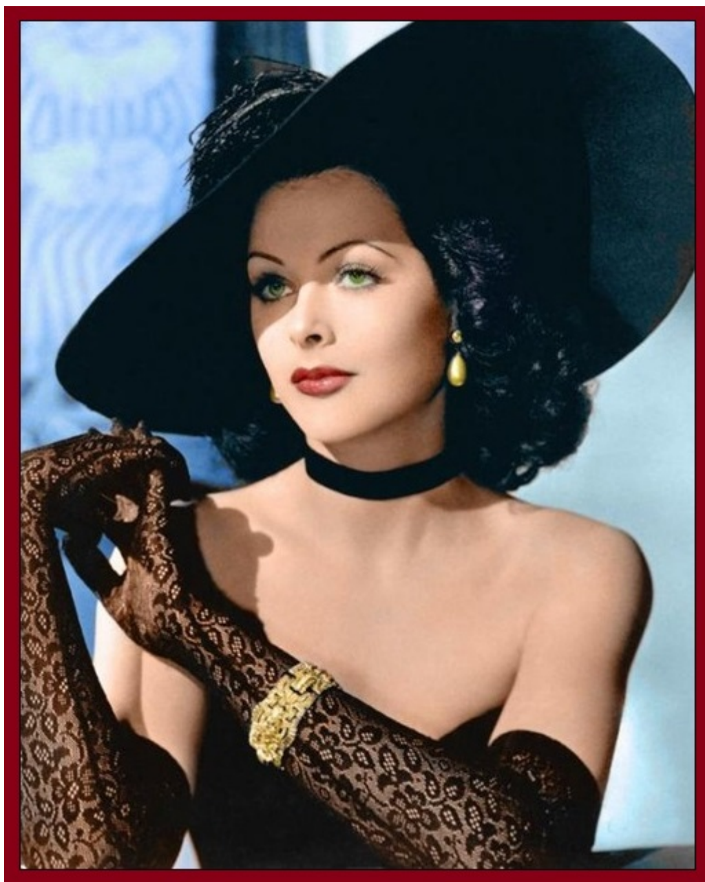
Кинозвезда Хеди Ламарр