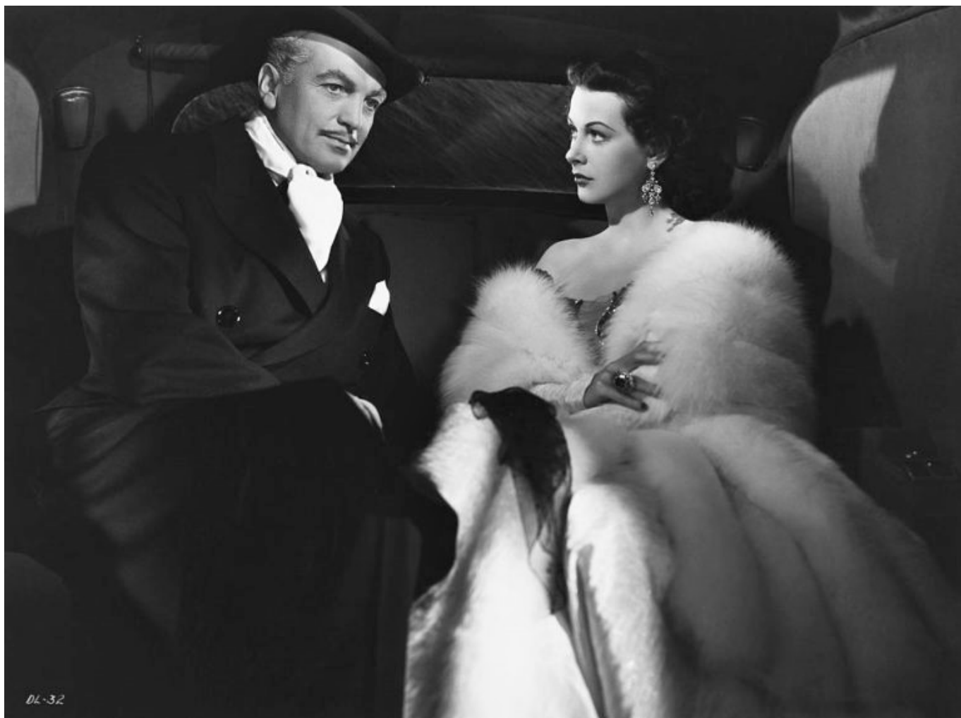
С третьим мужем Джоном Лоудером в фильме «Обещанная леди», 1947 г