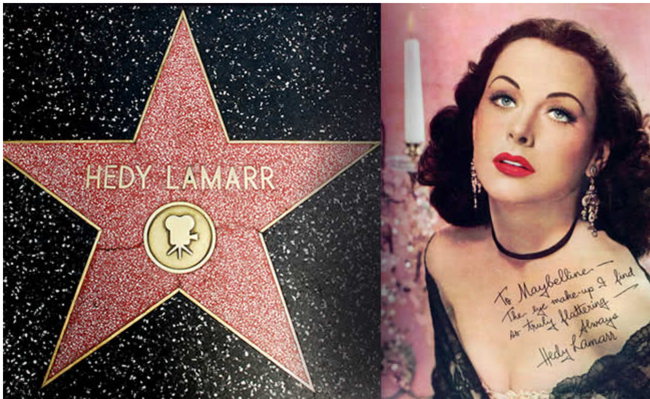
Звезда Ламарр на голливудской Аллее славы и ее автограф

За свой вклад в достижения кинематографа Хеди Ламарр была удостоена персональной звезды на голливудской Аллее славы, а в начале 2014 г. она была внесена в Национальный зал славы изобретателей США (Inventors' Hall of Fame).