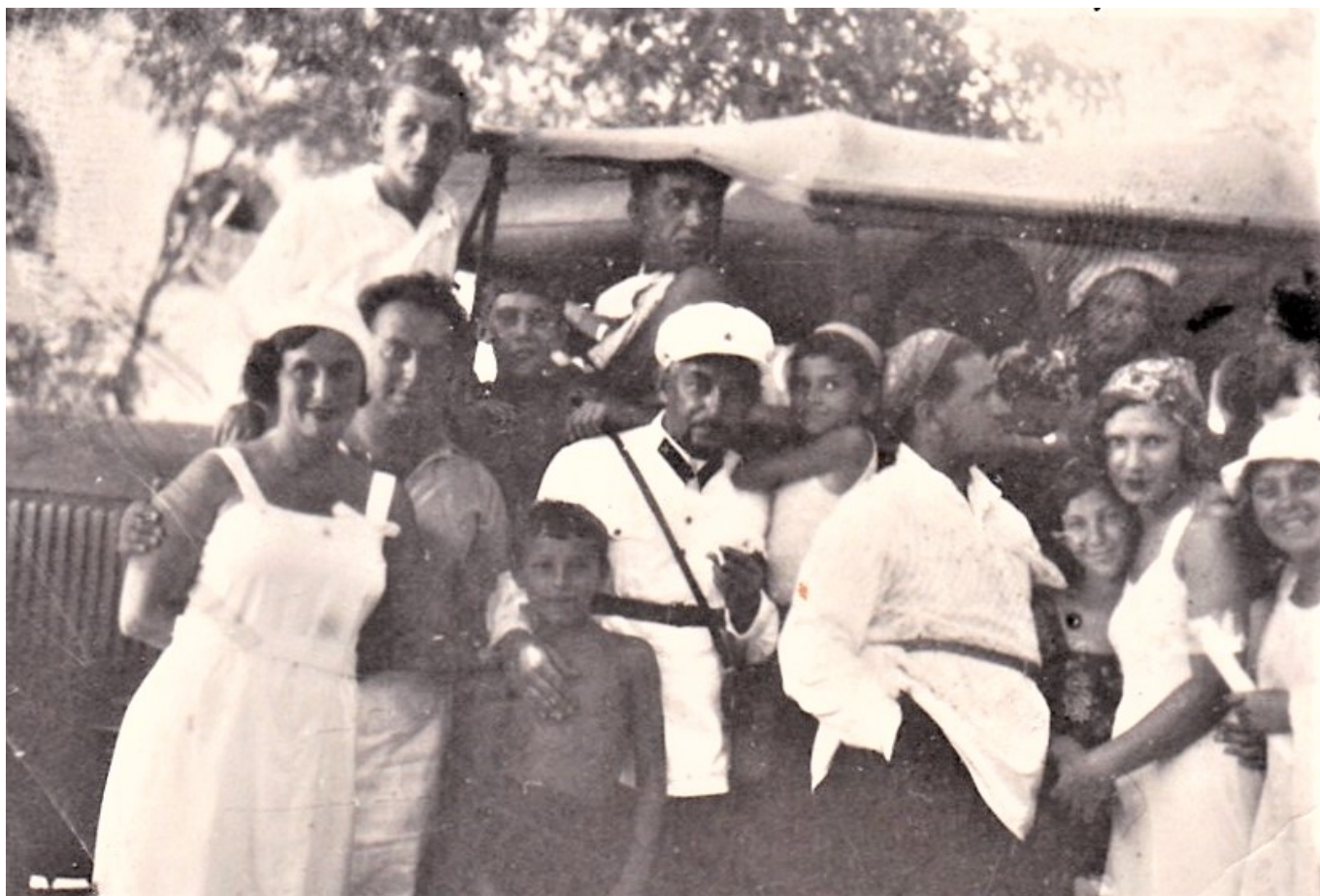
С актерами «дорожного театра», 1933 г.

Чудом сохранилась фотография некоторых афиш этого театра, на которых видны названия спектаклей – «Платон Кречет» А.Корнейчука, «Коварство и любовь» Ф.Шиллера, «Мадемуазель Нитуш» по мотивам оперетты Ф.Эрве, «Счастливая женщина» М.Тригера и др. Как видно хотя бы по этому фото, репертуар дорожного театра был самым разнообразным – от водевилей до классики и пьес советского репертуара. Что касается бытовых условий актеров, режиссеров, костюмеров, гримеров, рабочих сцены и производственных цехов дорожного театра, то они были, мягко говоря, спартанскими. А с учетом массового голода, охватившего в 1932-1933 гг. регионы Центрального Черноземья и Поволжья, условия жизни работников театра иногда были просто невыносимыми.