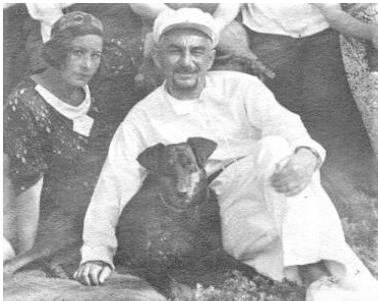
С друзьями на отдыхе, начало 1930-х гг.