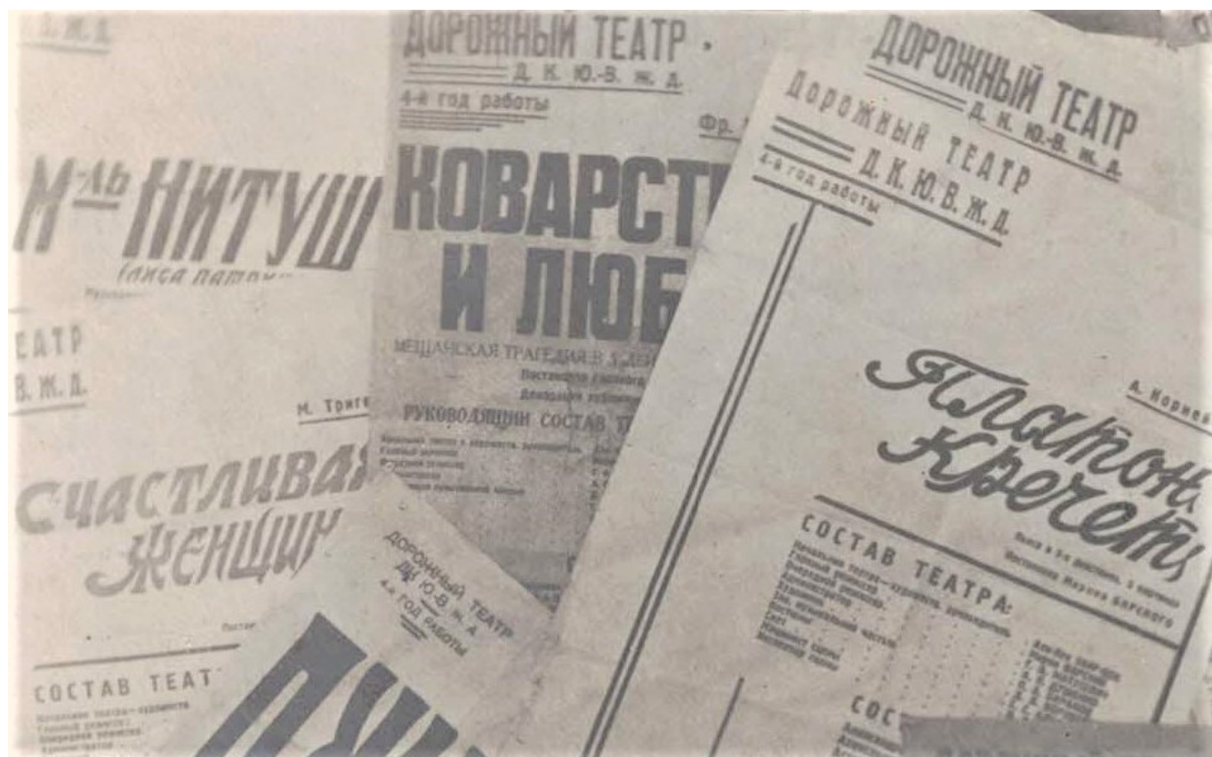
Афиши спектаклей Театра ДК Ю-ВЖД

Дорожный театр исколесил весь регион Центрального Черноземья и части Поволжья, сыграв полторы сотни спектаклей самого различного репертуара. Тогда, в середине 30-х гг., когда ещё не существовало телевидения, а в богом забытых маленьких городках и на небольших железнодорожных станциях даже кино было редкостью, проезд туда профессионального театра и показ его спектаклей в местных клубах или даже в зданиях паровозных депо, было большим праздником и являлось важным вкладом в подъём уровня культуры.