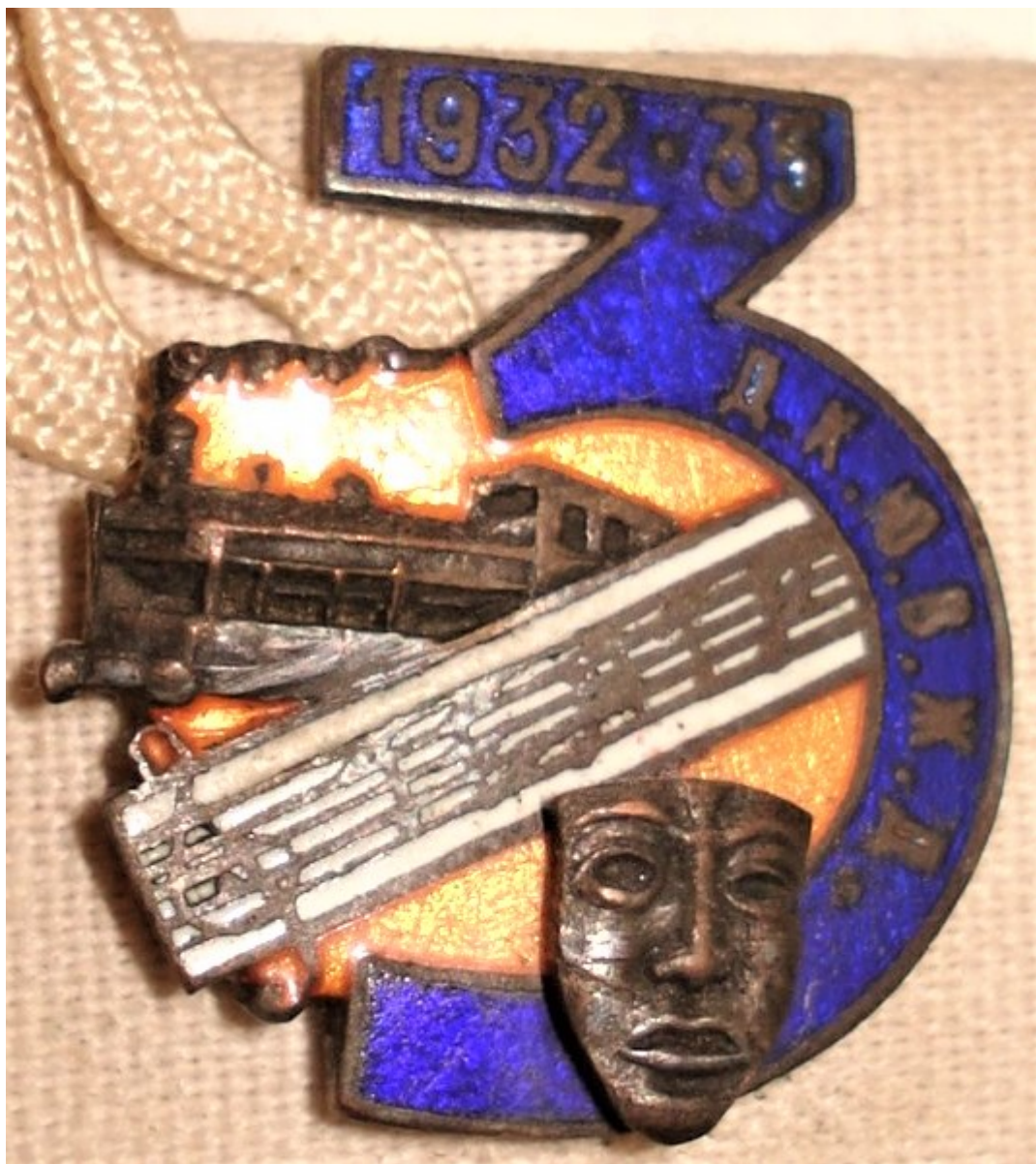
Нагрудный знак к трёхлетию Театра ДК Ю-ВЖД, 1935 г.