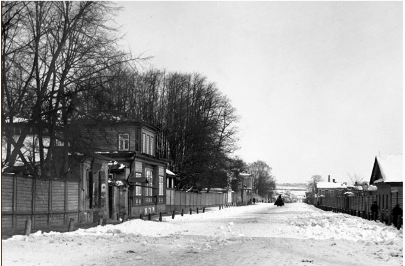
Нижний Новгород, ул.Тихоновская, начало 1920-х гг.