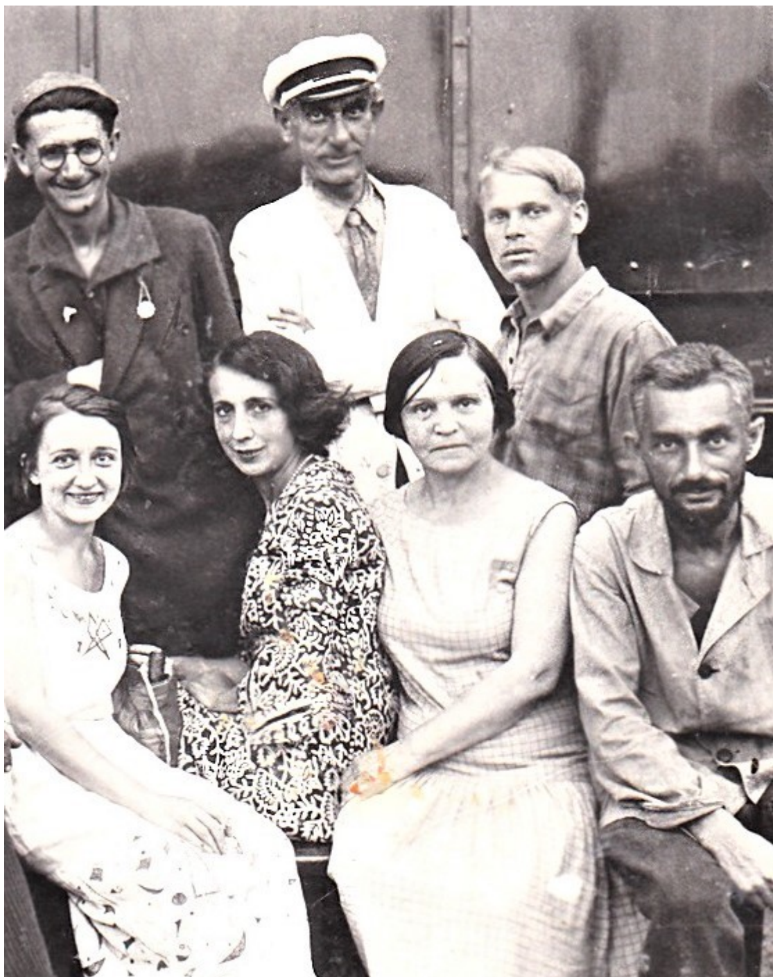
С актерами Театра ДК Ю-ВЖД, 1933 г.