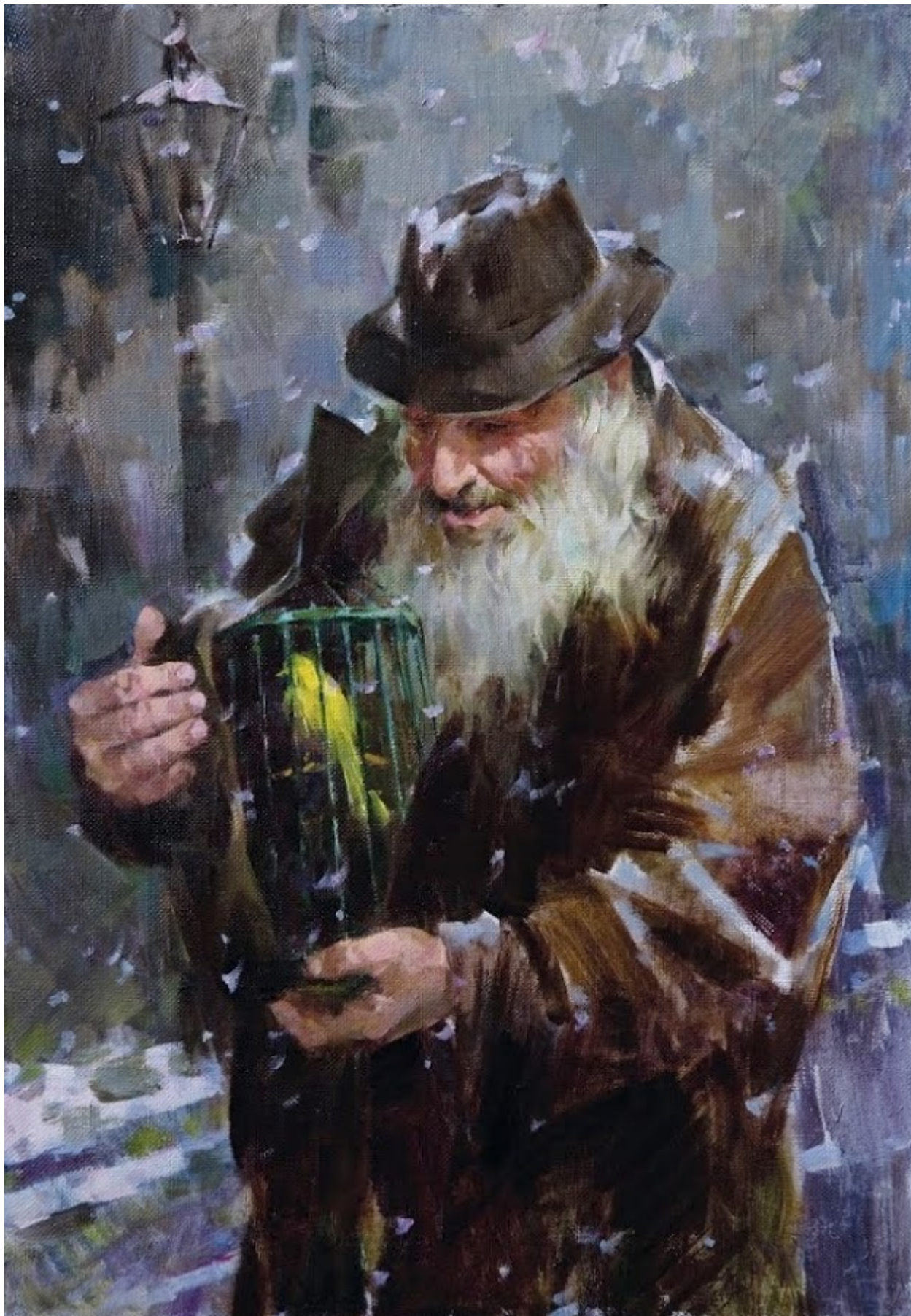
«Старик с канарейкой»