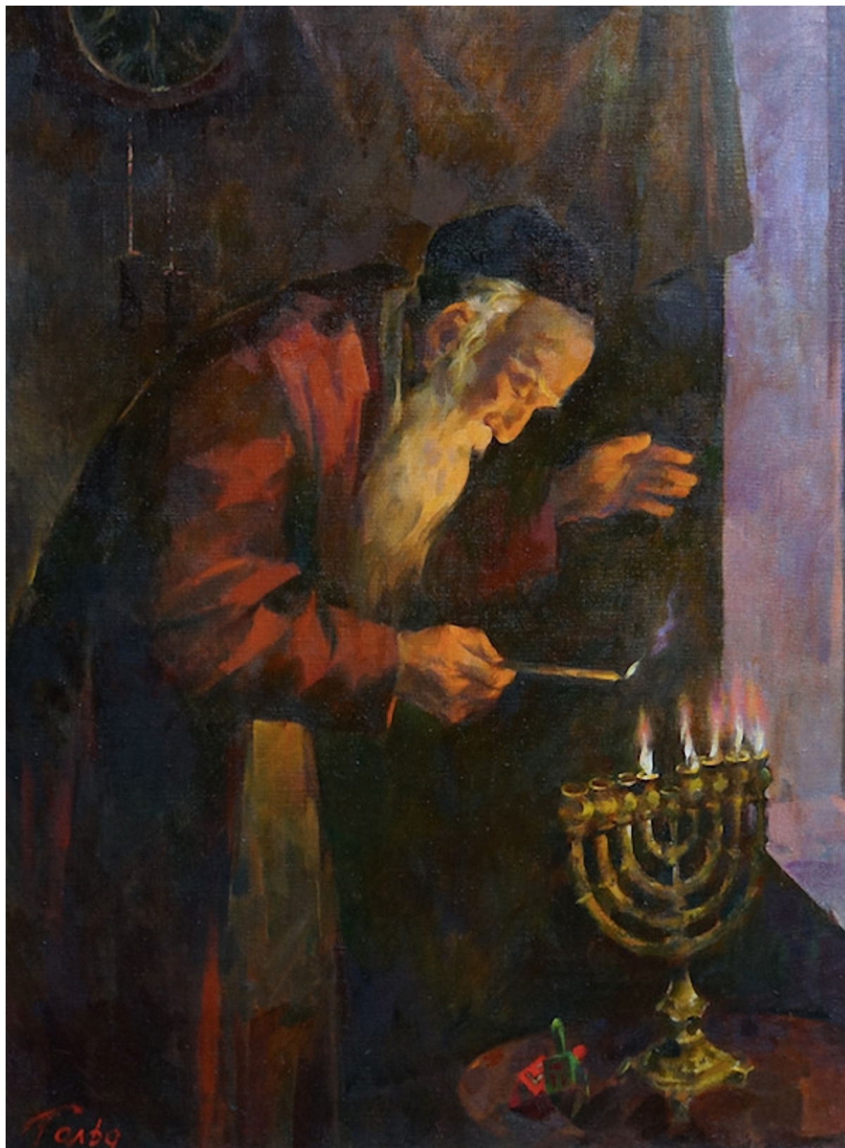
Картина Г. Гольда «Ханука»

Национальное в творчестве Германа Гольда тесно переплетается с личным. В 1971-м он вступил в брак, соблюдая еврейскую традицию: под хупой и с ктубой (брачным договором), составленным стареньким раввином на листке из школьной тетради. На такое в то время решались единицы, ибо слишком велик был риск поплатиться многим. Но именно в те годы «из-под кисти» Гольда одна за одной стали выходить картины из его еврейского цикла, названия которых говорят сами