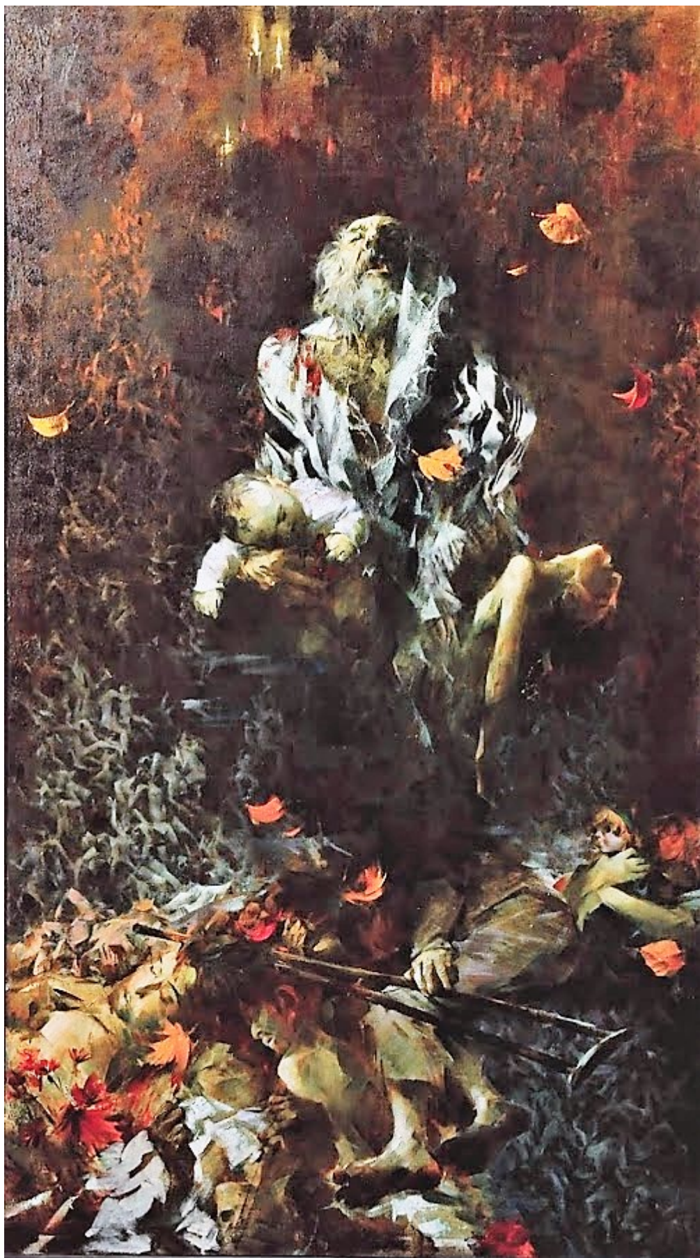
«Вечный зов (Бабий Яр)»