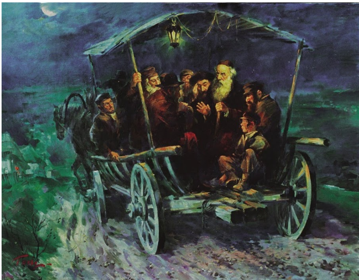
«Учеба в пути»

В этих картинах Мастера зрители могут увидеть и понять мудрость и талант их автора, который бережно сохраняет и доносит до нас ушедший в прошлое самобытный мир еврейского местечка. На многих картинах изображены люди в том возрасте, когда для них главными ценностями становятся не власть и богатство, не погоня за материальными благами, а духовные ценности и переживания, общение с внуками и родными, учениками и природой. Посмотрите на картину «Учёба в пути». С каким вниманием и даже благоговением слушают «пассажиры» телеги, едущей по размытой дождями сельской дороге, этого мудрого старца.