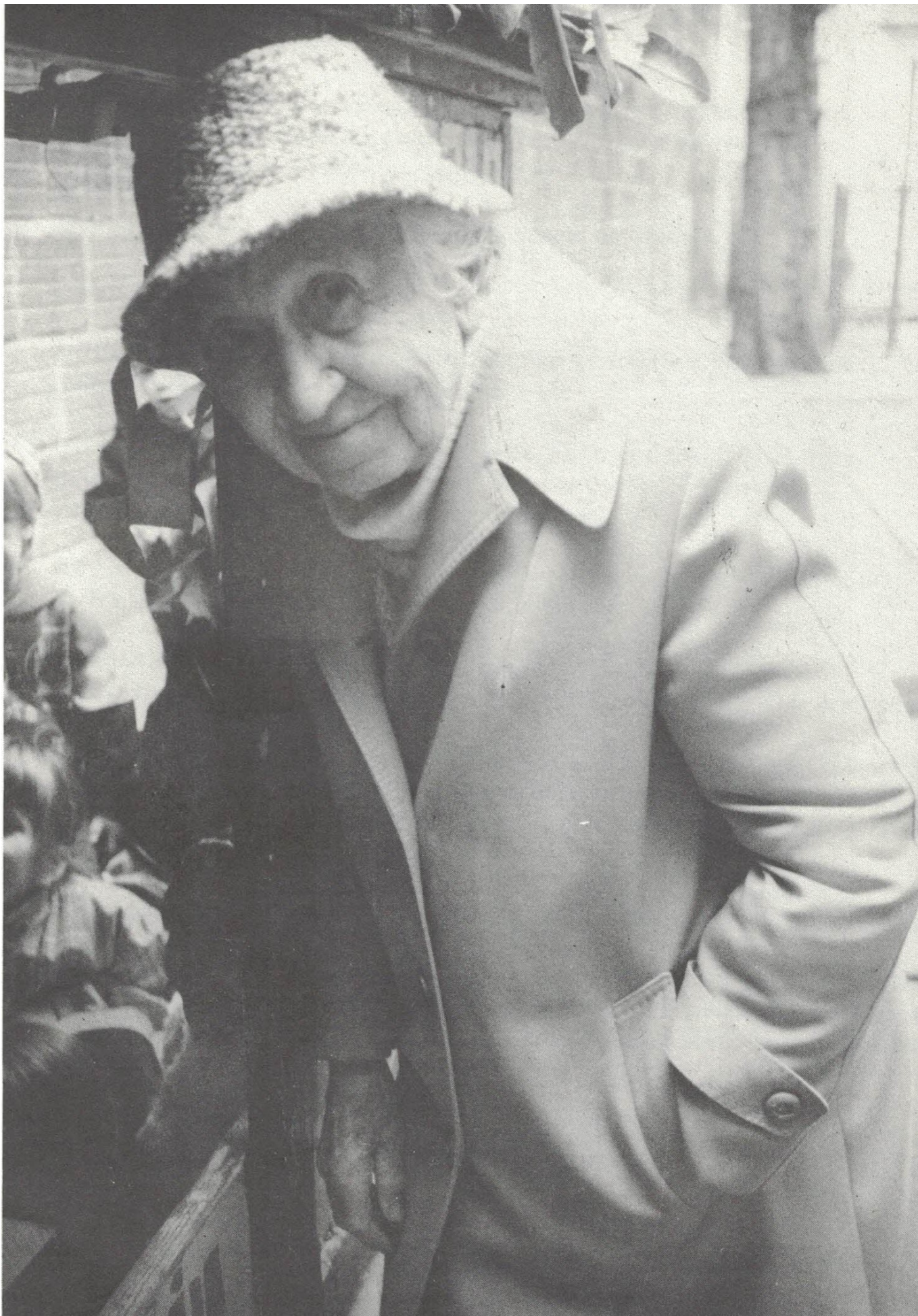
Рашель Гордин в последние годы жизни, Париж